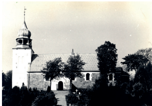
Andst Kirke. Ca. 1960.

I en artikel i 'Fra Ribe Amt' 2005 konkluderede jeg på basis af en række indicier, at relieffet i en indmuret karmsten i våbenhusets sydmur forestiller Kong Valdemar den Store og Dronning Sofia. De blev trolovet i 1154 og gift i 1157.