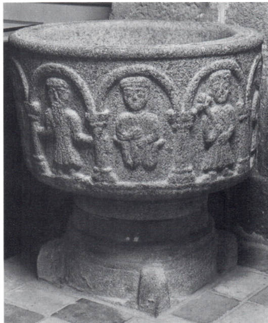
Den romanske døbefont i Andst Kirke. Nat.mus.fot. 1985. Danmarks Kirker, s. 2494.

Den romanske døbefont har en søjlefrise som en arkade med relieffer i de rundbuede felter og er en såkaldt arkadefont.