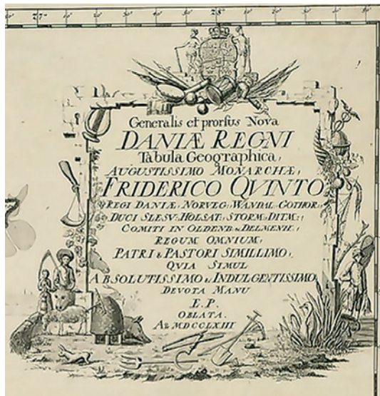
Kartouche med de væsentligste elementer fra danske erhverv. Fæstebøndernes arbejdsområder er gengivet på nederste halvdel. Udsnit af Danmarkskort fra 1763. Erich Pontoppidan: Den Danske Atlas 1763-1781.

fra indskuddene, som han har placeret med en gnidret skrift i marginen.