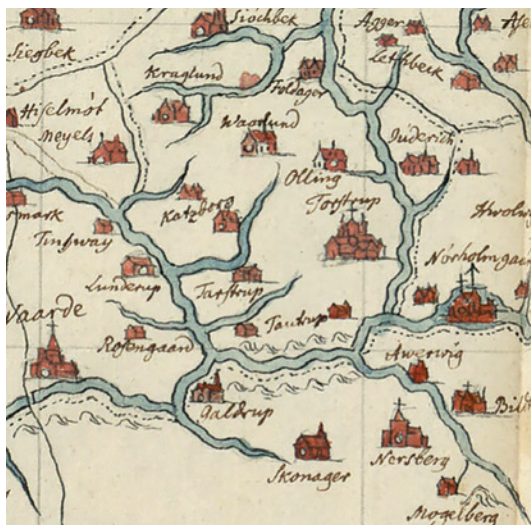
Nørholm eller Nørholmgaard, som herregården lidt øst for Varde blev benævnt på Johannes Meyers kort fra ca. 1650. Udsnit gengivet efter en kopi af Jac. Langebek fra ca. 1760.

Efter disse krav og anvisninger gik herremanden på Nørholm i gang med at skrive: