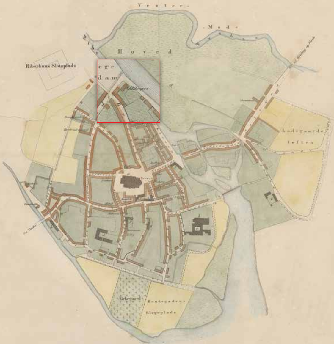
Ribe 1858, bykort. Saltsyderiet er afmærket på kortet.