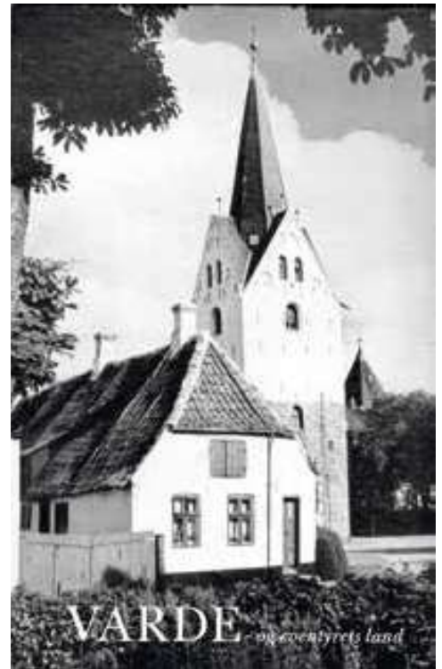
Varde-bogen: Varde og “eventyrets land” i billeder. Formentlig 1955.