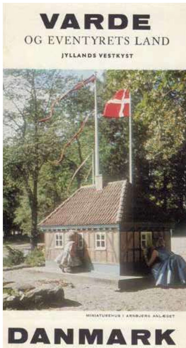
Varde og Eventyrets Land. Jyllands Vestkyst / Eventyrets Land. Jyllands Vestkyst. 1960.