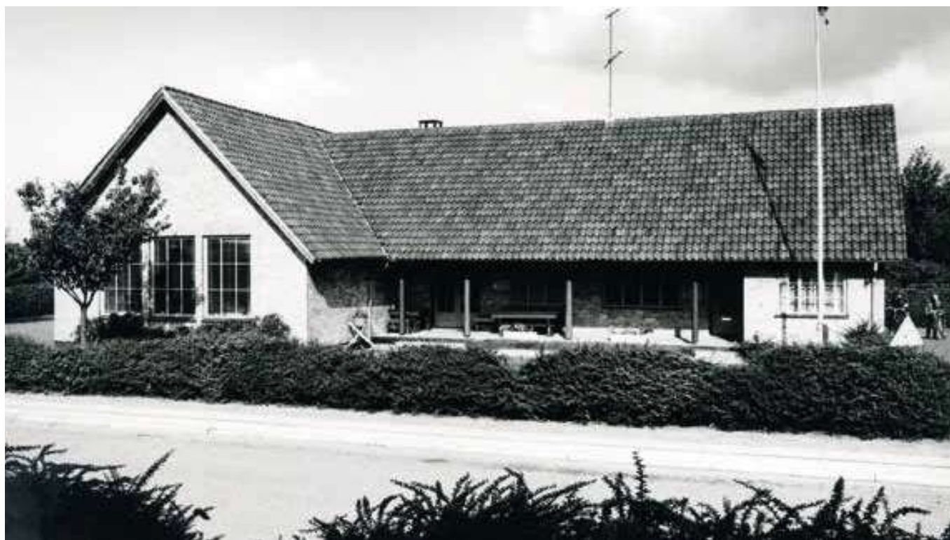
Vandrehjemmet på Pramstedvej fungerede også som mødested for byens ungdom, ca. 1958.

afstand, og mange af arrangementerne fra førkrigstiden var efterhånden blevet genoptaget. Blomsterfesten blev i 1949 holdt i september som en efterårsfest, og man deltog med en mindre Udstilling om vore Fiskefarvande på Den nordiske Lystfiskerudstilling i København. Foreningens aftenture kunne som før krigen gå til Henne eller Fahl Kro og Tipperne, mens de længere weekendture havde mål som Hovborg og Baldersbæk, Skallingen eller Fiilsø og Henne. DSBs første udflugtstog efter krigen kom den 6. september 1952. Foreningen forsøgte sig også med længere ture til Hamborg, og i 1955 satte man sig i forbindelse med Nordisk Rejsetjeneste i Flensborg for at arran-