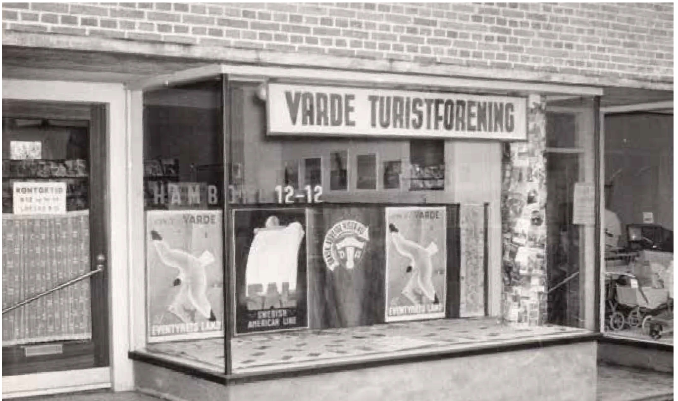
Turistbureauet flyttede til Skansen 4 hen i 1950'erne.

en sådan til bureauerne ved kysten, da det ville blive strafbart at udleje sommerhuse uden autorisation, hvis man ikke var stats-exam. ejendomsmægler eller sagfører .