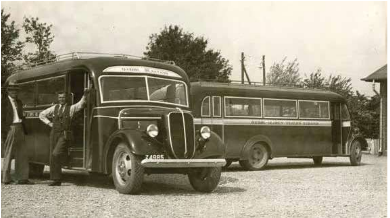
Rutebilerne "Oxbøl-Blaavand" og "Oxbøl-Vejers Strand" ved Oksbøl Station, da trafikken igen var blevet normaliseret, ca. 1950.

på, hvilke muligheder byen kunne give dem med dansant, biografer og aftenture . I sommeren 1955 var bestyrelsen godt tilfreds med, at Campingpladsen i Lunden tiltalte campisterne, efter at den var blevet istandsat, men det forhindrede ikke, at man besøgte Nordentofts Eng ved Varde Å med henblik på en Lejrplads dér. Også campingpladserne eller lejrpladserne, som de fleste stadig kaldte dem, i Vejers og Blåvand interesserede man sig for og holdt møde om forholdene med klitinspektøren. Endeligt havde Varde igen fået et vandrerhjem som før krigen. Det havde turistforeningen arbejdet for siden 1946 sammen med byens Ungdomsudvalg. 20