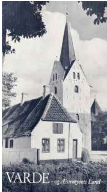
Varde - og Æventyrets Land/ Æventyrets Land - Vestkysten ved Varde. 1956.