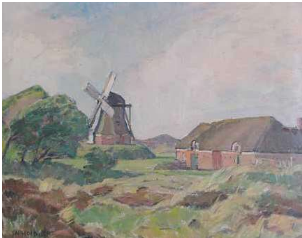
Oksby Mølle mens den stadig var i funktion. N. Holbak: "Møllen i Nørre Oksby", ca. 1930. Museet for Varde By og Omegn.

200 kr., hvis grundejerforeningen ville give det samme. Ved fællesmøderne diskuterede man også vejforholdene, nedkørslerne til stranden ved Vejers og Blåvand, færdsel på stranden og en ny vej syd for Turisthotellet.