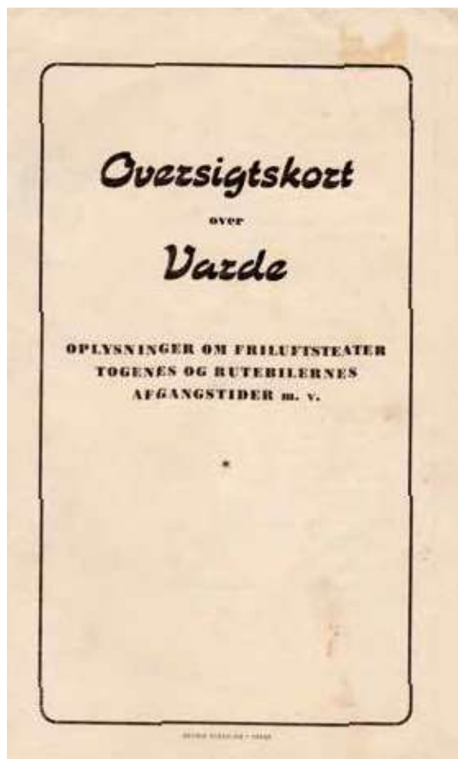
Oversigtskort over Varde. 1947.

forsøgte man sig med en Akkvisettrice til at skaffe nye Medlemmer og aflønnede hende med 40 % af disse medlemmers kontingent. 11