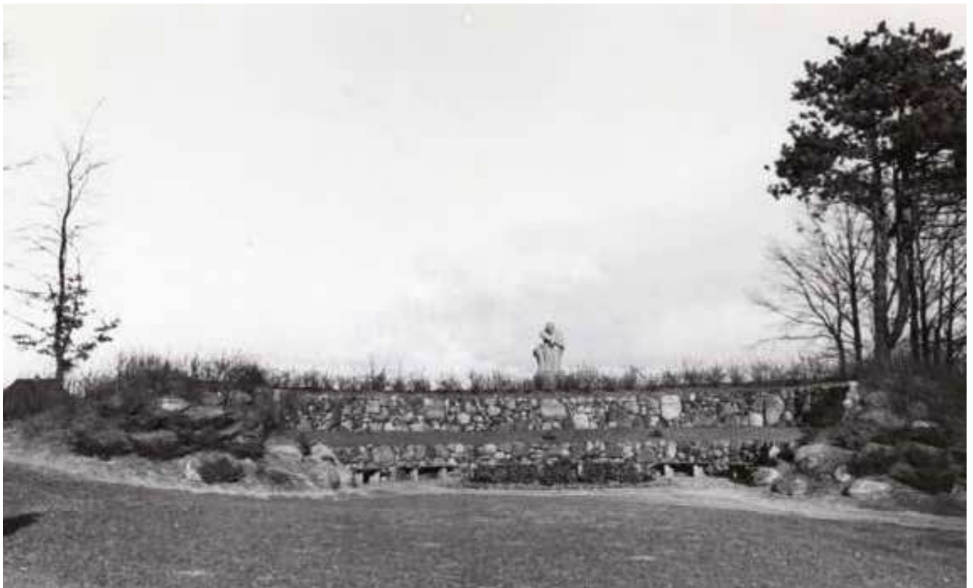
Mindelunden for de faldne frihedskæmpere i Arnbjerg blev afsløret den 5. maj 1948. Centralt i anlægget ses Anker Hoffmanns skulptur fra 1946, ca. 1955.

En anden konkurrenceform blev anvendt i samarbejde med turistforeningerne fra Ribe, Esbjerg og Ringkøbing, hvor man bortloddede weekendophold blandt foreningernes medlemmer, og i foråret 1947