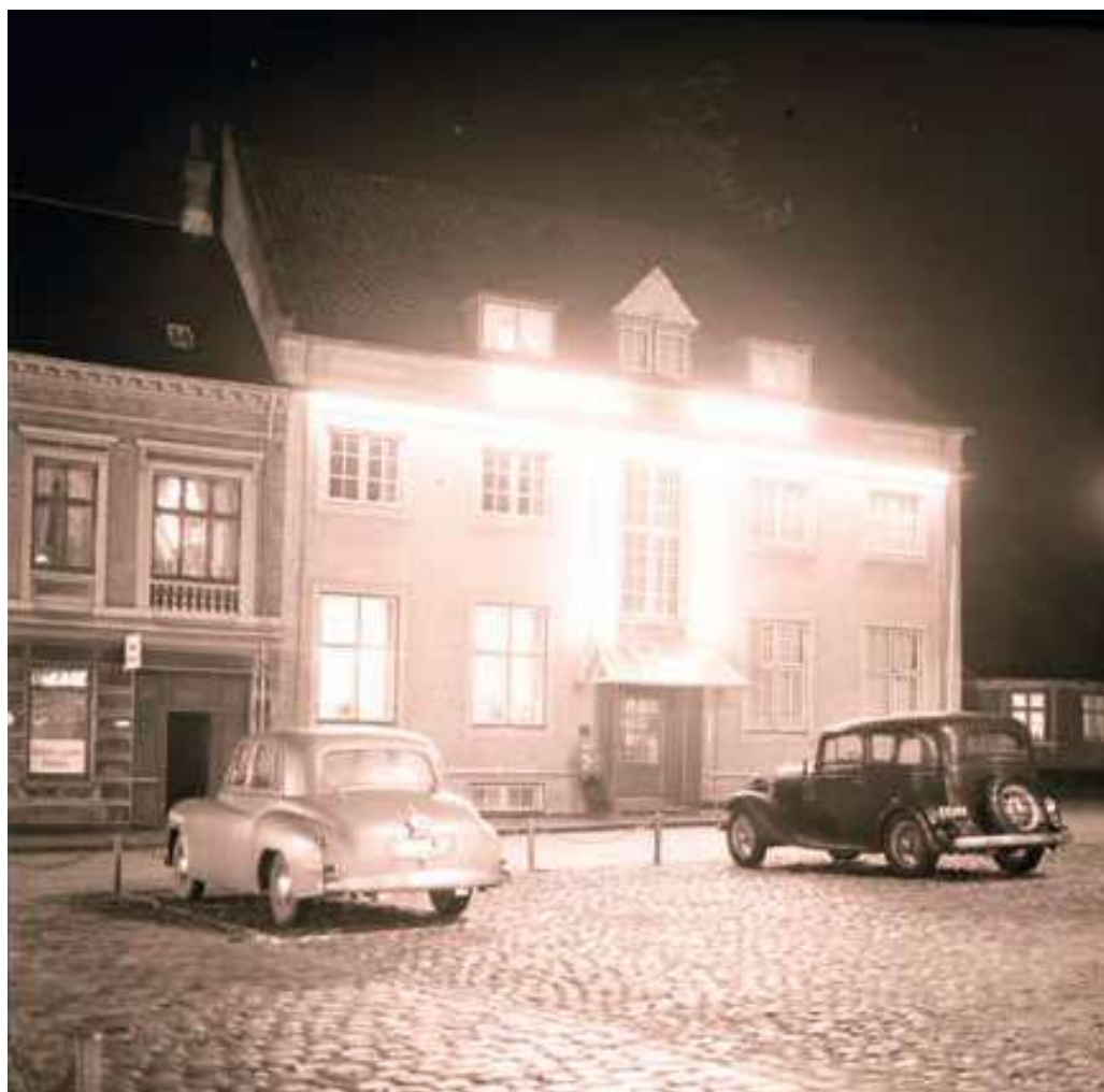
Hotel Varde på Torvet blev fotograferet den 29. maj 1945 og var tilsyneladende kommet godt gennem besættelsen.

paa eget Ansvar. Foreningen opfordrede politimesteren til at lade stranden rense for pigtråd og Fyrvæsenet til at faa Vejen om Blaavand Fyr bibeholdt , mens man forsøgte at få åbnet den spærrede vej gennem Bordrup Plantage. Fyrvæsenet var positivt stemt og tilbød kommunen at betale en procentdel af vejens vedligeholdelse, men der blev ved med at være problemer, og så sent som i 1956 drøftedes Fyrvejen og strandkørsel på et udvidet bestyrelsesmøde, hvor bureauerne ved stranden også var repræsenteret. 9