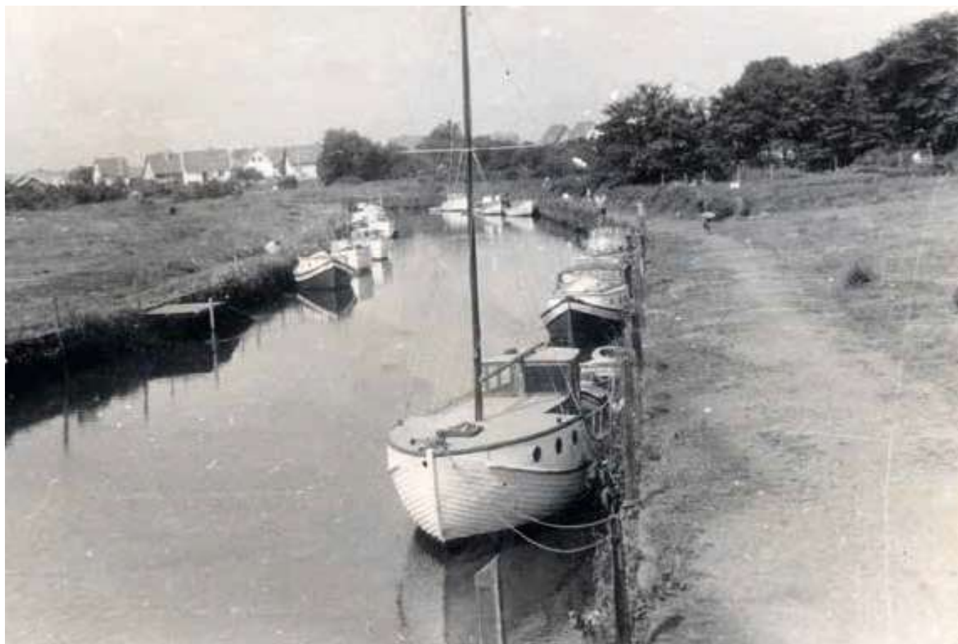
Forholdene ved Varde Å og spadserestien langs den havde turistforeningens vedvarende interesse, ca. 1950.

brændte Rollinger tumlede om paa Stranden og Eros var ene om at manøvrere med Skydevaaben i Klitternes Gryder.