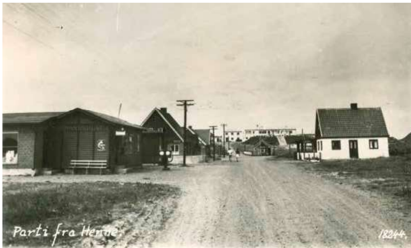
Købmand Jørgensens butik "Købmandshuset" ses til venstre, 1950'erne. Her havde Varde Turistforening deres lokale turistbureau i Henne Strand fra juli 1948.