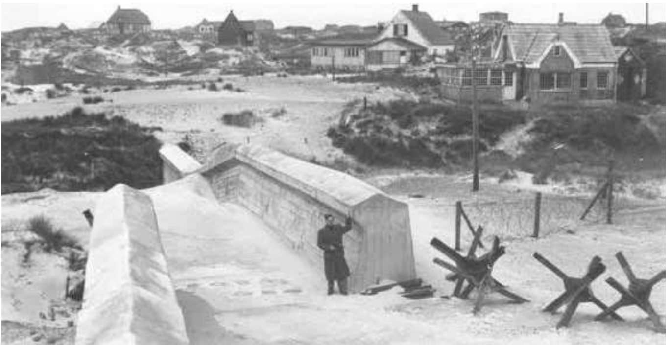
Tysk vejspærring fra besættelsens sidste år ved nedkørslen til stranden i Vejers. Museet for Varde By og Omegn.

Der var en fjern og lykkelig Tid, hvor Vestkysten var Legeplads for gamle og unge, hvor sol-