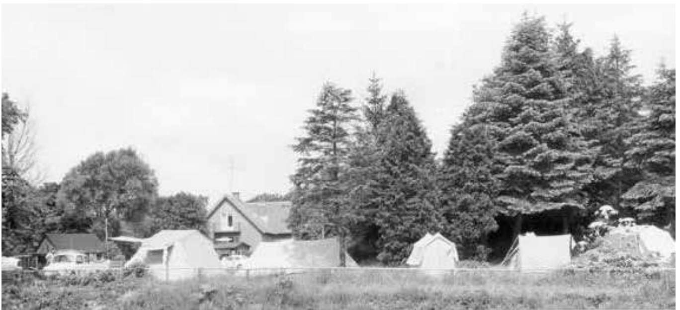
Lejrpladsen på Nordentofts Eng ved Varde Å blev realiseret, ca. 1965.

Turistforeningen og dens bestyrelse var blevet moderniseret. Krigen var kommet på