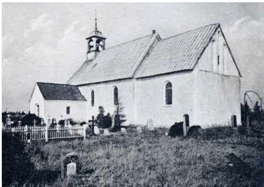
Kalvslund Kirke. Kalvslund Sognearkiv.

gang. Vi havde fået et kort, hvorpå der stod, hvem vi skulle følges med. Vi blev nu opstillet i en lang række ude i gården. Først stod alle vi unge med brudeparrets søskende i spidsen, derefter kom brudeparret og bagest i rækken stod de gamle.