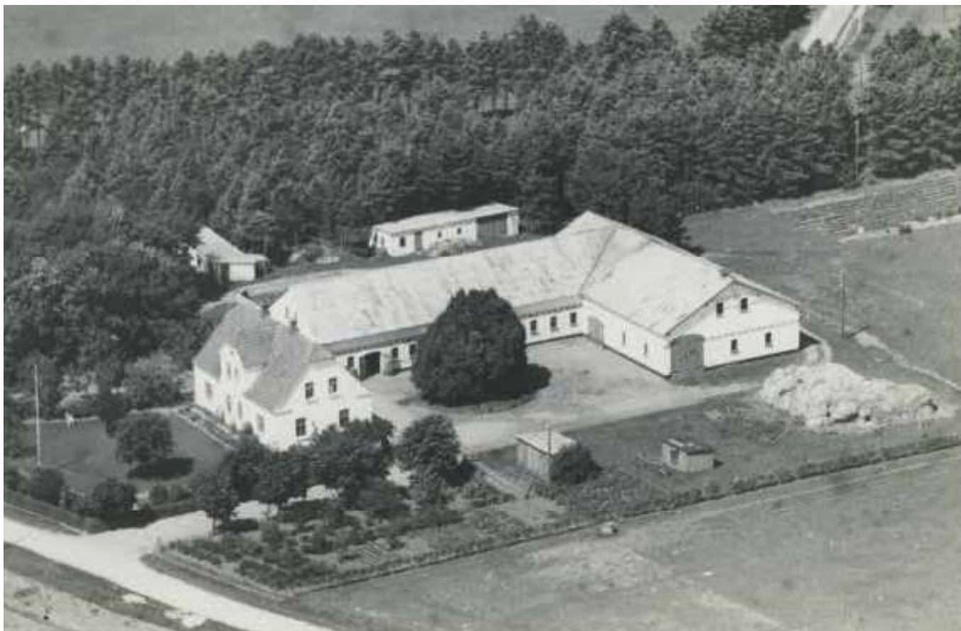
Højvang, 1948.

En lang periode var han sognerådsformand og tillige medlem af menighedsrådet, hvor han også var formand i en del år.