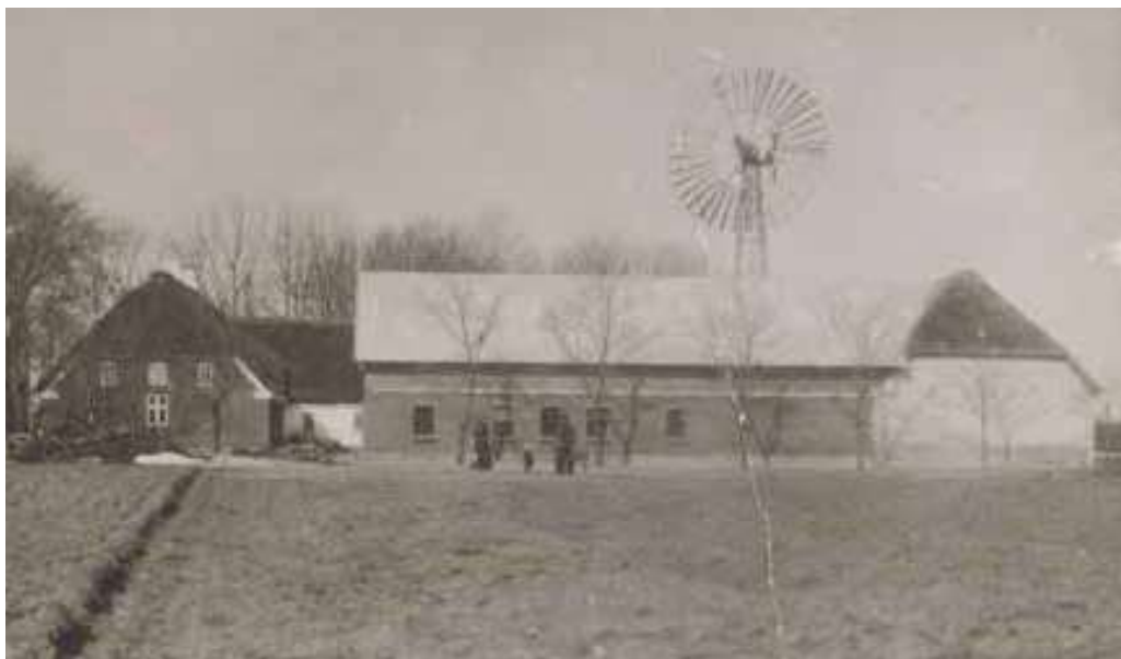
Skaftegård, 1913. Brudens hjem, hvor brylluppet blev holdt.

stærkere, end det gjorde i Jylland, for her var det et hurtigtog, jeg var kommet med. Jeg sad ved vinduet og var meget nysgerrig, for at se hvordan Fyn så ud, for det var første gang jeg var der, men hvad man ser fra et kupevindue bliver ikke til ret meget, og ret længe varede det ikke, før toget holdt i Nyborg. Jeg skyndte mig ud af toget og kom ud på gaden, for at se, om jeg kunne finde ned til færgen. Da jeg kom et stykke hen på gaden, spurgte jeg en mand om vej, men han sagde, at jeg kunde køre med toget derved. I en fart kom jeg tilbage til banegården og nåede lige at komme i toget, inden det satte sig i gang. På færgen til Korsør traf jeg en, som skulle på samme skole, og vi fulgtes så ad det sidste stykke vej. Vi kom til Kalundborg kl. 6 om aftenen, læreren var ude at tage imod os, for vi kendte jo ikke selv vejen.