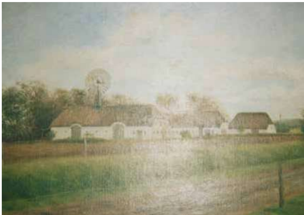
Brunsgård, ca. 1910.

morgenstunden; vi kunde gå ind i stuen at få kaffe, når vi vilde, og af og til kom der også en ud i teltet med en ballepunch, og stemningen var ved at blive helt god, så at der blev drukket skåler for både den ene og den anden.