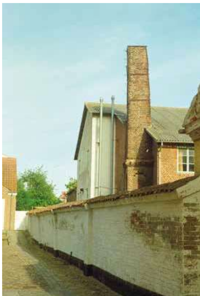
Fabriksskorstenen i Slotsgade umiddelbart før nedrivningen.

stand til at betale beløbet eller nogen dele deraf.