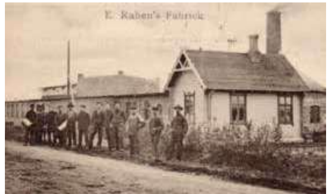
Rabens Fabrik, Ribevej 82, Egebæk. Udsnit af postkort. Tilhører Karl Andresen, Ribe.

I Løgumkloster var Raben medlem af et lille dynasti af cikoriefabrikanter, som endvidere drev en cikoriefabrik, Ribevej 82 i Egebæk, Hviding Sogn. 33 Der vides grumme lidt om denne fabrik i Egebæk. 34 Tilsyneladende blev produktionen efter 1908 omlagt til tømmerhandel og savskæreri, så man kan formode, at samarbejdet med Kolvig bevirkede, at fabrikationen i Egebæk