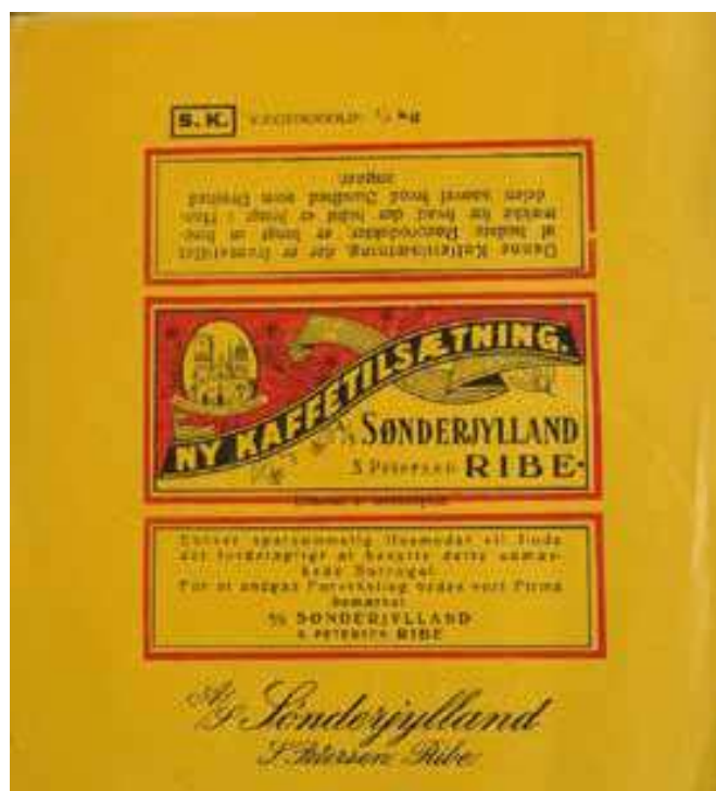
Tut-papir fra cikoriefabrikken "Sønderjylland". Privateje.

rum for at trække lidt fugt for at øge vægten inden detailsalget.