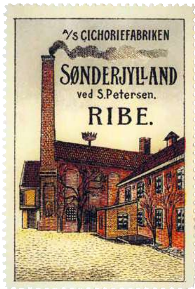
Samlemærke fra cikoriefabrikken Søndersjælland. Privateje.