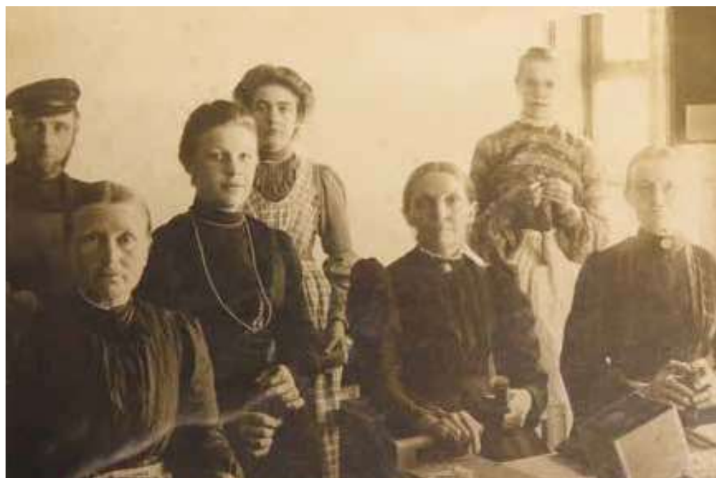
Ansatte på cikoriefabrikken i Slotsgade ca. 1900. Kvinderne er ved at "tutte", d.v.s. pakke kaffetilsætningen.

bejdning. Man har sandsynligvis kunnet udnytte varmen fra maltingen til tørring af cikorierødderne.