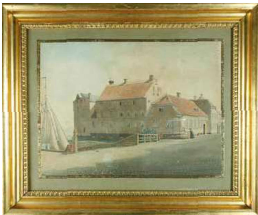
Cikoriefabrikken på Mellemdammen. Akvarel 1878. Julius Th. Tuxen. Sydvestjyske Museer.

først blev opdaget og bragt i menneskets tjeneste, da munke i det sydlige Ætiopien i 800-tallet blev opmærksomme på, at geder, der havde spist af kaffebuskens frugter, blev mere livlige. Munkene lavede derpå udtræk af disse frugter, kaffebønner, og drak det for at holde sig vågne under de lange nattegudstjenester, der er pålagt klostrenes beboere. Herfra skal brugen af kaffe have udviklet sig. Dette er naturligvis en legende, men den vidner om, hvor gammel nydelsen