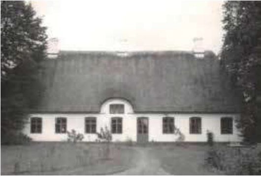
Præstegården i Præstkjær var embedsbolig for sognets præst ind til 1927, hvor der blev bygget ny præstebolig i Brørup. Gården findes stadigvæk, og billedet er fra en senere tid, end da Feilberg flyttede ind i den forsømte præstegård.

gang lå i Præstkjær midtvejs mellem Brørup og Holsted. Der hørte et stort areal til gården, men landbruget var i en meget dårlig forfatning. Forgængereren Peter Heinsen havde ikke bare forsømt præstegærdningen, han havde også misholdt præstegården. Meget af gårdens jord lå forsømt og udyrket hen.