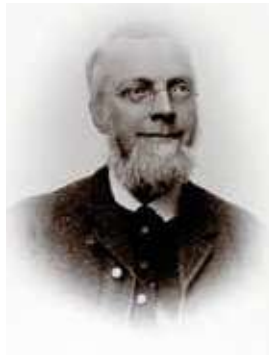
H.F. Feilberg fotograferet af Karl Kristensen, Askov.

Den efterfølgende strid om præstevalget blev nok på grund af denne overrumpling yderligere hård.