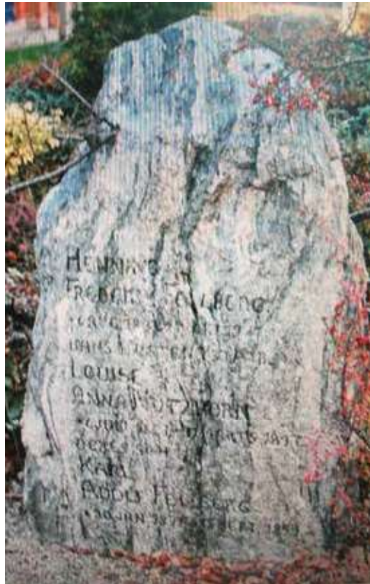
H.F. Feilbergs gravsten på Askov Kirkegård.

brødre havde deltaget i krigen, og han havde som præst i Store Vi på nært hold været vidne til det frygtelige tilbageslag for de danske soldater fra Dannevirke. Dog siger han et sted mange år senere noget om det smertelige i tabet af de sønderjyske landsdele: ... at Nederlaget dog vist paa mange Maader har bragt stærke aandelige Rørelser ind i vort Folk, – det gælder da om at forstaa hinanden tilbunds. Vi er et lille Folk, inden snævre Grænser