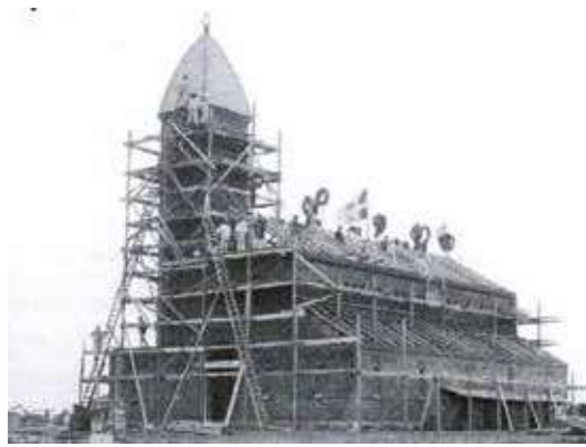
Askov Kirke under opførelse i 1899.