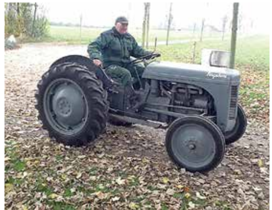
Ferguson-traktoren på billedet er en af de første 10, der kom til Danmark efter Anden Verdenskrig. Foto: Regnar Busk, november 2015.

Færdes man i skoven nu, møder man mange mennesker. De er ikke skovarbejdere, men friluftsmennesker. Når der skal fældes et stykke skov, kommer der noget, som ligner en kæmpe larve på otte hjul. Den går til angreb på de træer, der måske har stået der