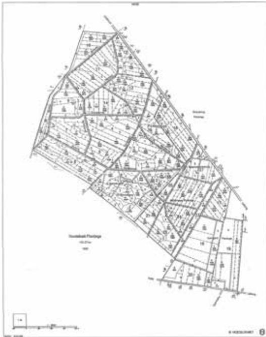
Skovkort over Hundsbæk Plantage, 1992. Hundsbæk Plantages arkiv.