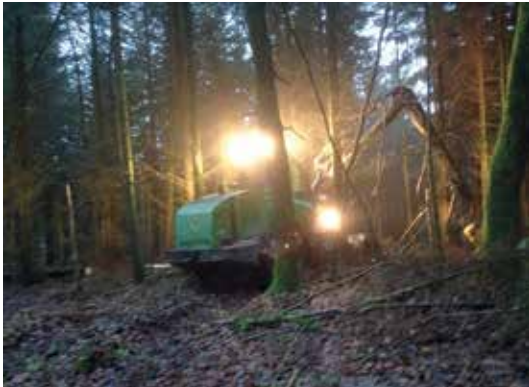
Skovningsmaskine på arbejde i Hundsbæk Plantage. Foto: Regnar Busk, december 2015.