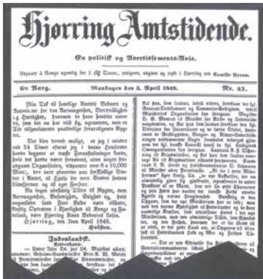
Amtmand Holstens proklamation til amtens beboere af 2. april 1848 blev trykt i lokaliteten dagen efter. Proklamationen blev også udgivet af lokale autoriteters officielle publikum for slaverne i Nordjylland.

Amtmand von Holstens tak til Hjørring Amts beboere for hjælpen mod "fjenden". Hjørring Amtstidende, 3. april 1848.