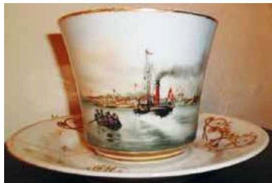
Wyck på Föhr. Porcelænsmaleri på en kop fra 1850'erne. Privateje.