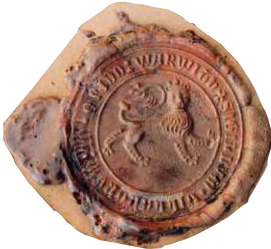
Voksaftryk af Vardes senmiddelalderlige segl. Aftrykket findes i Varde Museums samling.

Lüneburg, i 1202 blev gift med Helene, datter af Kong Valdemar den Store (1157-1182), og dermed søster til Kong Valdemar Sejr (1202-1241). Helene fik Varde by og måske hele eller dele af Varde Syssel som medgift. Så tidligt som i 1202 kom Varde altså under tyske hertugers herredømme. De lüneburgske hertuger førte en løve i deres våben, og det er her fra, Vardes løve skulle stamme.