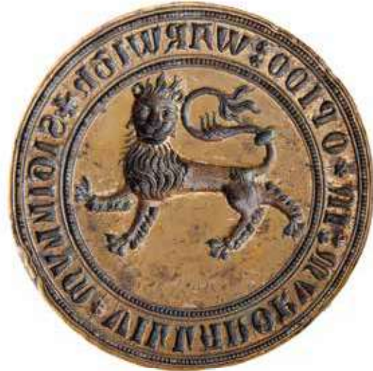
Varde bys senmiddelalderlige segl. Seglets diameter er 7,73 cm. Foto af den originale seglstampe, som findes i Varde Museums samling.

M. Mackeprang definerer en købstad i dens senmiddelalderlige betydning således: “En købstad er en fra det omliggende herred ud-