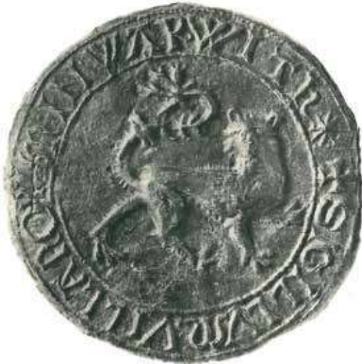
Voksaftryk af Vardes ældste segl i statsarkivet i Lübeck, dateret til 1300-tallet. Selve seglstampen er ikke bevaret. Efter Grandjean 1937, tavle i.

med er der egentlig intet argument for, at Varde skulle have fået en reduceret del af hertugslægtens våben. Ydermere er det væsentligt at holde fast i, at selvom Varde i flere perioder hørte under forskellige grevslægter, så var byen formelt set dansk og tilhørte kongen, som dermed formelt set var grevernes lensherre. Man kan dermed kun vanskeligt forestille sig, at kongen ville tillade, at Varde fik et segl, der indikerede at byen tilhørte hertugdømmet. Hvis der ikke er tale om den sønderjyske hertugslægts løve, hvor kan den da stamme fra? Det må indtil videre stå hen i det uvisse 14 .