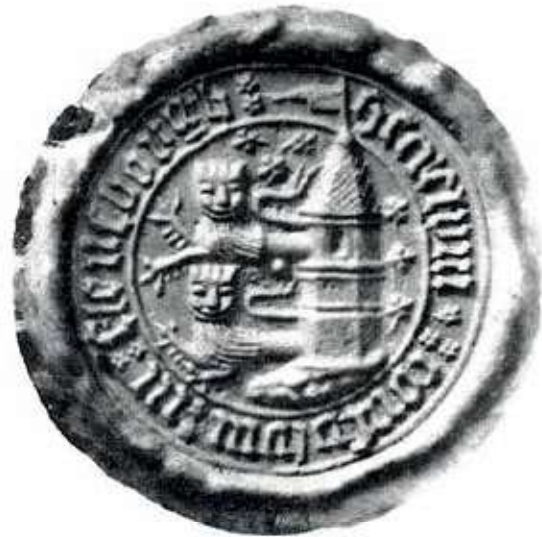
Flensborgs segl med de to løver fra den sønderjyske hertugslægt. Efter Grandjean 1953, tavle 2f.

Her kan man anføre, at fx Husum, Tønning og Flensborg, som ligger i hertugdømmet, førte to løver i deres våben 13 , og der-