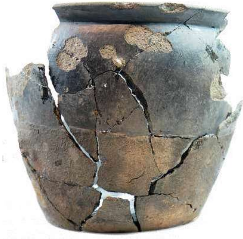
Den bedst bevarede urne fra Måde Industri, urne x3 er et typisk eksempel på en urne fra ældre romersk jernalder.

med jordfæstegrave, men der gik ikke længe, før brandgravskikken blev den altdominerende begravelsesform. Hvorfor denne pludselige ændring i gravskikken fandt sted, vides ikke med sikkerhed, men det kan have noget at gøre med, at man blev mere bevidste om, at hvert individ skulle have en standsmæssig begravelse. I forhold til bronzealderens store pompøse begravelser, hvor kun samfundets elite blev begravet med udstyr til både festmåltider og krig, var ældre jernalders brandgrave som regel mere anonyme. Det er langt fra altid, at