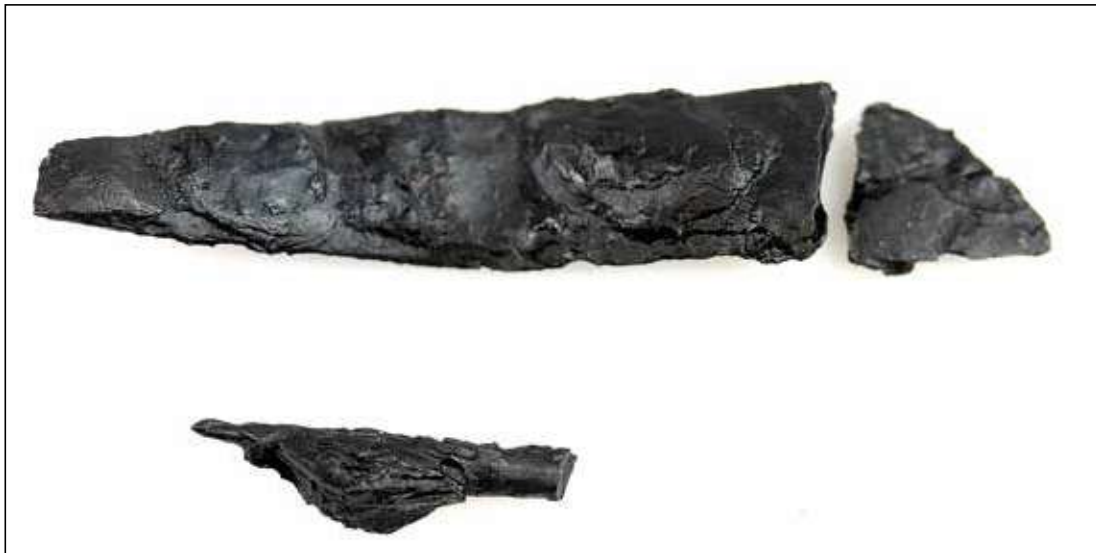
Øverst ses den lille kniv med afknækket spids, og nederst ses spidsen af en dragtnål, der er fundet i urne x4.

pincetten, skære dødt væv væk og lukke såret – først med pincetten og senere med nål og tråd eller med slæntorne. 4