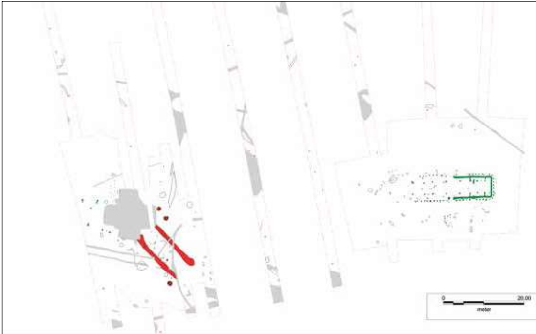
Oversigtsplan over udgravningen ved Måde Industri. Til højre ses det førromerske hus, markeret med grønt. Grøftanlægget er markeret med rødt, og urnerne til venstre herfor er igen markeret med grønt. Grafik: Sydvestjyske Museer.

som senere viste sig at være to parallelle grøfter af en helt anden karakter.