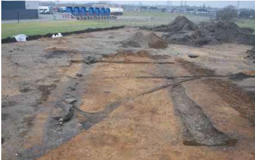
Kultanlægget set fra syd. Den store, grå plamage mod nord er en Anden Verdenskrig bunker, og de mange grå linjer, der går ind over grøfterne, er ledninger, der har gået fra bunkeren og ud til kanonstillingerne.

urner, og man mener, at de kan have indeholdt mad og derved have fungeret som en form for proviant til efterlivet. Bikarrene er så dårligt bevarede, at det oprindelige indhold ikke kan bestemmes. Gravgaverne kan ikke fortælle, om der er tale om en mand eller en kvinde, og gravgaverne fra urne x4 udgør således en helt typisk, anonym urnegrav fra tidlig romersk jernalder.