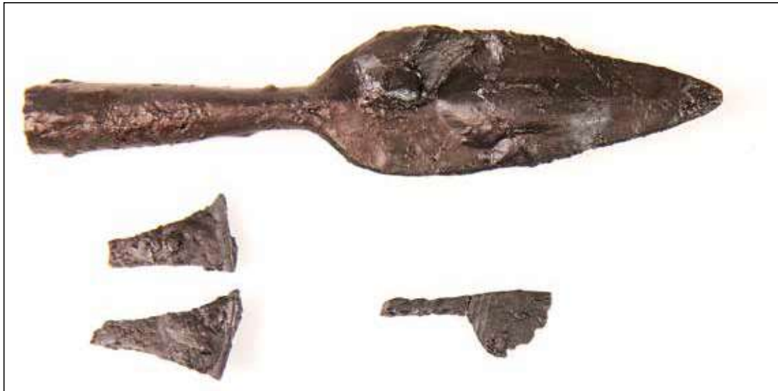
Metalgenstandene fundet i urne x8. Øverst ses spydspidsen, nederst til venstre pincetten, som er brækket i to dele, og nederst til højre ses det lille knivfragment.

og klinge ses tre smalle furer, som har prydet knivens overflade. Knivens bevarede del er kun 3 cm, men det antages, at den oprindeligt har været ca. 5,5 cm. En næsten helt lignende kniv er fundet i en urnegrav fra romersk jernalder ved Bække Mark. 2 Imellem de brændte knogler blev der også fundet en pincet. Pincetten, som fandtes i to dele, er brækket i bøjlen, men den har sandsynligvis ikke været meget længere end den bevarede længde på 4 cm.