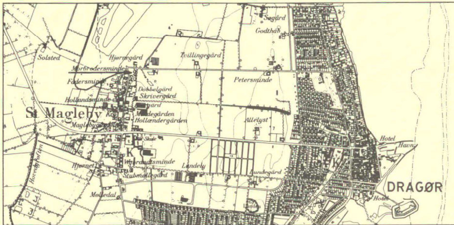
På målebordsbladet her fra 1968 ses den i 1970 eksproprierede og nedrevne gård "Morbroders Minde" som en af de nordligste i Store Magleby

pladser, så kapløbet om at komme først om morgenen (natten) kunne ophøre.