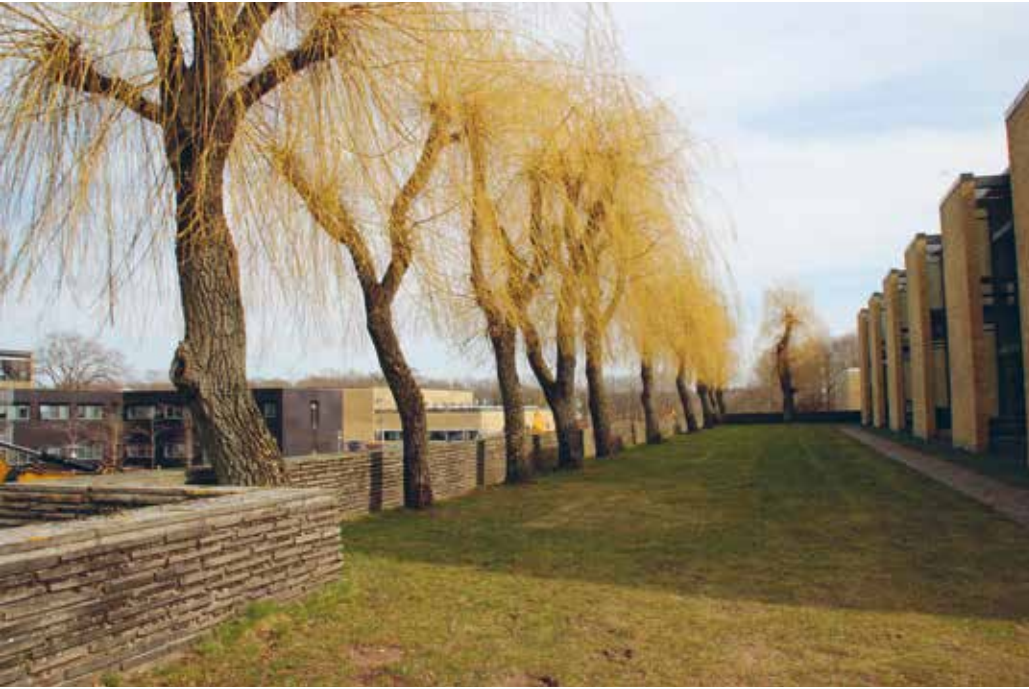
DTU's landskab (1959-74), tegnet af Edith og Ole Nørgård sm Eva og Nils Koppel

beslutningerne oplyses det derfor af henholdsvis Kulturstyrelsen og Slots- og Kulturstyrelsen, at de finder, at anlæggene har de fremragende arkitektoniske, og kulturhistoriske værdier, der kan begrunde en fredning af et værk, som er yngre end 50 år.