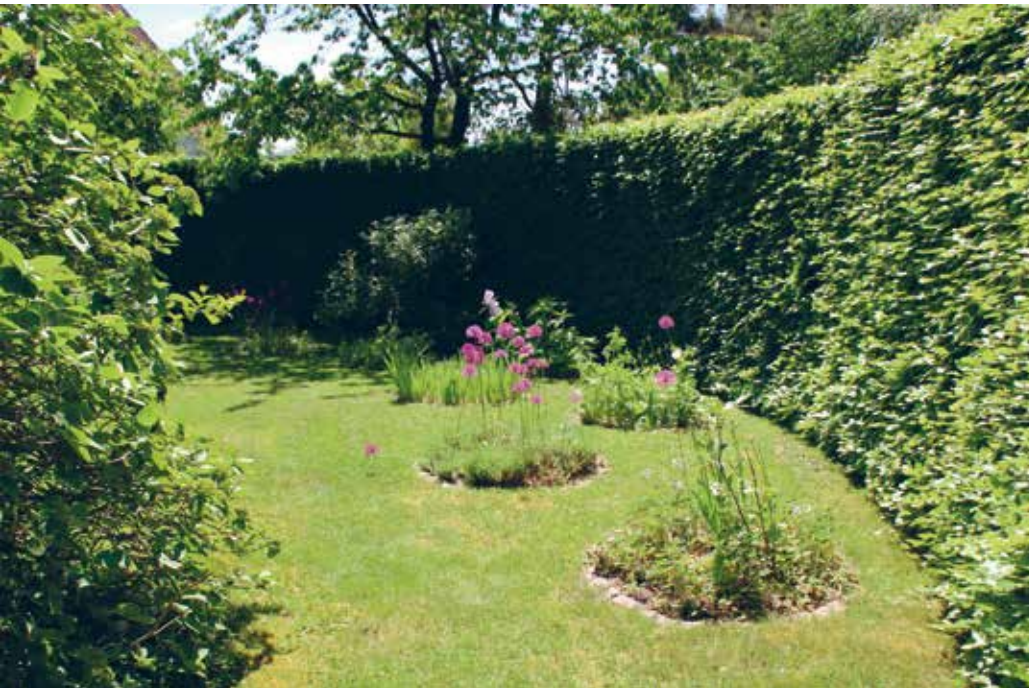
Sonja Polls have, Holte.