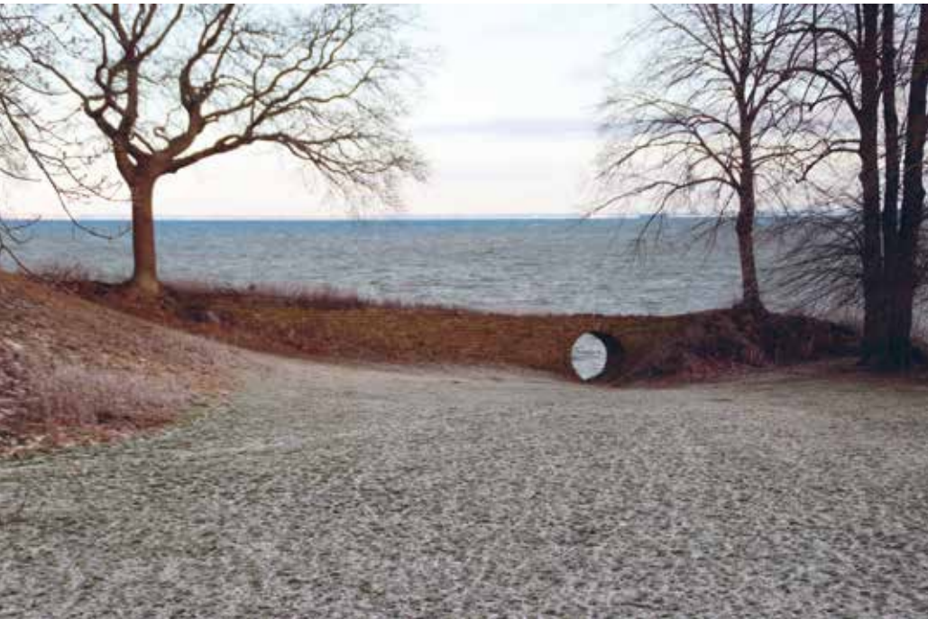
Måneporten (1934) i Springforbi, Lyngby-Taarbæk Kommune, tegnet af C. Th. Sørensen.

Fredningen omfatter det stensatte dige med måneport og den græsklædte slette mod land. Anlægget, der er opført i 1934, er tegnet af landskabsarkitekt C. Th. Sørensen i forbindelse med opførelsen af den nordfor beliggende villa. Måneporten er inspireret af traditionel kinesisk arkitektur.