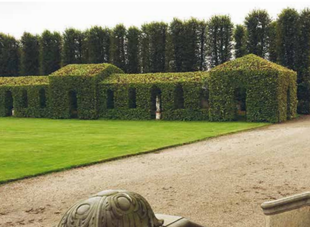
Lindebuehækken på Lerchenborg.