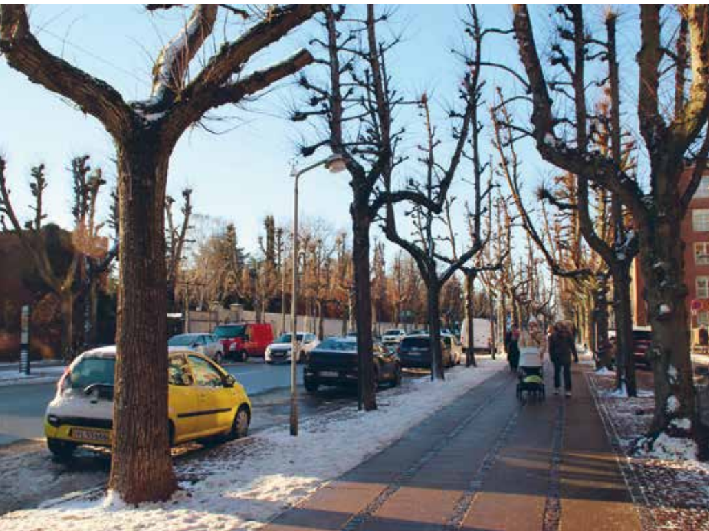
Frederiksberg Allé (1704).

Frederiksberg Allé, Frederiksberg. Fredet i 2018* Frederiksberg Allé ligger centralt i bydelen og fører fra Vesterbrogade i øst til Frederiksberg Have i vest. Fredningen omfatter ud over alléen også Skt. Thomas Plads og Frederiksberg Runddel. Alléen er anlagt i 1704 som en kongelig forbindelsesvej imellem København og det netop opførte Frederiksberg Slot og Have.