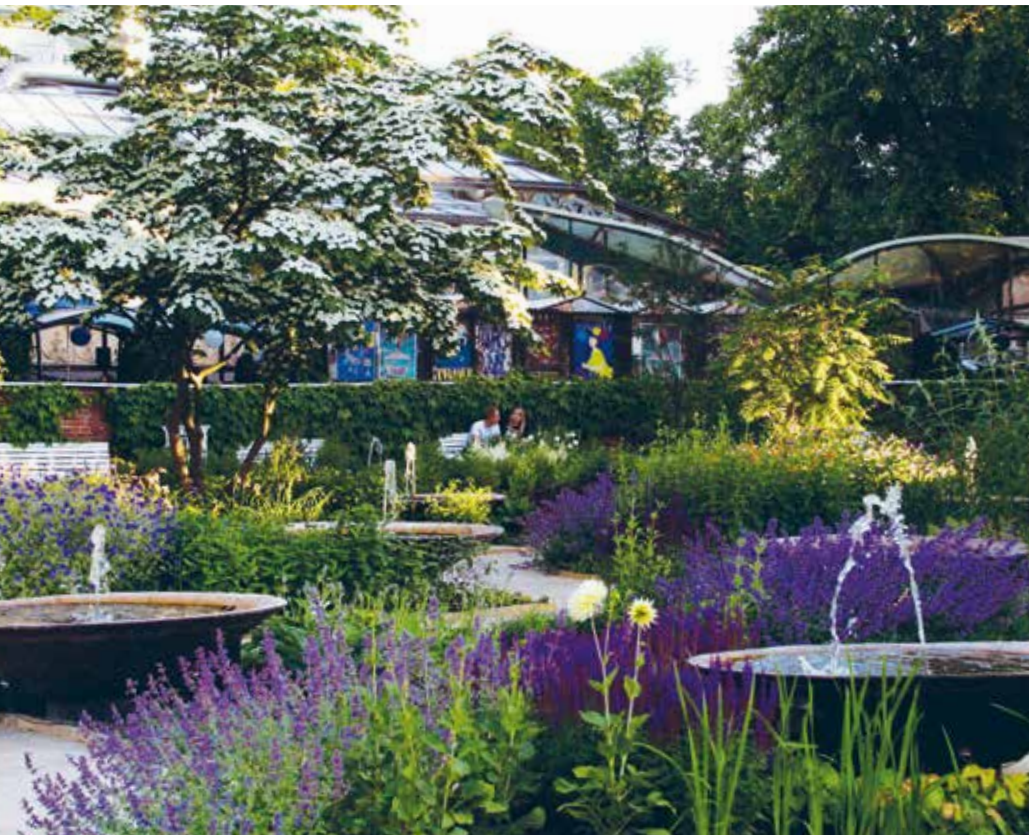
Parterrehaverne (1945) i Tivoli, København, udformet af G.N. Brandt og Poul Henningsen.

Parterrehaverne/Springvandsterrasserne i Tivoli, København. Fredet i 2014* Anlægget ligger som en fredelig oase i det ellers larvende Tivoli, imellem Tivolisøen og den lidt højere liggende sti (Strandvejen) som løber omkring søen. Mod stien afsluttes anlægget af en lav, blødt svunget mur i gule klinker. I læ bag muren står bænke. Det lavtliggende anlæg er karakteriseret af 32 trækar, som fordeler