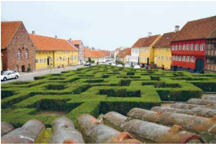
Vor Frue Kirkes Plads (1953) i Kalundborg, tegnet af C. Th. Sørensen og Ole Nørgård.

Siden 1980 har fredningsmyndigheden (aktuelt Slots- og Kulturstyrelsen) med stadig øget fokus, vurderet om omgivelserne skulle medtages i bygningsfredninger. Iflg. forannævnte 'Rapport fra arbejdsgruppe om Fredning af selvstændige landskabsarkitektoniske værker' var der i 2013 fredet ca. 50 haver, ca. 190 gårdspladser, gårdrum eller belægninger, ca. 20 parker, offentlige anlæg mv. og ca. 15 fredninger af træer/hække, som ligger i tilknytning til en fredet bygning. Siden denne optælling er flere landskabsarkitektoniske anlæg fredet, herunder de ovenfor nævnte selvstændige landskabsarkitektoniske værker.