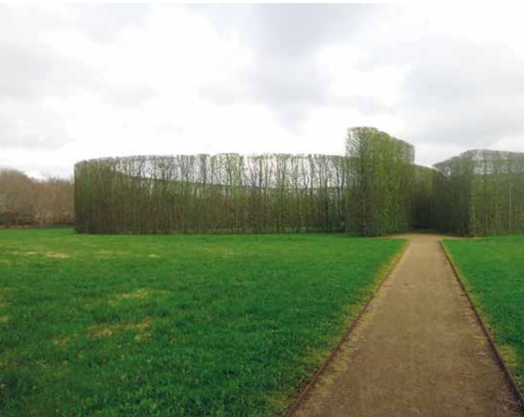
De Geometriske Haver (1983) i Birk, Herning Kommune, tegnet af C. Th. Sørensen.