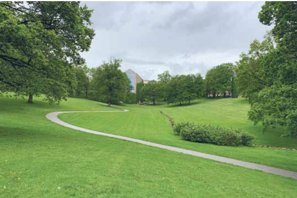
Aarhus Universitetspark (1933-), tegnet af C. Th. Sørensen.

bygninger og det landskabelige greb fremstår som en helhed eller et samlet værk.”