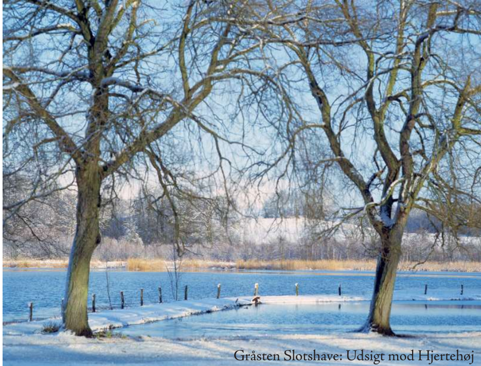
Gråsten Slotshave: Udsigt mod Hjertehøj