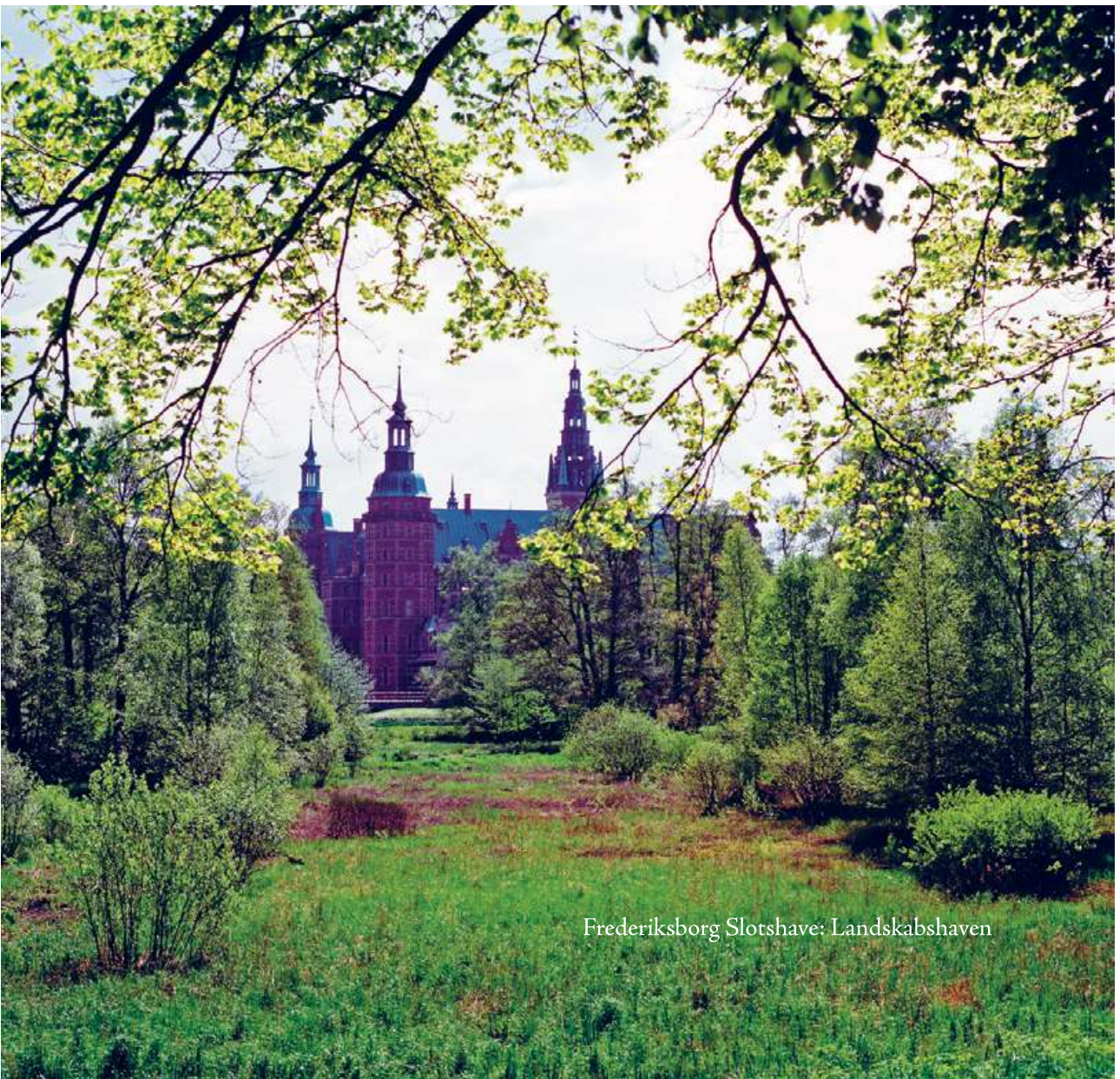
Frederiksborg Slotshave: Landskabshaven