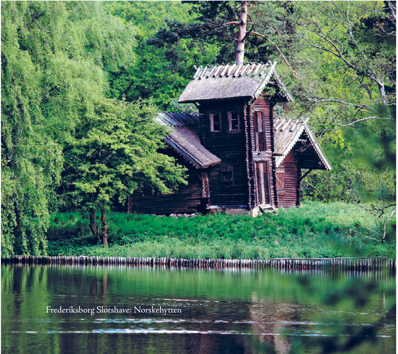
Frederiksborg Slotshave: Norskehytten