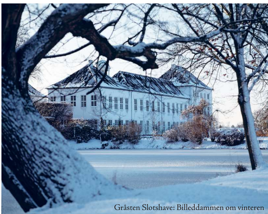
Gråsten Slotshave: Billeddammen om vinteren