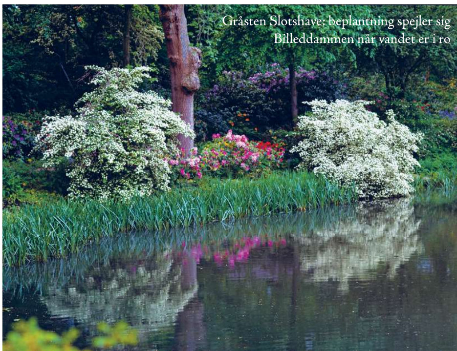
Gråsten Slotshave: beplantning spejler sig Billeddammen når vandet er i ro