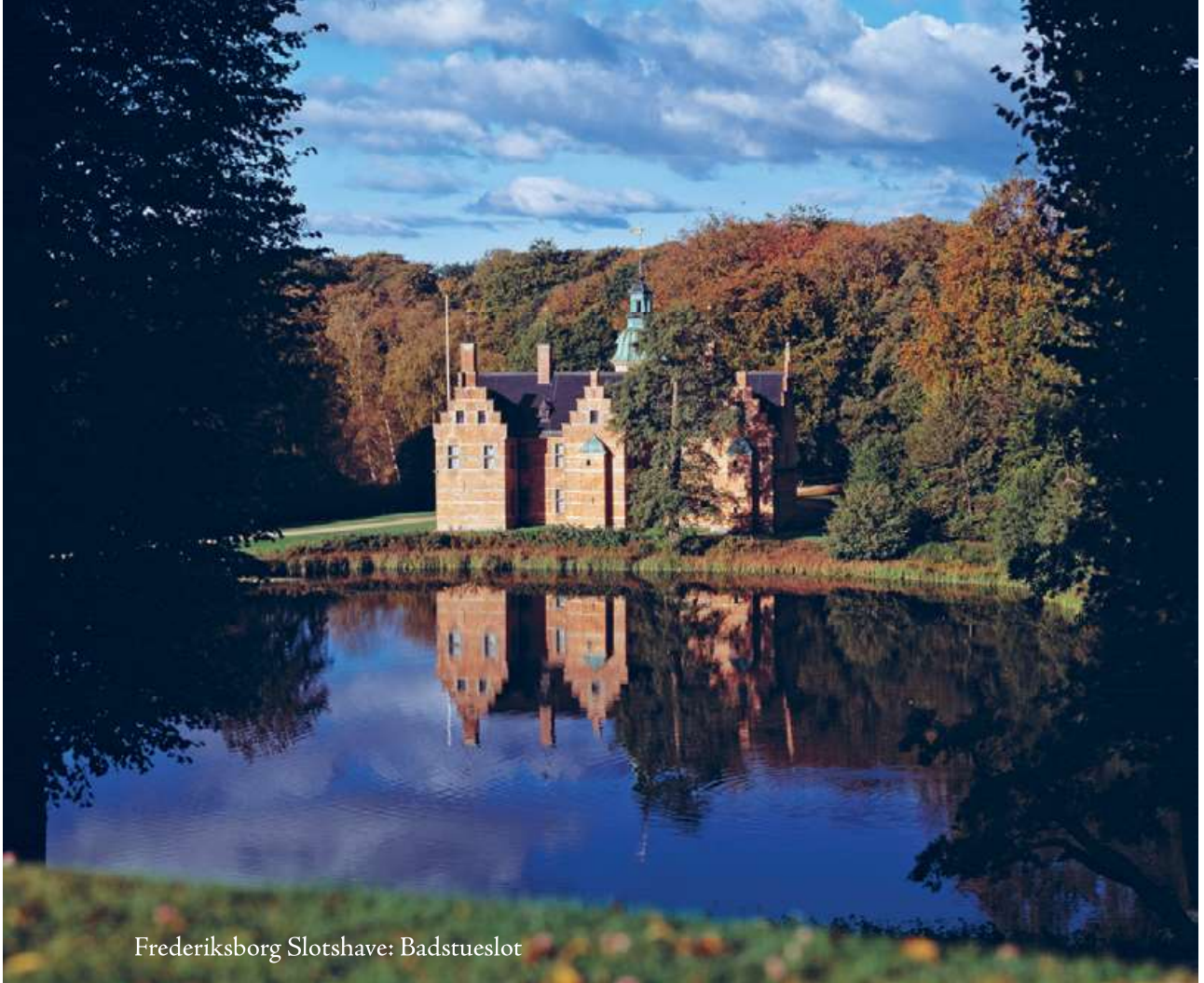
Frederiksborg Slotshave: Badstueslot