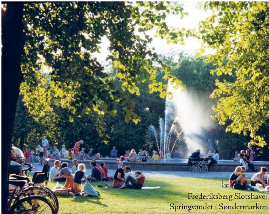
Frederiksberg Slotshave: Springvandet i Søndermarken