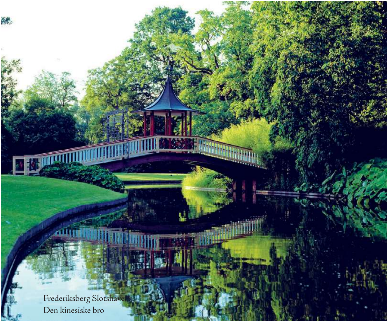
Frederiksberg Slotshave Den kinesiske bro