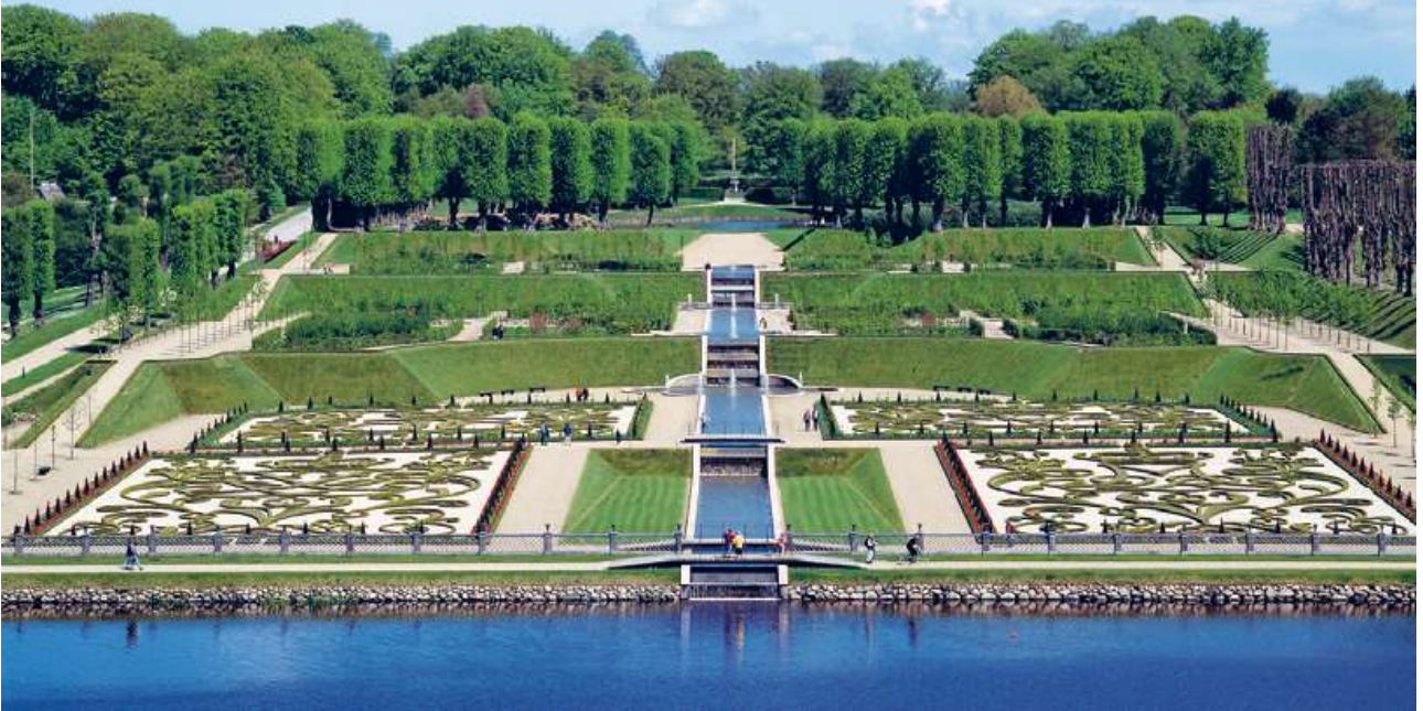
Frederiksborg Slotshave: Den genskabte barokhave