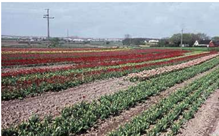
Tulipanmarker på Amager. Ca. 1960. Fotografi, Dragør Lokalkiv.

Roskilde og siden til Lammefjorden. Deres produktion ophørte i Danmark ca. 1995.