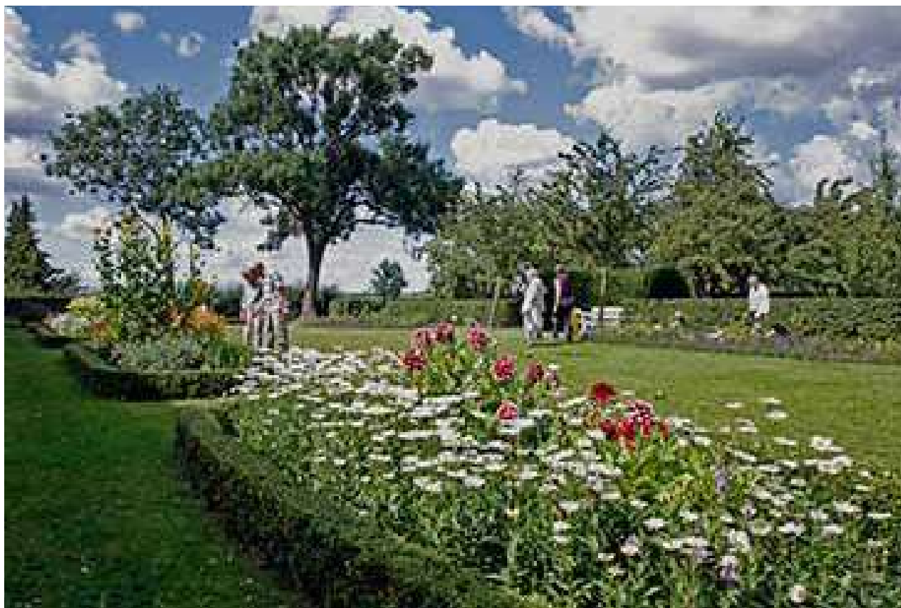
Parti fra staudefave på Nordgård. Museum Amager. Haven passes af en gruppe frivillige tilknyttet museet.

Hvis man i dag vil opleve en gammel Amager-have med historiske urter og planter, kan det lade sig gøre i Nordgårds have på Museum Amager i St. Magleby. Her kan man se georginer, lavendler, roser og