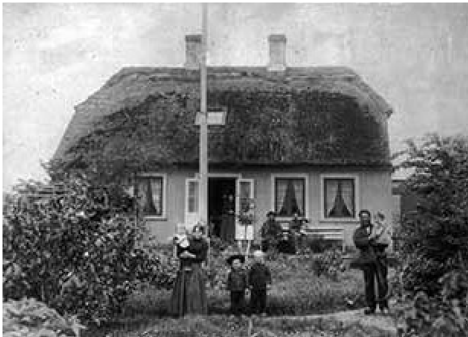
En fiskerfamilie ved deres hus og have på Amager Strandvej ved Skøjtevej. Fotografi. Ca. 1890. Tårnby Stads- og Lokalkiv B 274.

Generelt var haverne på Amager små, og kun de færreste anlæg fra tiden op til år 1900 omfattede prydbuske og blomster. Men billedet ændrede sig lidt efter lidt.