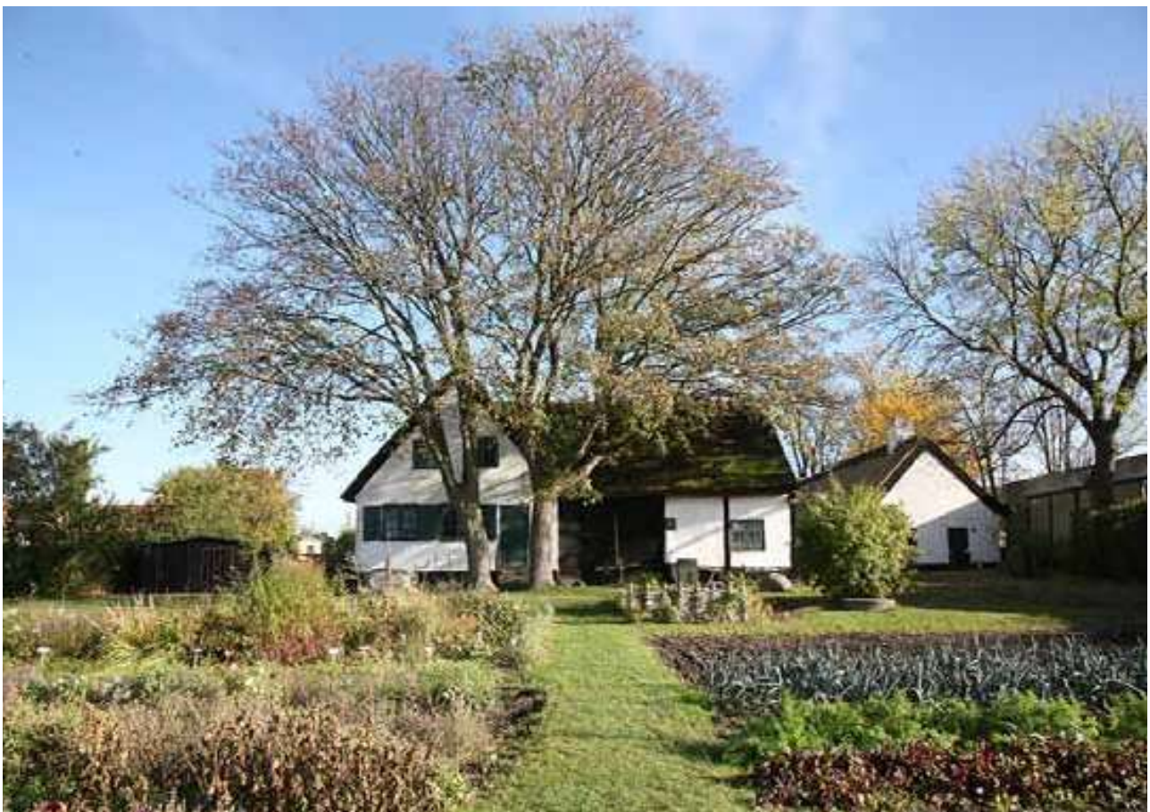
Parti fra Nordgårds have, som den tager sig ud nu. Anlægget hører under Museum Amager.