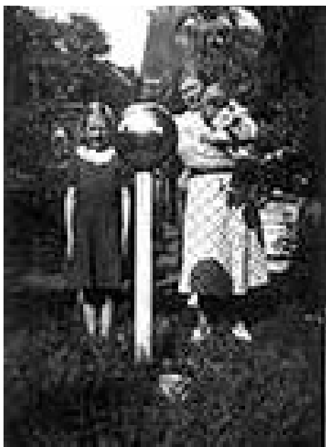
Kviksølvkugle som dekoration i en have i Kastrup. Fotografi. 1947.

I flere prydhaver var der opstillet en eller anden figur, ofte af træ. Årligt malede man disse figurer. I Lykkeshøjs have på Kastrupvej stod f.eks. en gengivelse af to figurer i Roskilde Domkirkes urværk: Kirsten Kimer og Per Døver. Figurerne blev senere givet til Amagermuseet, der har haft dem stående ved den gamle Museumsgård. I haven på Ny Kastrupgård stod en buste af Frederik 7.