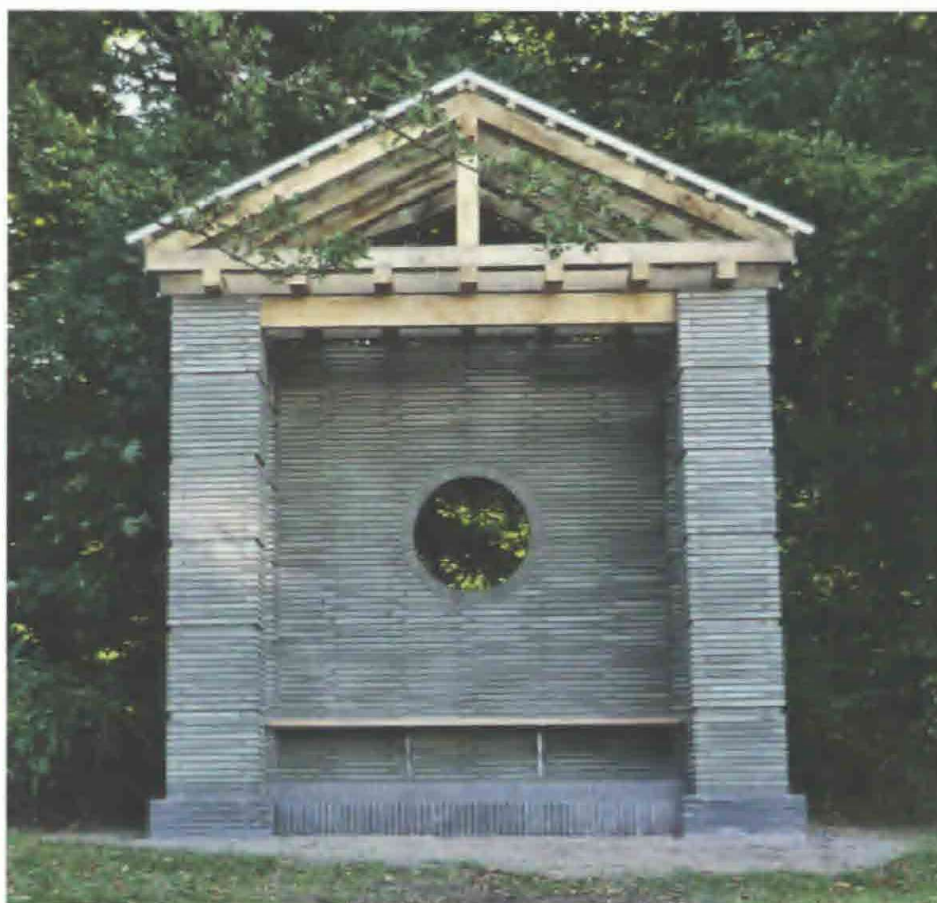
Den nyopførte Kuglehytte i Søndermarken.

med udsmykninger på gesims og bagvæg, på det flade tag en kugle på en opsats. Bygningen ses placeret på en lille høj, omgivet af tæt beplantning med både løv- og nåletræer.