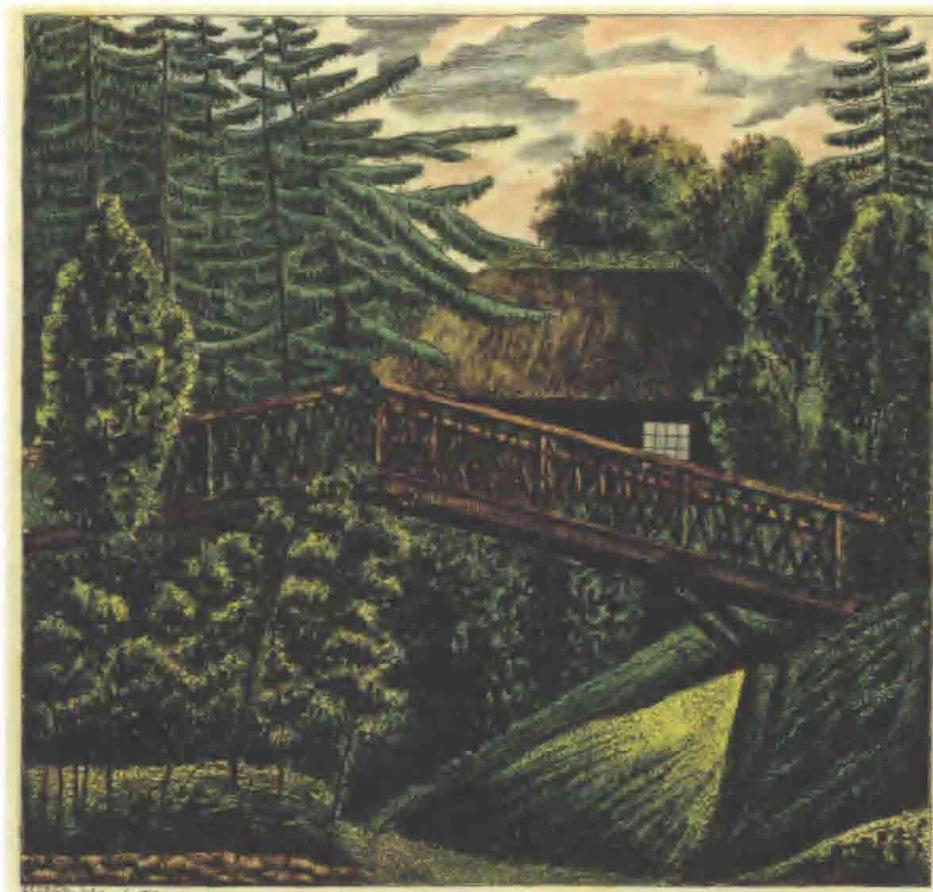
Norske Parti i Søndermarken, gengivet efter Johann Ernst Christian Walters Prospekter af Søndermarken eller Kiöbenhavn og Omegn, 1826.

Norske Bro forfaldt og er genbygget flere gange med lidt forskellige udformninger. Dette ses på de mange tegninger, malerier og fotografier, der er taget på stedet og publiceret som eksempelvis postkort. 5 I perioder har broens sider været lavet af forhåndenværende grene fra havens træer, og dermed haft et meget rustikt præg, mens broen i andre perioder har været mere regulær og gjort af tømmer i større dimensioner. Det lader til, at broen oprindeligt har været stejl, med et spidst toppunkt, og at denne udformning forblev den samme gennem tiden. Det har utvivlsomt været lidt af et sus at komme op på broen og se Norske Hus, mens man samtidig kunne se ned på søen. En ekstra effekt bestod i, at de to søer var forbundet ved en fos.