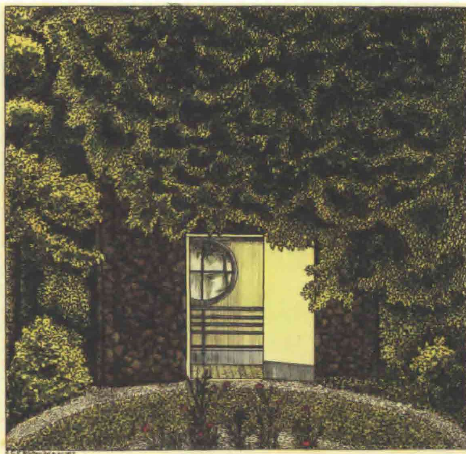
Favnbrændehuset i Søndermarken, gengivet efter Johann Ernst Christian Walters Prospekter af Søndermarken eller Kiöbenhavn og Omegn, 1826.