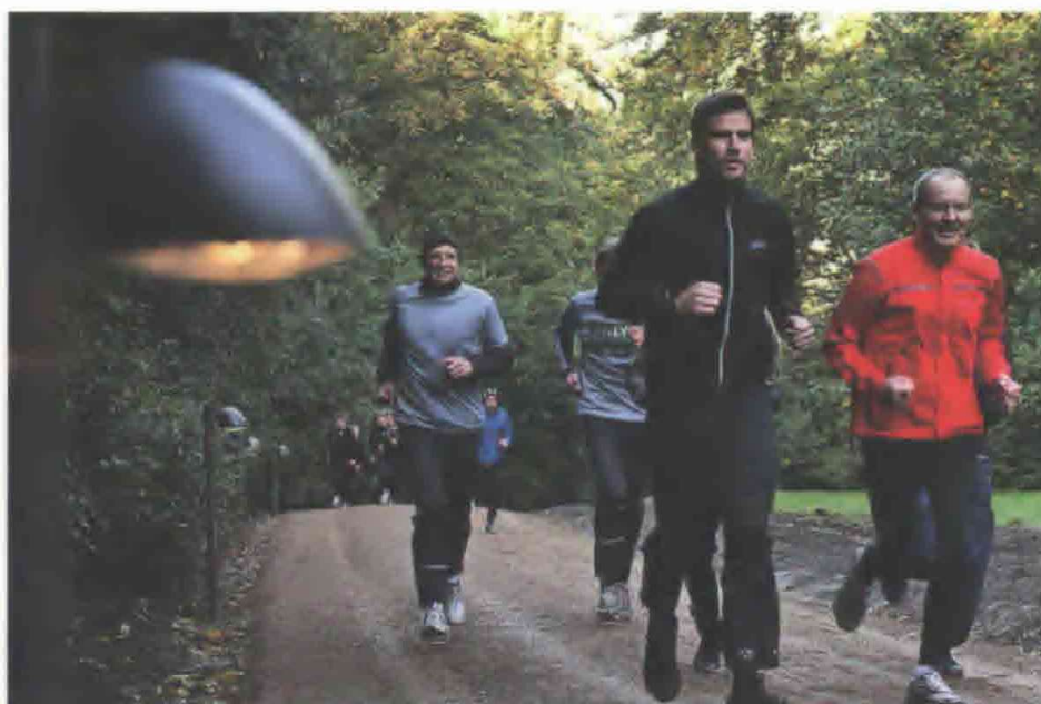
Fra den nye bevægelsesrute i Søndermarken, som forventes at tage noget af presset fra Frederiksberg Haves stier.

For at animere til bevægelse i Søndermarken er der etableret en innovativ motionsrute på 2,5 km med indbygget belysning og digitale funktioner. Fire aktivitetspunkter er placeret i haven, alle forbundet med motionsruten: En Oase, der indeholder små trampoliner og bøjler til træning, et Vildnis, der har stubbe, stammer og net til balancetræning, en Scene til alle former for træning på bare fødder som Tai Chi eller Yoga, og en Plads, der har infostander til aktivering af den digitale "harefunktion" til bevægelsesruten. De fire aktivitetspunkter kan naturligvis anvendes til mødesteder eller leg, ligesom der kan være mindre koncerter på Scenen, der ligger i et amfiteater-lignende terræn.