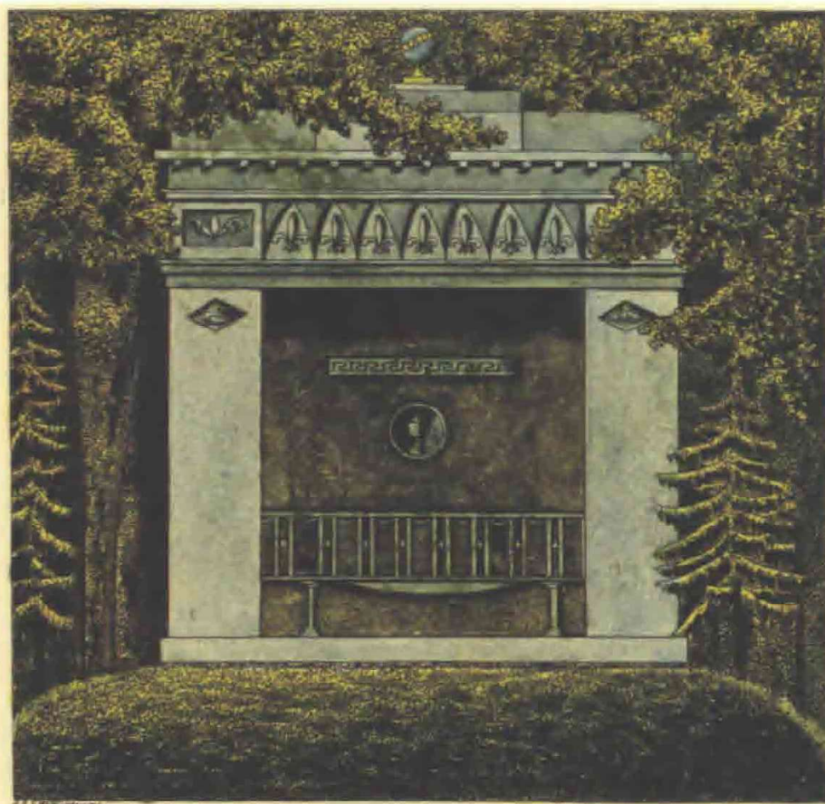
Kuglehytten i Søndermarken, gengivet efter Johann Ernst Christian Walters Prospekter af Søndermarken eller Kiöbenhavn og Omegn, 1826.

I forbindelse med projekt Liv & Lys blev det besluttet at opføre Kuglehytten, Eremithytten og Favnbrændehuset, samt at fortolke reminiscenserne af Den Kinesiske Pavillon. Bygningerne placeres, hvor de er gengivet på Landkadetternes plan fra 1814, bortset fra Favnbrændehuset, da det oprindeligt var placeret i et område af haven, hvor nu serveringsstedet Bjælkehuset samt Ewalds Bøg står. Favnbrændehuset placeres i stedet i en del af haven, hvor der ikke tidligere har været bygninger – i den nordlige del af haven, mellem Norske Hus og Springvandsplænen. Her findes stadig en materialeplads, som så opgives, og arealet bliver igen del af haven.