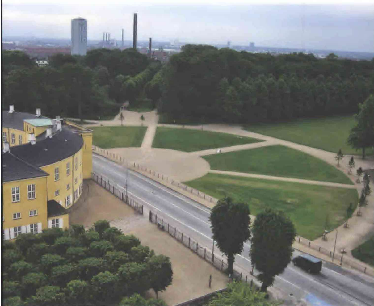
Det nyanlagte parterre ved Frederiksberg Slots sydvestre side forbinde igen slottet og Søndermarken.

det oprindelige barokanlæg. For at forstærke oplevelsen af Søndermarken som landskabelig have genskabes en række ellers forsvundne bygningsværker. De skal fungere som fokuspunkter for havens brugergrupper. Kildegrotten, hvor den oprindelige udsmykning er forsvundet, skal istandsættes, og Norske Bro er blevet rekonstrueret, så scenariet, som Norske Parti tidligere udgjorde, ligeledes er genskabt.