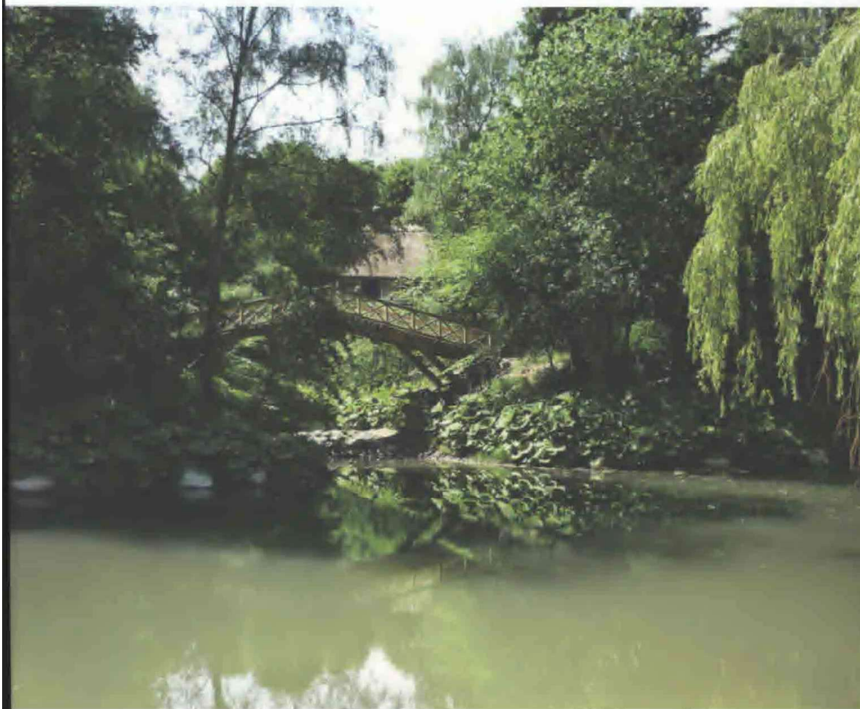
Norske Parti i Søndermarken fotograferet umiddelbart efter istandsættelsen i f.m. projekt Liv & Lys.

at alle de insekter og dyr, der lever i søen, overlever og kan være med til at holde søen levende. Tilsvarende vil sivene dårligere kunne få fat og igen lade søen gro til. For at sikre en god iltning af vandet er der monteret en pumpe, der trækker vandet fra den nederste sø og pumper det til den øverste. Dermed skabes endnu en oplevelse, idet vandet løber under broen, giver lyd og smukke billeder, samt sikrer iltning.