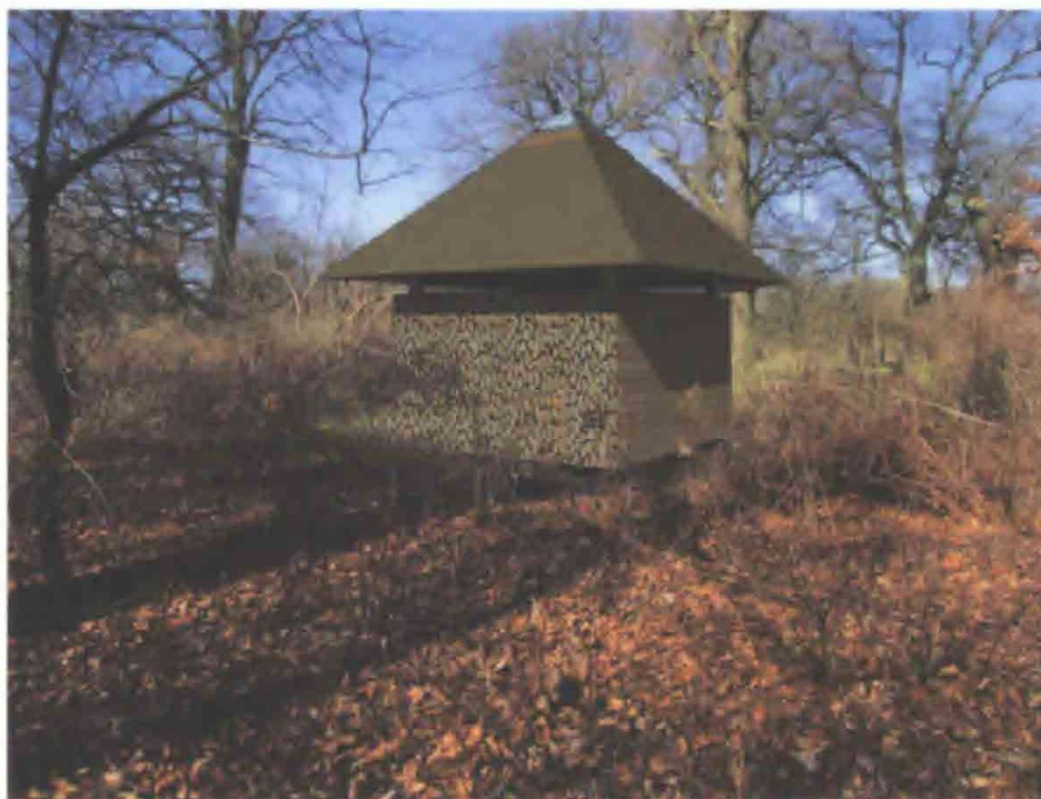
Det nyopførte Favnbrændehus i Søndermarken.