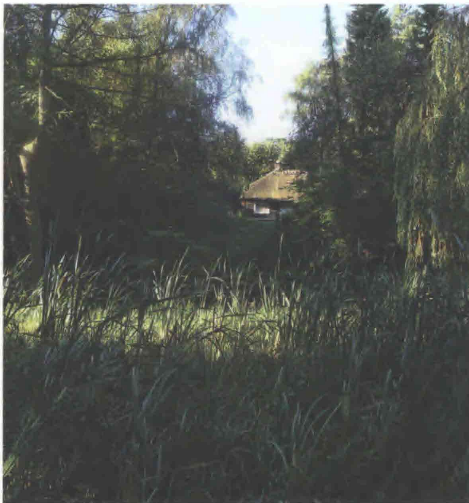
Norske Parti i Søndermarken fotograferet umiddelbart før istandsættelsen i f.m. projekt Liv & Lys.

prospekter fra Søndermarken fra 1826. Dog er broens sidestykker her ikke lavet af grene fra skoven, men af tømmerstykker – markeret som kryds mellem de lodrette stolper, der holder håndlisten. Fra Norske Bro stod alene fundamenterne i beton tilbage. De markerede broens tidligere placering. Fundamenterne er bibeholdt og brugt som støttepunkter for den nybyggede bro. Broen er bygget efter tegningerne, men der er sat volierenet i åbningerne mellem de markerede kryds, for at broen kan opfylde sikkerhedskravene i nutidig bygge Lovgivning.