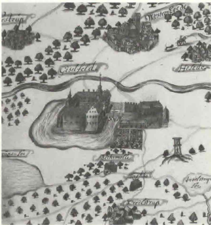
Fig. 1. Udsnit af håndtegnet kort fra omkring 1650, med Gisselfeld og Susåen. Syd er op.

Her er det nødvendigt at forklare vandbevægelsen i terrænet. Ned ad alle sider af den store hesteskoformede bakkekam løb små bække. I tidernes morgen har de dannet en sø tilbageholdt af den lille bakke, hvor Peder Oxe byggede sin borg. Overskudsvandet har banet sig vej igennem det laveste sted i bakken. Med tiden har afløbet gravet sig ned og dannet en kløft, vandstanden er faldet, og søen er langsomt blevet til den eng/mose, som Peder Oxe kendte.