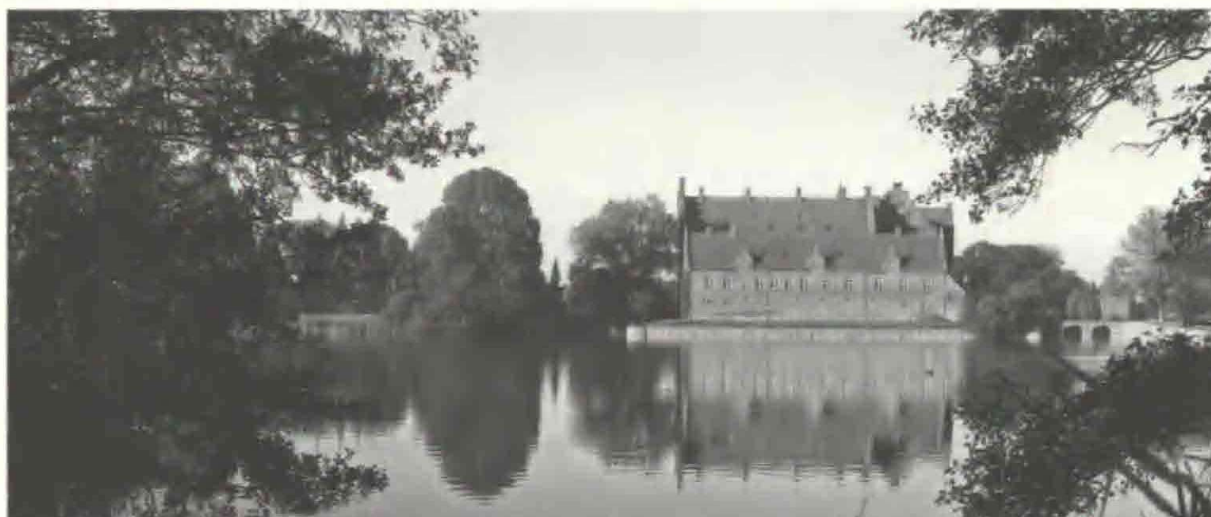
Fig. 2. Gisselfeld set fra nord mod syd over Gaardsøen.

Så vidt så godt, men allerede 1671 satte Hans Schack andre soldater i gang med at omforme terrænet neden for den lille bakke, hvorpå borgen lå.