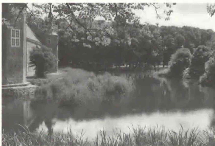
Fig.3. Vandkanterne er svære at holde, de bryder sammen og gror til. Voldgraven på Løvenborg.

Eksemplet med Glorup viser, at det ikke nødvendigvis svækker en have, at den