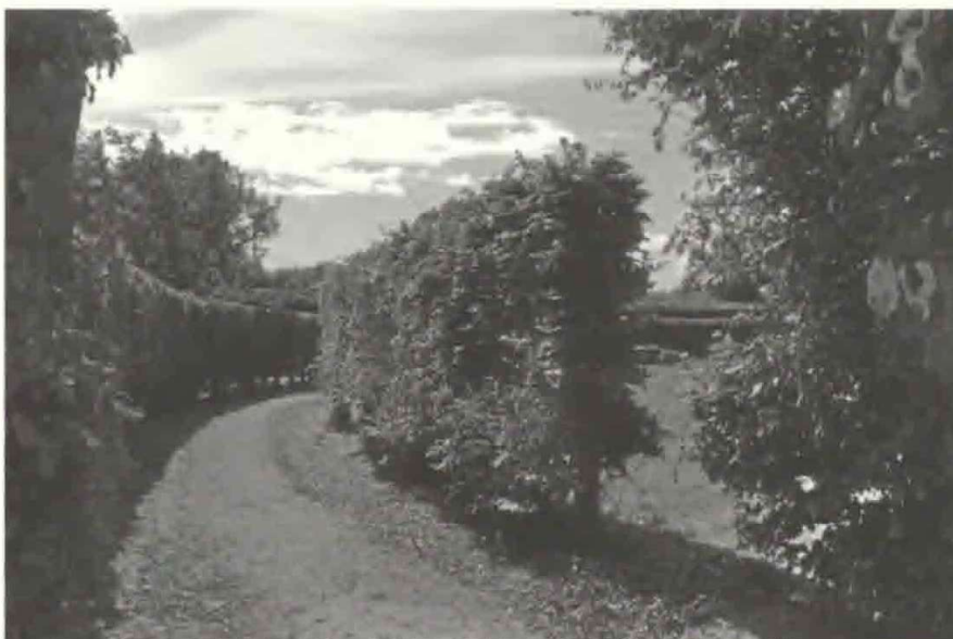
Fig. 5. De 200 – 300 år gamle hække er svære at klippe uden at beskadige de tykke stammer. Barokhaven på Søholt.