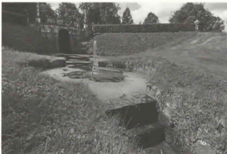
Fig. 1. Tilgroning og ringe vandkvalitet er et stadig stigende problem. Kaskaden på Bregentved.

til den basale dyrkningskunst og dermed til en stor del af vores samfundshistorie. Frygten for at miste en herregårdshave er ikke frygten for at miste haven som areal men frygten for, at et stykke historie går tabt. Mister vi haven, mister vi en del af vores kulturhistoriske fortid og samtidig en del af grundlaget for at udvikle og videretænke relationen mellem natur og kultur. Herregårdshaverne er imidlertid i et løbende forfald. Et forfald, som måske ikke umiddelbart sletter dem fra landkortet men truer med at forringe og forenkler dem i en sådan grad, at de mister både historisk og arkitektonisk værdi og samtidig hele deres fortælling.