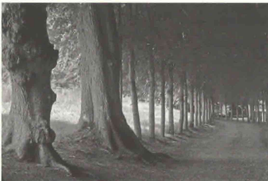
Fig.2. Det er nødvendigt med en strategi for fornyelse af de gamle træer. Alléen på Clausholm.

Det kræver dog mere og andet end økonomiske ressourcer og tålmodighed at bevare gamle haver. Først og fremmest kræver det, at fokus rettes mod processen frem for resultatet, så havens foranderlige natur inddrages som en central del af arbejdet. Det kræver også en klar skelnen mellem det, der er historisk autentisk og bevaringsværdigt og det, der kan tåle fysisk såvel som kunstnerisk fornyelse. En bevaring vil altid være nutidens fortolkning af fortiden og er således et fysisk udtryk for prioritering og vægtning af værdier.