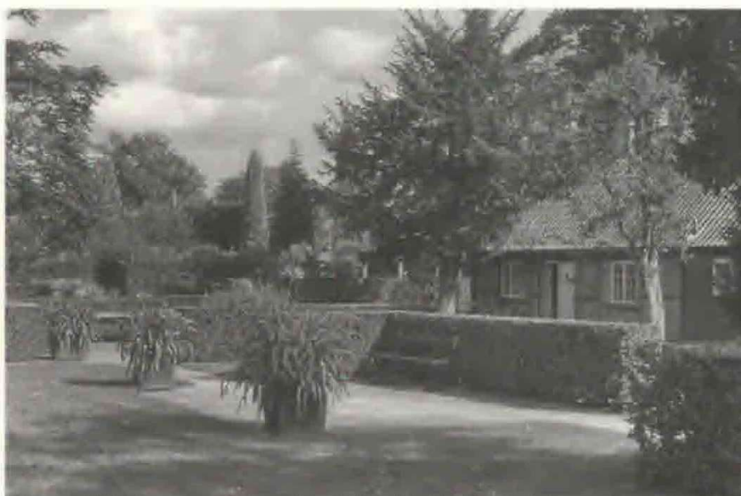
Fig. 3. Hækhaven med skærmlilje ( Agapanthus ) og den fredede gartnerbolig i baggrunden.

”For den der er kommet ud over det primitive stadium, hvor hver enkelt blomst eller busk anses for smuk i sig selv, og stiller visse krav til samspillet mellem de enkelte planters former og farver, vil det være en vældig støtte, om beplantningen planlægges ud fra et bestemt ledemotiv. I Det kongelige Danske Haveselskabs have har man i de senere år koncentreret sig om at bringe orden i det farvekaos, der let bliver resultatet, når haven gerne skal rumme alt, hvad man kan tænke sig af frilandsblomster. Man har – for at blive i musikbilledet – sorteret noderne og forvandlet en ulidelig larm til snart blid og indsmigrende snart stærk og brusende musik. Det kan gøres med farver, men også med former og vækstlighed.”