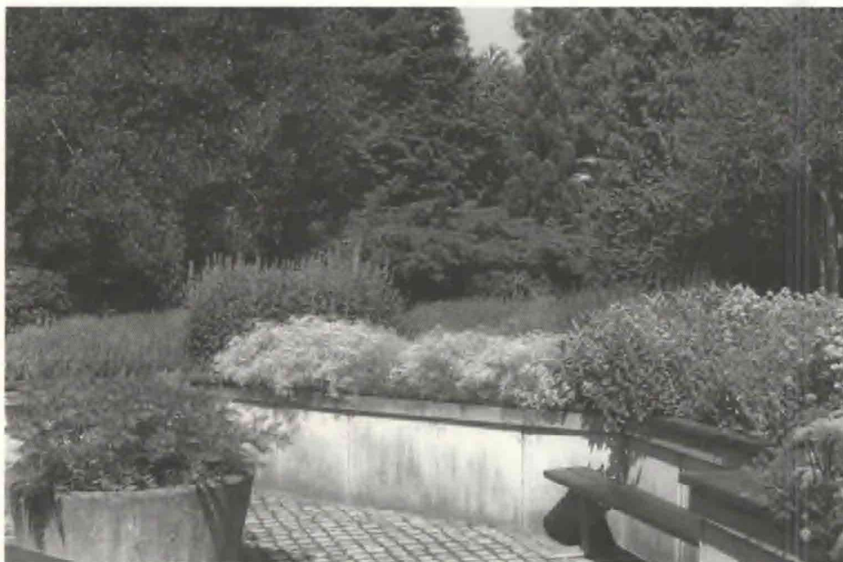
Fig. 4. Dufthaven.

Anlægsgartnereskolen, der i 1949 blev introduceret som både en redningsplanke og en værdig opgave for selskabet, var der ikke længere brug for. Der var sket en ændring af uddannelsen inden for anlægsgartneriet i slutningen af 50'erne og undervisningen ophørte 1963. Økonomien var fortsat meget skrøbelig, arbejdslønningerne steg og steg og haven var og blev vedligeholdelses-krævende. I 1970 fik Haveselskabet henvendelse fra Danmarks Naturfredningsforening, der var interesseret i at indgå samarbejde. Foreningen tilbød en klækkelig årlig leje for de to hovedbygninger, Kavalersfløjen og Brøndsalen, samt at overtage dets regnskabsføring og i øvrigt være behjælpelig i økonomiske og juridiske spørgsmål. Det var en stor lettelse og nu indledes en periode med nye økonomiske og driftsmæssige vilkår for Haveselskabet. Frederiksberg Kommune betalte ejendomsskatter og ydede andre tilskud til Haveselskabet, ligesom de gratis stillede en gartnermedhjælp til rådighed. Det samme gjorde Boligministeriet. Betingelsen var dog et modkrav om fri adgang til haven. I 1974 lykkedes det på generalforsamling at få vedtaget forslaget om at åbne haven for offentligheden. Havens eksklusivitet var ikke længere i lige så høj kurs i de demokratiske halvfjerdserne – og der var næppe heller noget alternativ, hvis Selskabet skulle fortsætte.