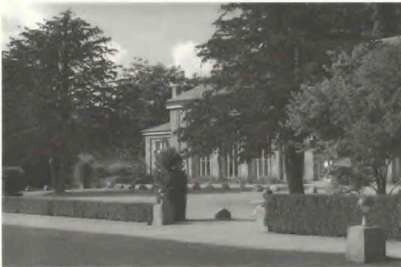
Fig. 1. Brøndsalen bygget i 1885

Flindt leverede selv tegningen til haven, ligesom han havde gjort til en stor del af landets herregårde. Om der var råd til at betale honorar denne gang, forlyder der desværre ikke noget om. Planter blev igen flyttet fra den gamle til den ny have. Der blev anlagt svungne plæner og busketter, slyngede gange, vandbassin med springvand, stenhøj med lysthus – omgivet af nåletræer og en buksbomkranset rosenhave, der eksisterer den dag i dag. 1 tdr. land var udlagt til driveri og prøvedyrkning af "florblomster", prydplanter. Der opførtes to store, nye væksthuse, det ene til formering og kultivering af potteplanter, det andet som Paradehus med en kold og varm afdeling. Den anden del af Prinsens Gård, den nuværende Kavalerfløj, var blevet ombygget til orangeri af N. Eigtved. Nu blev den indrettet til forsamlings- og udstillingssal, læseværelse med have-tidsskrifter, bestyrelseslokale, arkiv og gartnerbolig.