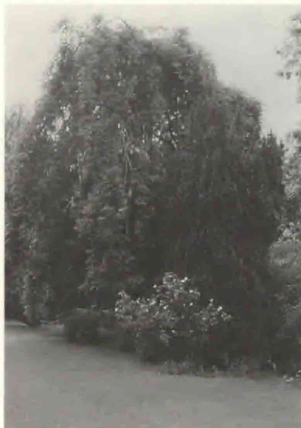
I en alsisk have står denne store Rosa alba Maxima-rose. Den blev oprindeligt hugget som et rodskud i præstegårdshaven.

Til gengæld vil jeg til enhver tid kalde det tyveri, hvis der bliver taget en stikling eller en plante i en planteSAMLING. Dels fordi der netop i samlinger ofte er sjældne