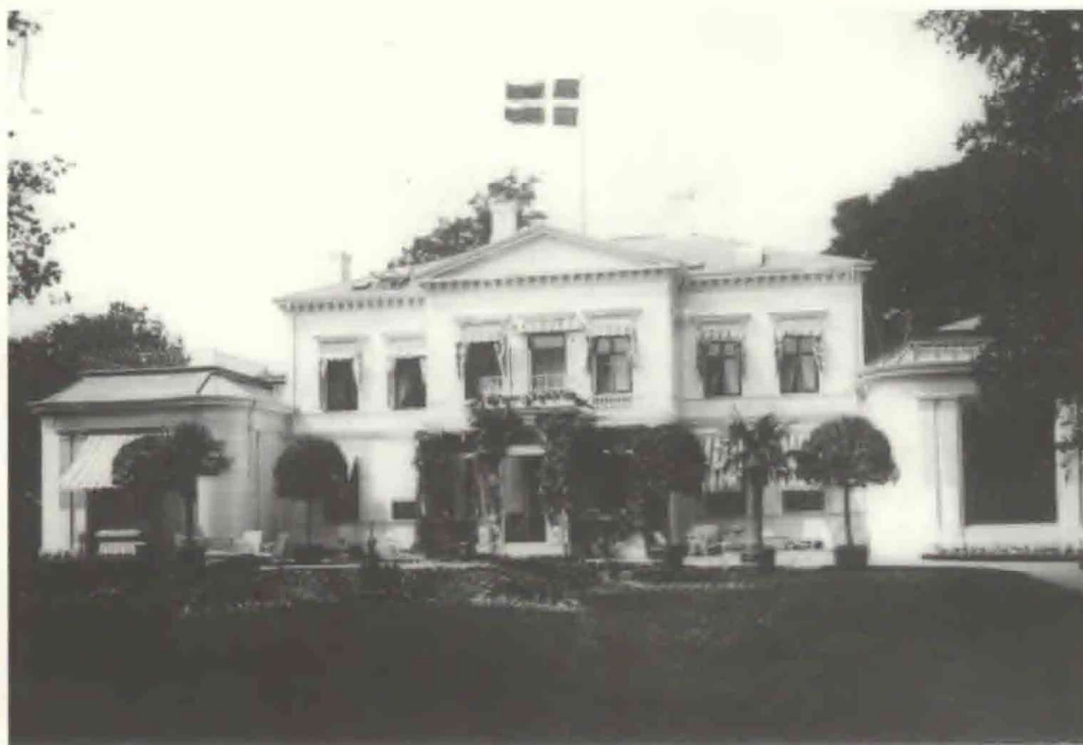
Fig. 2. Villa Adelaide fra havesiden med terrassen. Til højre vinterhaven. Foran blomsterhaven med springvand.

Privatgartneriet havde til opgave at forsyne husholdningen (på ca. 30 personer) med frugt og grøntsager, samt blomster og planter til udsmykning af hus og have. Der var seks drivhuse til dyrkning af vin, fersken med mere. Endvidere et palmehus med orangeri-planter til vinterhaven. Der lå en plads med 150 drivbænke og en frugthave med hovedsagelig æble- og pæretræer. Gartneriet blev drevet med professionel dygtig-