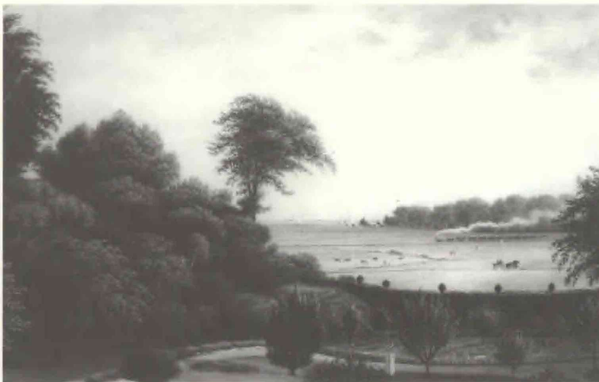
Fig. 3. Fra haven ved Villa Adelaide med udsigt mod syd-øst til Charlottenlund Skov og Klampenborgtoget.

I 1906 fejrede firmaet Moresco A/S sit 50-års jubilæum med en stor fest i Adelaide(5). Jacob H. Moresco døde samme år, og blev som chef efterfulgt af broder-