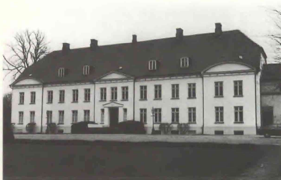
Fig. 1 Louisenlund slotsbygning efter udvidelsen i 1800.

Slottet Louisenlund blev omkring 1770 etableret som sommerbolig for prinsesse Louise (1750 - 1831), Kong Christian VII's søster, og hendes gemal, Prins Carl af Hessen, der residerede på Gottorp Slot i Slesvig. Prins Carl var af tysk herkomst fra Hessen-Kassel, ikke førstefødt, og han måtte af religiøse og politiske grunde forlade sit land. Den 12-årige prins blev derfor, med to brødre, af familieårsager sendt til det danske hof i København, der var meget anset i Europa, og hvor han kunne få en protestantisk opdragelse. Prinsen faldt godt til her og blev uddannet ved det danske militær, hvor han gjorde karriere og som 22-årig blev chef for artilleriet. I 1766 blev Prins Carl formælet med prinsesse Louise, men parret forlod for en tid det danske hof, tog