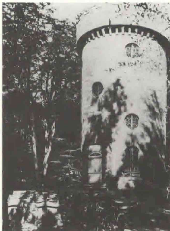
Fig. 5 Det såkaldte "Frimurertårn" i Louisenlunds have før det blev ødelagt efter 1. verdenskrig

Der findes to planer til haven henholdsvis fra 1796 og 1819 (se fig. 2). C. L. L. Hirschfeld beskrev desuden Louisenlunds park i sit berømte værk fra 1775 - 1777.