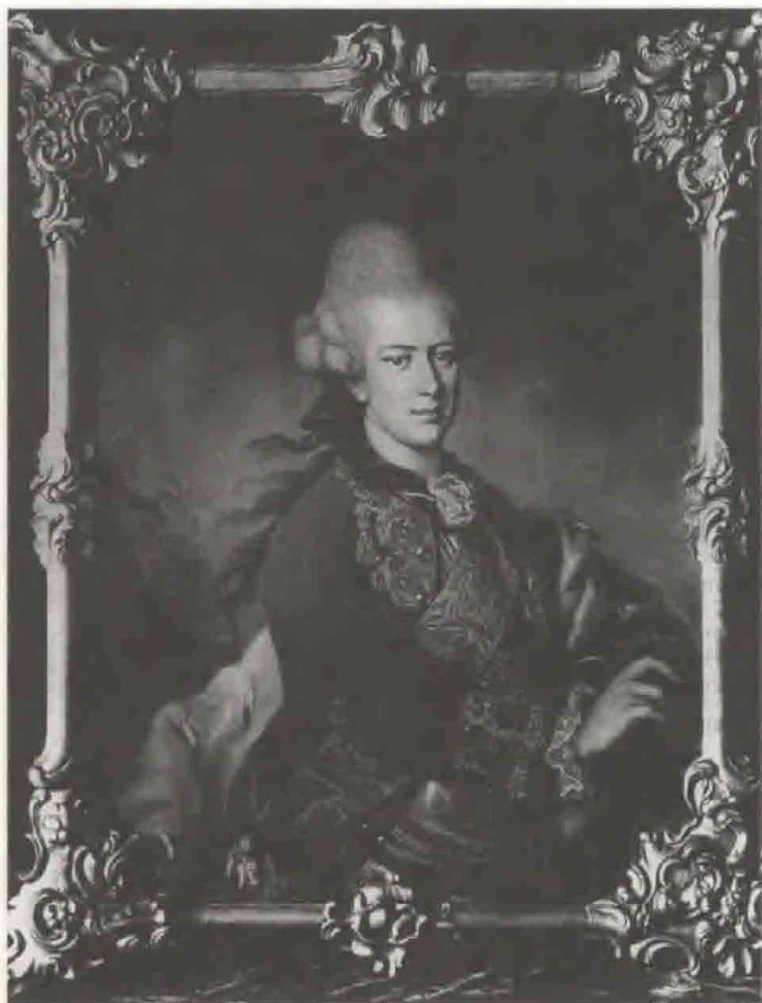
Fig. 4 Maleri af Prins Carl af Hessen, da han blev statsholder over Slesvig-Holsten

I den østlige del af haven blev der i en skovkant og ved en bæk bygget en lille eremithytte. En eneboer udskåret i træ og med bibel og krucifiks rejste sig op fra sit leje, når døren blev åbnet. Bagved lå her oprindeligt en labyrint. Længere væk og oppe på en bakke blev der bygget en norsk bjælkehytte, vel som et minde om Prins Carl's Norgesophold. Den blev brugt ved jagtselskaber, og var