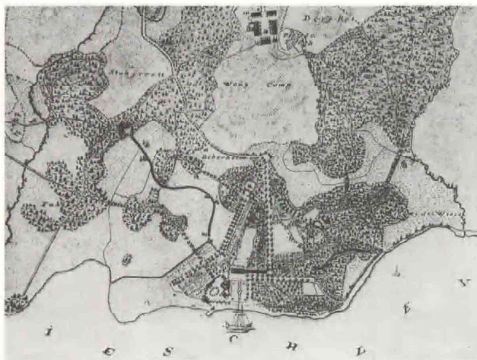
Fig. 2 Friederich von Kaup's plan over Louisenlund ca. 1819

te forhold satte også sit præg på parken ved Louisenlund, som mest blev præget af denne nye, frie havestil med de romantiske elementer, der også dybere set var symboler for frimurernes filosofi.