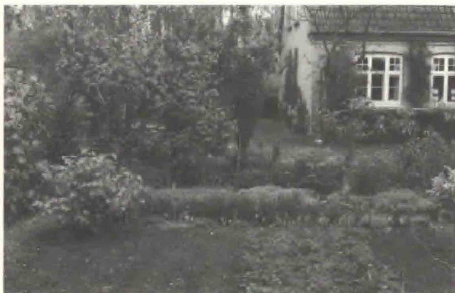
Fig. 1. Foto af haven. Stadager Brugsforening, Sundby, Nordfalster.

Selvom man ikke ønsker at genskabe havens nuværende udseende på museet, rummer disse opmålinger m.v. en fremragende form for samtidsdokumentation, som i gi-