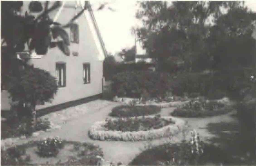
Fig. 2. Fiskerhaven, tilhørende Familien Frederiksen, fotograferet fra syd i 1991.

gonier eller forskellige sommerblomster. I de 2 sidebede ses blandt andet dagliljer, storkroser, pæoner, morgenfruer, tulipaner og brandliljer. De smalle grusede stier (ca. 75 cm) mellem bedene bruges ikke meget og er altid smukt og sirligt revne med tydelige rivespor, som det gøres i japanske haver. Haveindgangen fra vejen er markeret med en i kuppelform smukt klippet busk af benved. Inde i haven ses også et lille træ af hestekastanie med kronen klippet i kugleform.