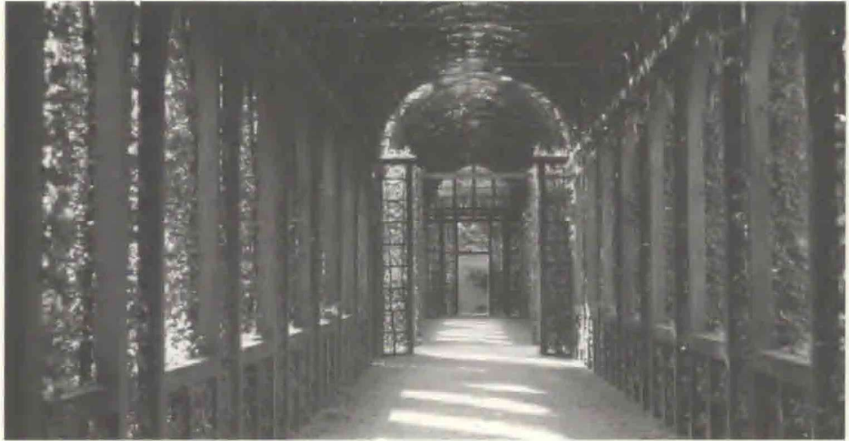
Fig. 3. Forestillende buegangen fra Het Loo:

På prospekterne er buegangene endnu ikke vokset til, men man må forestille sig dem som grønne tunneler, helt dækket af tæt klippede hække af enten avnbøg, som det er tilfældet her fra buegangen i Het Loo i Holland, lind eller elm.