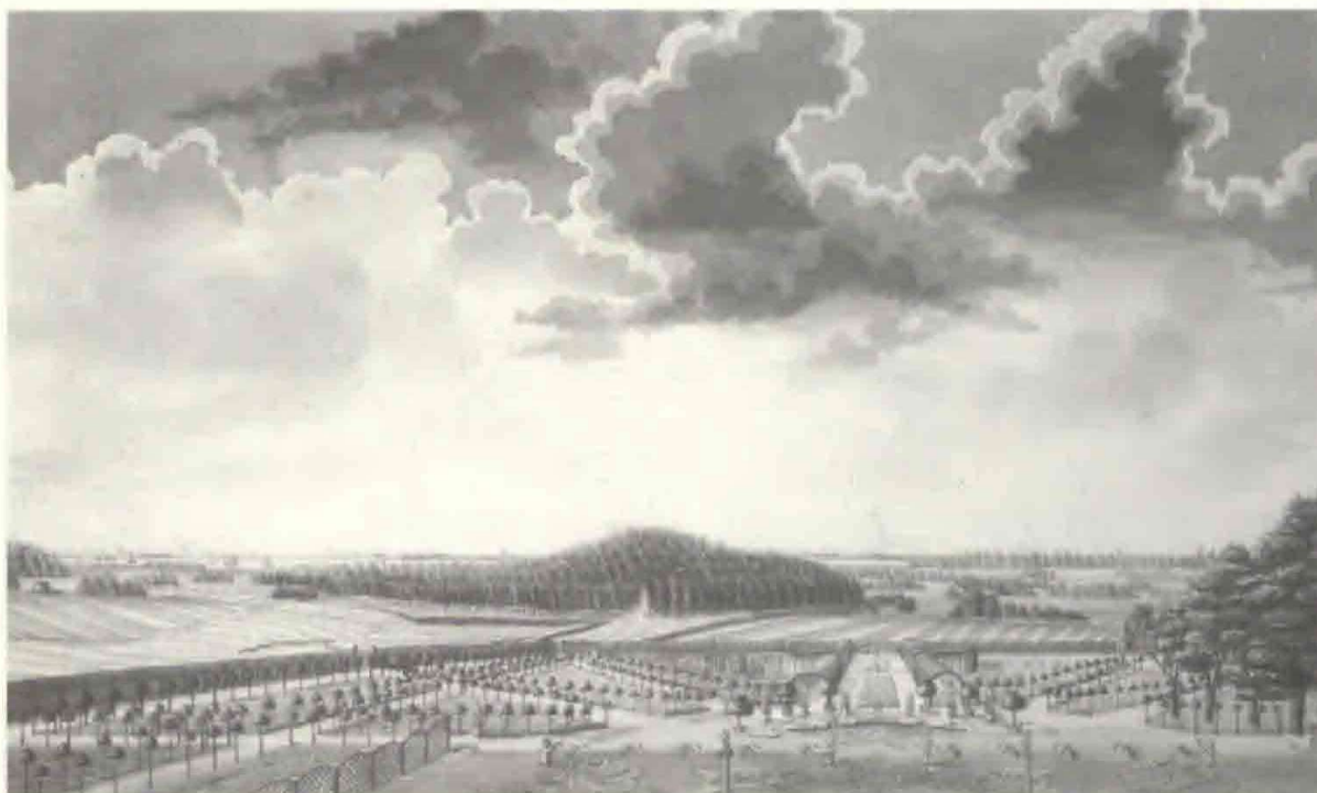
Fig. 2. Forestillende selve haven, med parterrebedet i forgrunden: "Prospect af Holte-gaards Hauge og Situationen ud over til Skaane Tagen ud fra hovedbygningen, Ao 1757. 1 Marie-høj 2 Dyrehaugen 3 Sundet 4 Skaane 5 Helsingborg 6 Lans-Crone 7 Hveen" J.J. Bruun. På dette prospekt ses tydeligt de store laurbærtræer og balustraden med salutkanonerne.

først Thurah og 1 1/2 år senere hans hustru og hele boet kommer som nævnt på auktion. Det bliver starten på en meget omskiftelig tilværelse for Gl. Holtegaard. Fra 1760 og frem til vort århundrede når stedet at have i alt 14 forskellige ejere i en periode på kun 140 år. Den længste tid huset er i samme ejers besiddelse er 18 år.