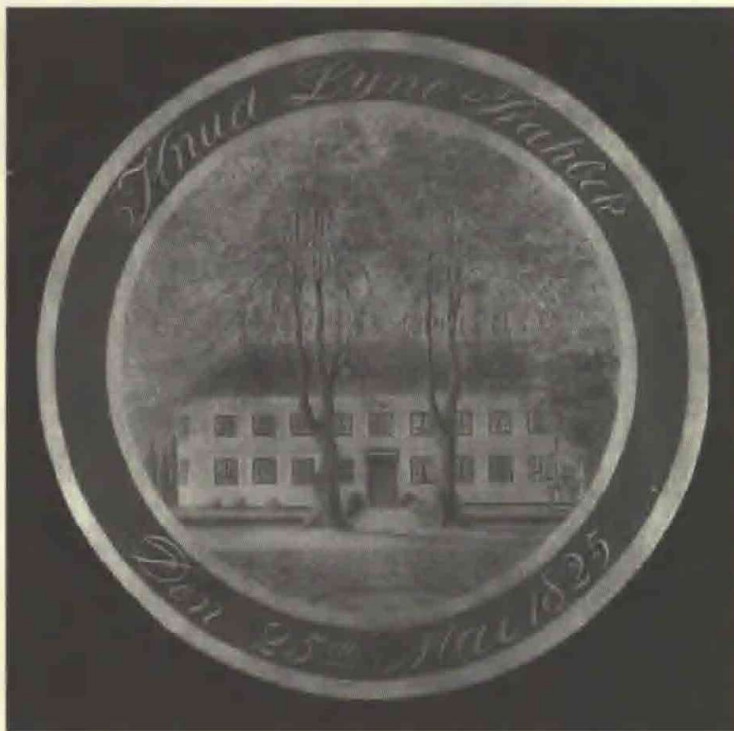
2. K.L.Rahbeks skydeskive. Bakkehuset 1825.