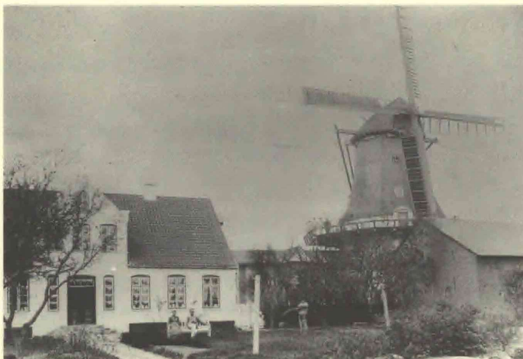
1. Møllerhuset og haven på fotografi fra 1880'erne, mens det første haveanlæg fandtes. (Foto: Højer Lokalhistoriske Arkiv og In-Foto, Højer).

Møllehavens udseende de første ca. 40 år kendes fra et enkelt fotografi, formodentlig fra 1880'erne. Haven var opbygget omkring en midterakse, der fra Skolegade ad en bred havegang førtes op til en halvcirkelformet muret trappe på fire trin til den dobbelte indgangsdør til husets "diele", som forstuen stadig kaldes på Højer-egnen. På hver side af den brede midtergang ses på fotografiet (ill. 1) et halvmåneformet bed omkranset af lave hække af buksbom, hvoraf det ene står tomt, mens det andet synes af være beplantet med roser.