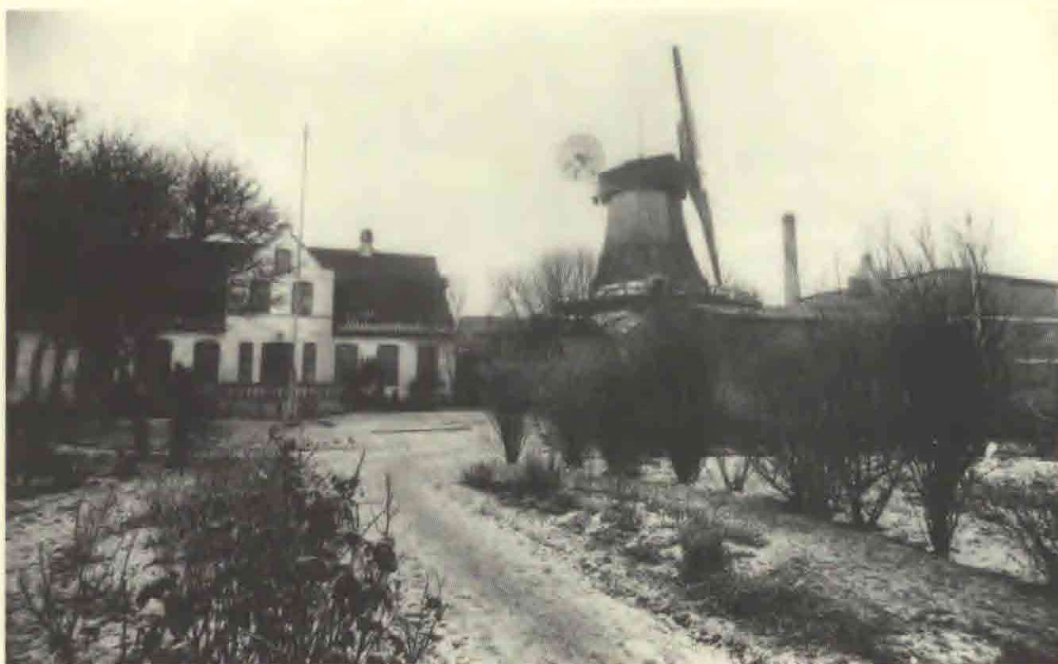
2. Møllehaven fotograferet i begyndelsen af 1900-årene, efter omlægningen af møllehaven. Bemærk de halvmåneformede bede i forgrunden, den cirkelformede græsplæne og verandaen med cementbalustre.

Formodentlig i et af de første år af det nye århundrede blev møllehaven lagt om. Det nederste stykke af haven mod Skolegade var stadig centreret omkring midtergangen, men ca. halvvejs inde i haven blev der anlagt en cirkelrund græsplæne med fire buede bede, ét i hvert verdenshjørne. Årsagen til omlægningen af haven synes at være, at mølleren havde bygget en åben veranda med lukkede cementbalustre omkring en kort skrå trappe i verandaens nordøstlige hjørne mod haven. Samtidig synes haven at have