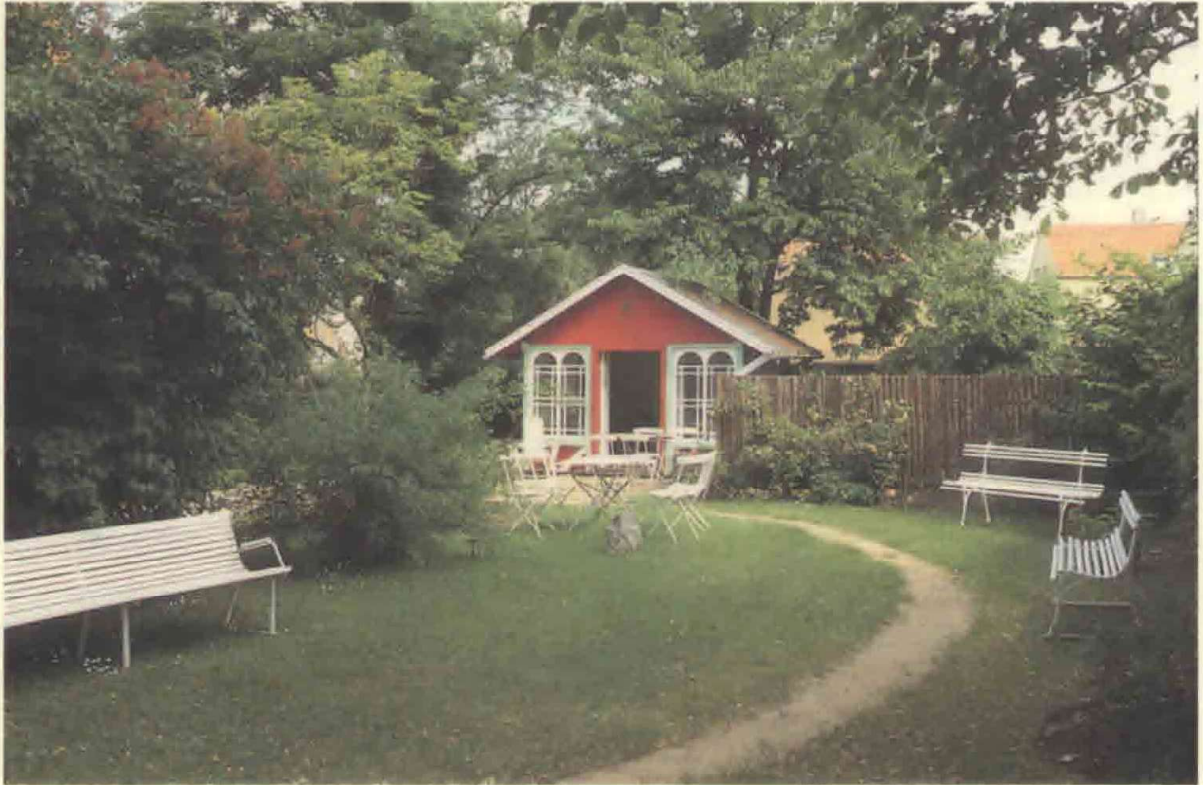
1. Det nuværende havehus står præcis, hvor det gamle hus stod. Med sin dør i midten, to sprossevinduer og tagrejsning minder det meget om det oprindelige havehus.