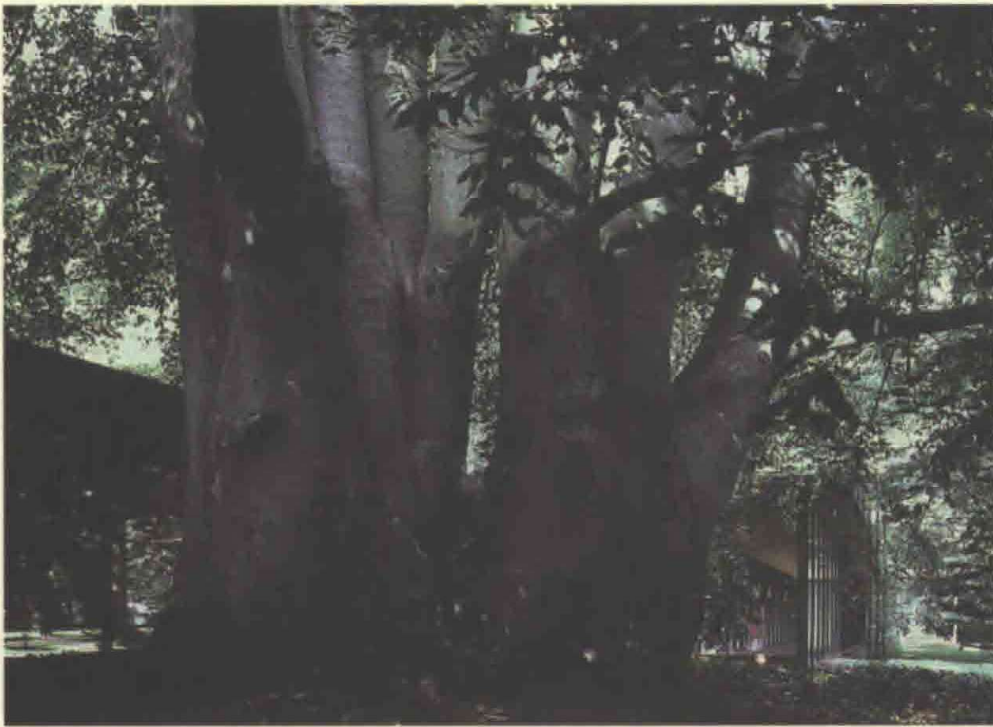
4. Ni-stammede bøg, Louisiana, Humlebæk.