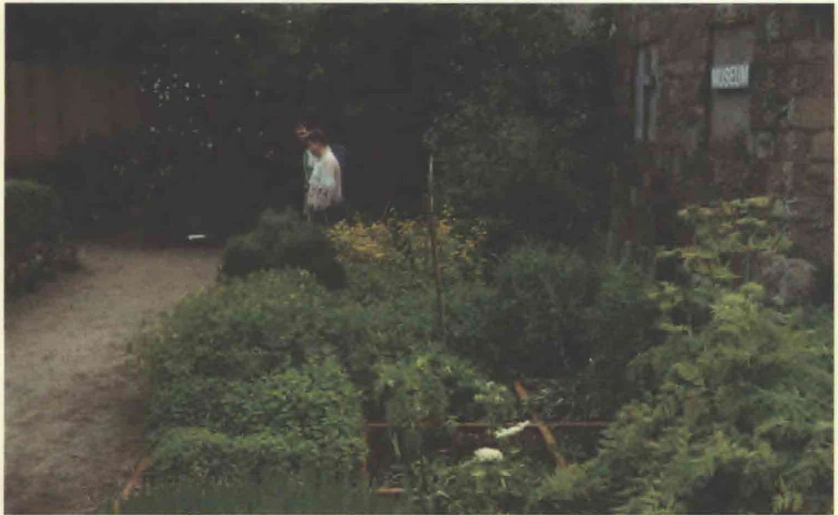
1. Øm klostrets have er anlagt omkring museumsbygningen "Klosterhuset", der rummer museets permanente udstillinger og magasin.