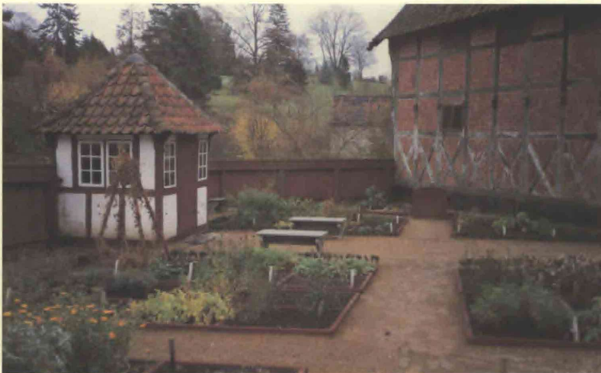
3. Apotekerhaven med lægeplanter i firkantede bede indrammet af egetræsrammer.