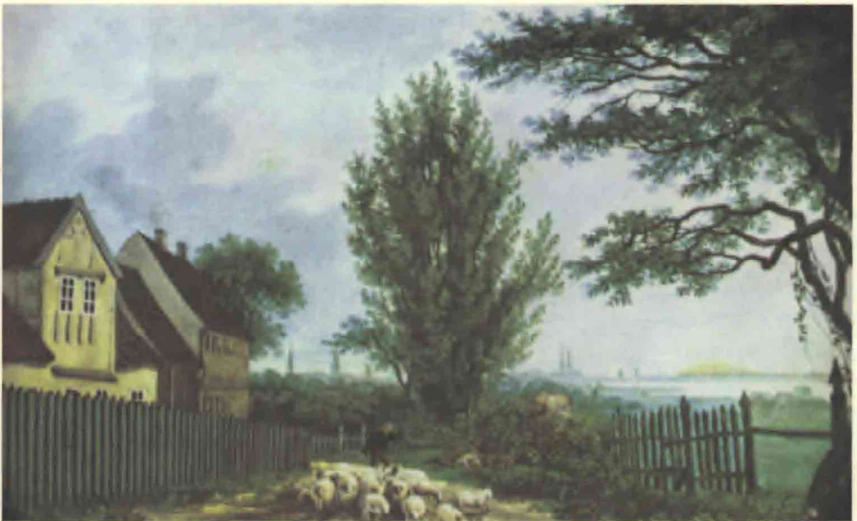
2. Bakkehuset, Gouache af Henrich Buntzen 1826.