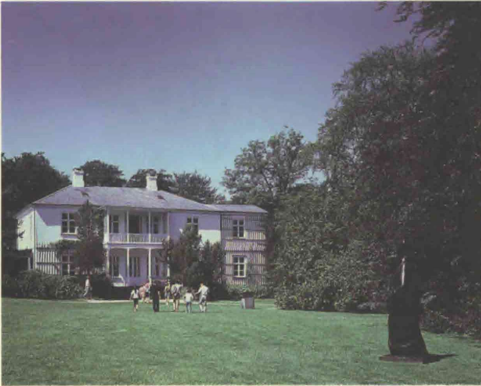
3. Hovedbygningen, Louisiana, Humlebæk.