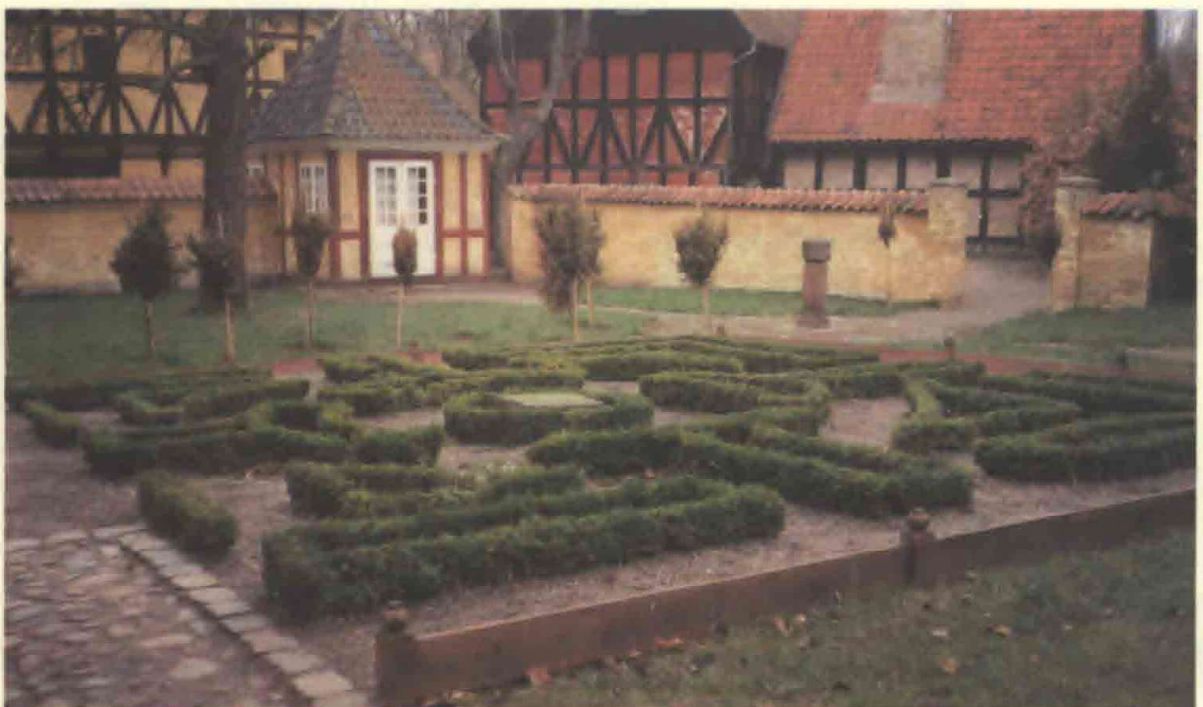
2. Borgmestergaardens have med bed efter Hans Rasmussen Block, med sirlige mønstre i buksbom, kantet af en rødmalet træramme med guldknapper.