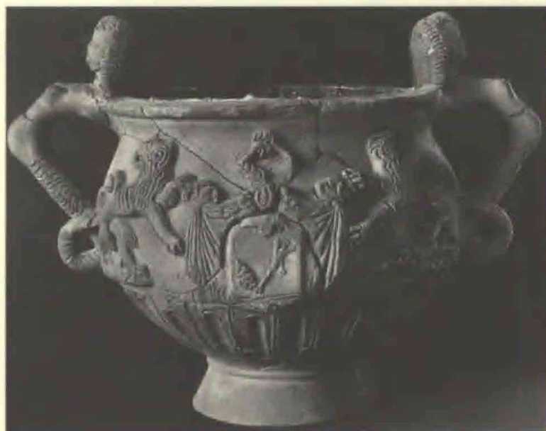
1. Havevase af rødbrændt lertøj (højde 27,5 cm, ydre tværmål 31 cm) med havfruehanke og løvefigurer omkring to våbenskjolde. Dette er forsynet med ørnelår med klo og med et hjelmtegn, hvor to ørneklør griber ind i hinanden, hvilket viser, at det antagelig er slægten Urne's våben.