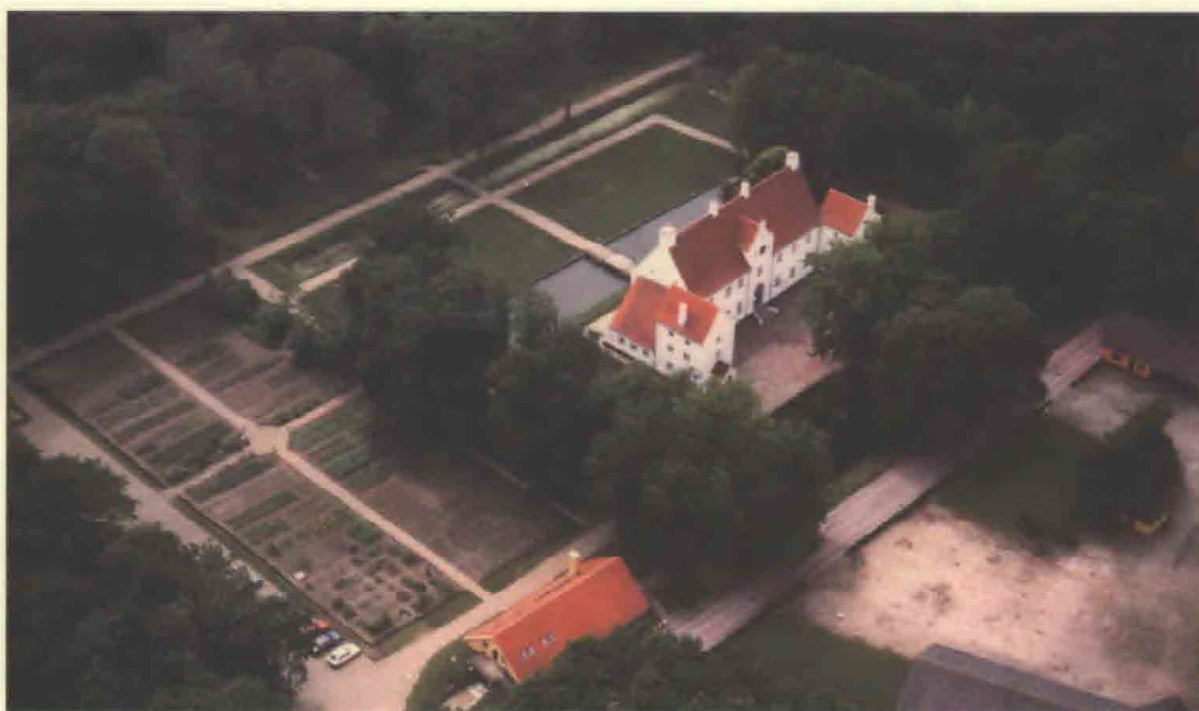
4. Sønderskov Hovedgaard set fra nordøst i sommeren 1994. Det snævre haveanlæg og de korte alléer er orienteret akseret med voldstedet og hovedbygningen. Haven begrænses mod syd af en lukket kanal og en tværgang i skovbrynet. Mod øst er der nyanlagt et afsnit af køkkenhaven. Skovparten vest for den korte lindeallé er vokset op siden 1700-tallet, idet der her også var udlagt nyttehøve og muligvis et lille orangeri eller væksthus.