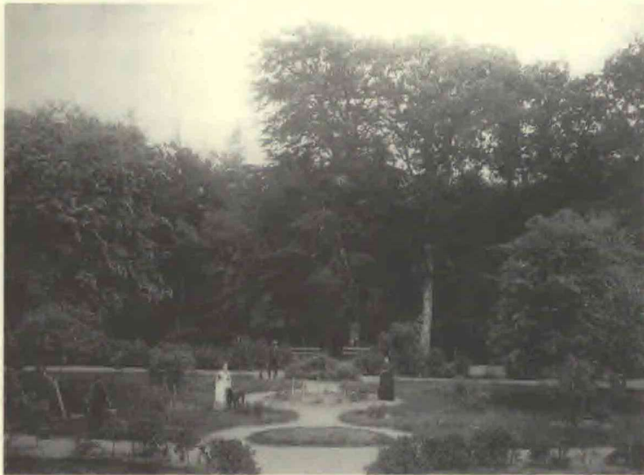
3. Sønderskovs parkhave i et vue over midteraksen set fra voldstedet i 1888, hvor barokhaven for længst var afløst af en mere romantisk landskabshave med nogle af bondegårdshavens elementer. Godsejer Peter Mømsen ses bagerst i mellemgrunden.