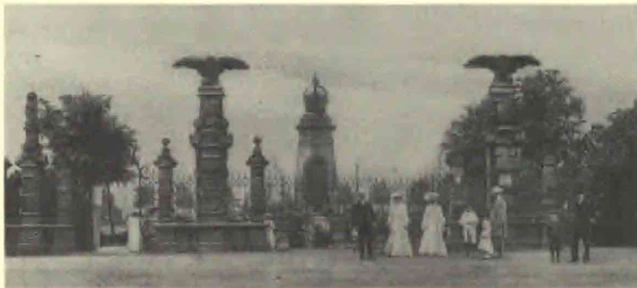
8. Kaiser Wilhelm Hain, Hovedindgang.

Parken var ikke blot en national manifestation, men blev i høj grad også et rekreativt område med sjældne træer og blomster, som flere gange blev