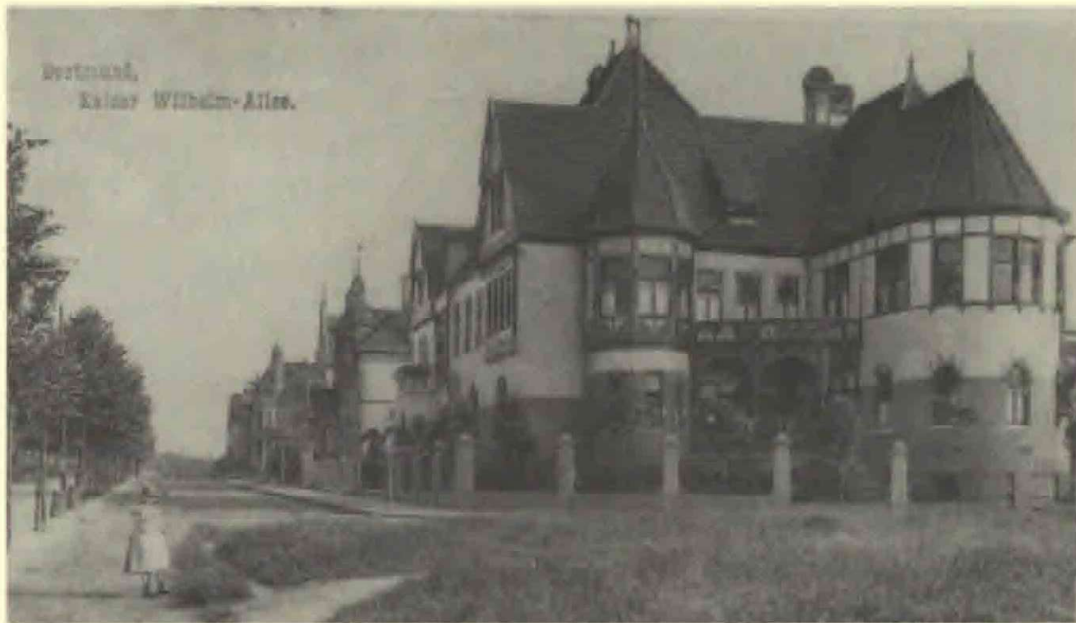
1. Dortmunds sydlige del var overvejende borgerskabets domæne. Kaiser-Wilhelm-Allee var en fornem adresse.

byens befolkning kombineret med en romantisk patriotisme koncentreret om kejser Wilhelm den 1. var baggrunden for etableringen af Kaiser Wilhelm Hain.