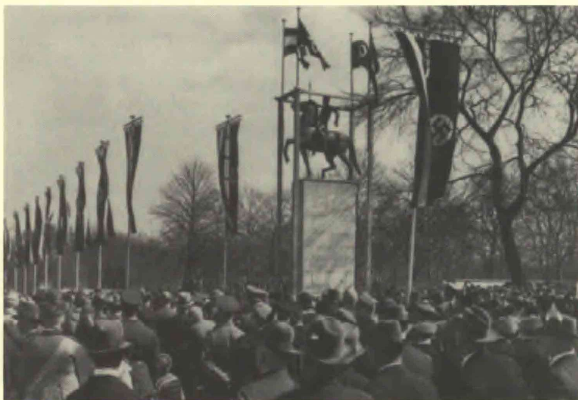
10. Krieger-Ehrenmal. I løbet af 1930erne kom nationalsocialismen til at præge hain-anlægget.

I 1926 erhvervede byen Dortmund også Buschmühle, en meget populær restaurant med tilhørende jord. Restauranten, oprindeligt en vandmølle, var startet som et ydmygt udskænkingsted af øl og mælk for byboere på søn-