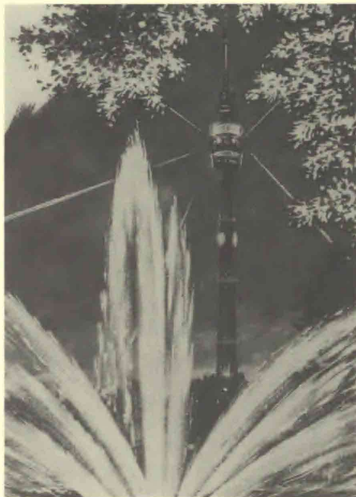
11. Fjernsynstårnet i Westfalenpark som symbol på teknologisk og økonomisk fremskridt. 1959.

Men det kom til at gå helt anderledes. I 1934 besluttede byen at modernisere Kaiser Wilhelm Hain med et Krieger-Ehrenmal af stærkt nazistisk tilsnit, ligesom det oprindelige indgangsparti blev nedrevet i 1938. Nu var det nationalsocialismen, der satte sit præg på parken. Der blev indkøbt jord til en stor græsplæne, som skulle anvendes til opmarchplads for det tredje riges ungdomsmøder, og ved krigsudbruddet blev der indrettet beskyttelsesrum under det 28 m høje Bismarck-tårn (bygget 1905). De fashionable adresser på Kaiser-Wilhelm Allee kom nu til at lyde på Adolf Hitler-Allee, og hvor man tidligere havde plantet Bismarck-egetræer, var det nu Hitler-linde. Det