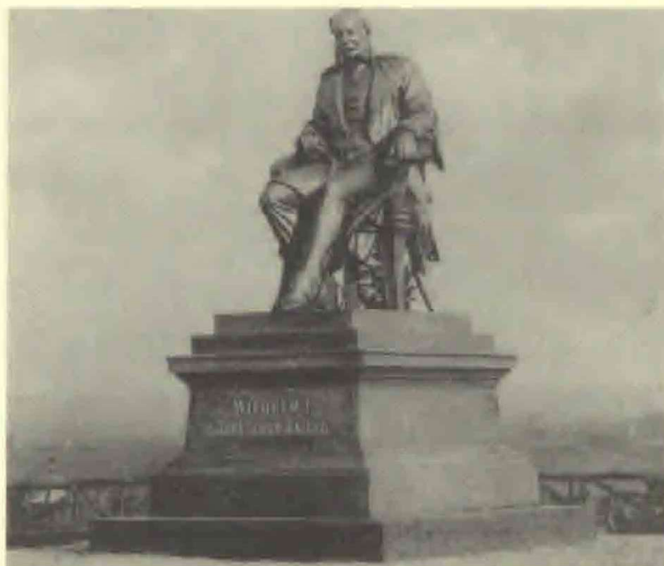
5. Oprindeligt var mindesmærket for Kejser Wilhelm I planlagt som en rytterstatue. På grund af pengemangel og kunstneriske overvejelser kom kejseren dog aldrig til hest, men måtte nøjes med at betragte sine undersåtter siddende i en stol.