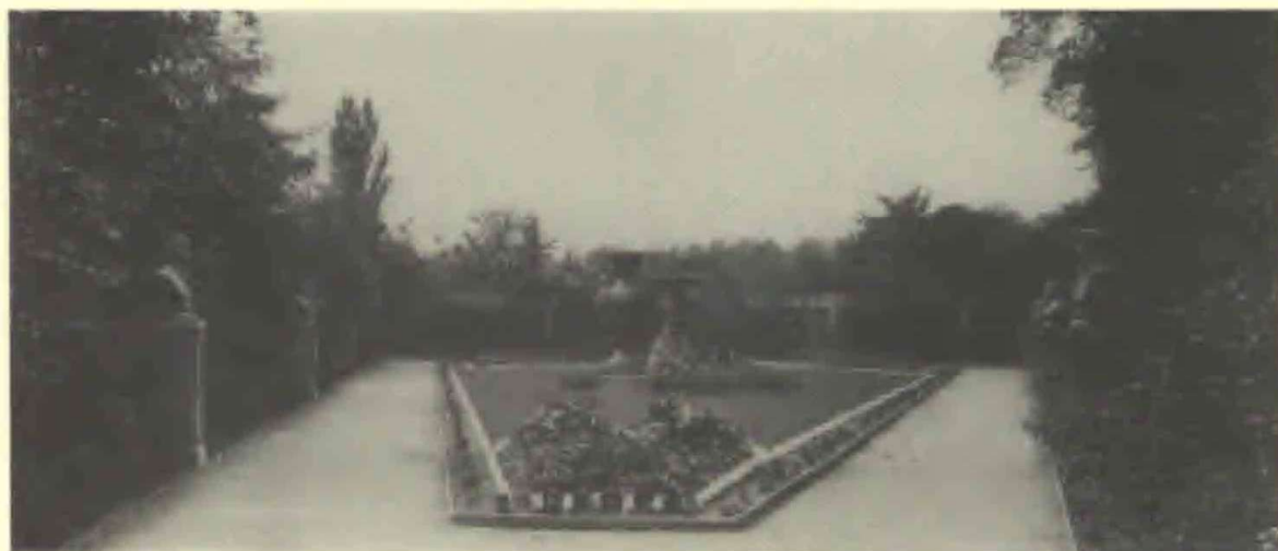
2. Det lille franske haveanlæg foran labyrint-indgangen i Tivoli ca. 1890.