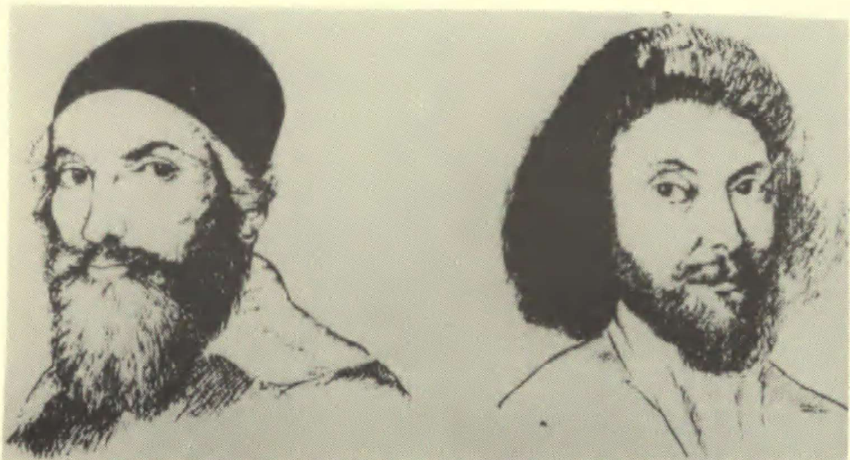
John Tradescant senior og junior. Kopier efter originaltegninger i Ashmolean Museum.

Endelig har man i foråret 1986 åbnet det første museum for havehistorie i London. Det er indrettet i den gamle kirke St. Mary-at-Lambeth, som ligger for enden af Lambeth Bridge på den anden side (østlige) af Themsen, lige overfor Parlamentsbygningen. Initiativtagere til dette første museum af sin art i verden er The Tradescant Trust. Tradescant-navnet er knyttet til en engelsk gartner- og botanikerfamilie, som i 1500-tallet havde stor faglig betydning i 3 generationer. Oprindeligt stammede navnet