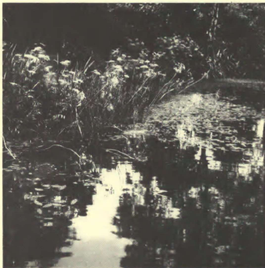
Langs søbredden under birkene fik naturen lov til at være i fred.

Efter en rotur går vi videre rundt om søen. Først igennem nøddegangens lange, kuplede hulrum, forbi lindelysthuset, der blev meget brugt dengang før første krig, da der var unge piger i huset, som brugte cyklen til at transportere frokosten den lange vej fra køkkenet.