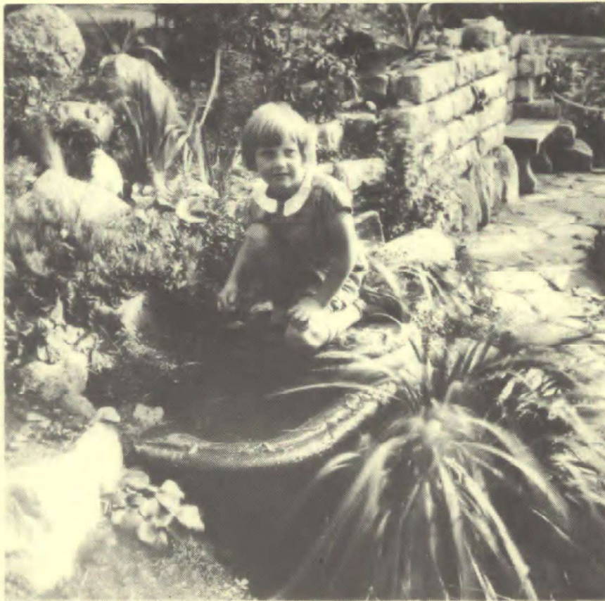
På stenhøjen rislede også en kilde, der løb gennem en stenkumme fra et gammelt slot. Ca. 1924.