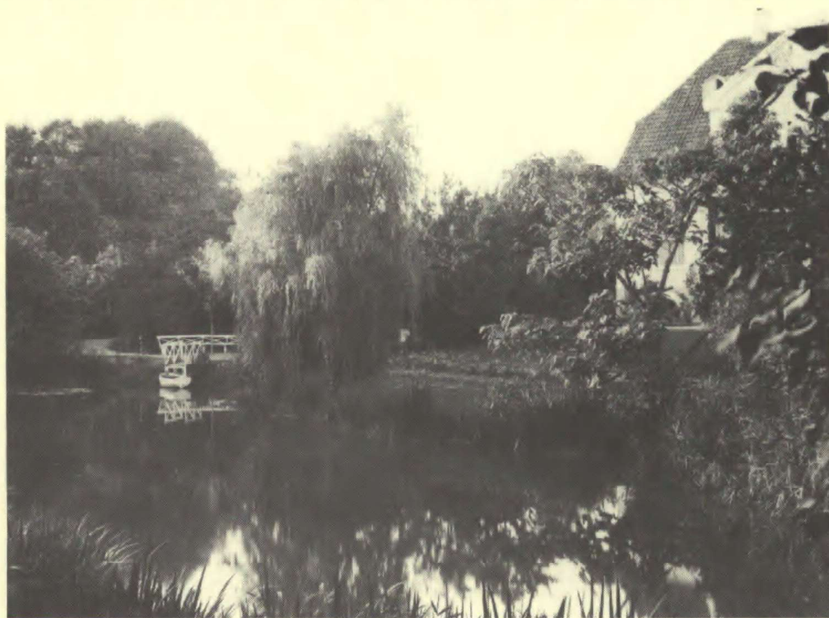
Søen var havens midtpunkt, og omkring den spadserede vi alle på den daglige havevandring efter middagen.

»Når jeg nu tager fat på at beskrive min barndoms have, er det, fordi spørgelisten så stærkt tilskynder mig til det. Den nævner mange ting og forhold, der indtil nu har været ganske selvfølgelige og derfor ret betydningsløse i større sammenhæng. Nu tillægges de pludselig en betydning