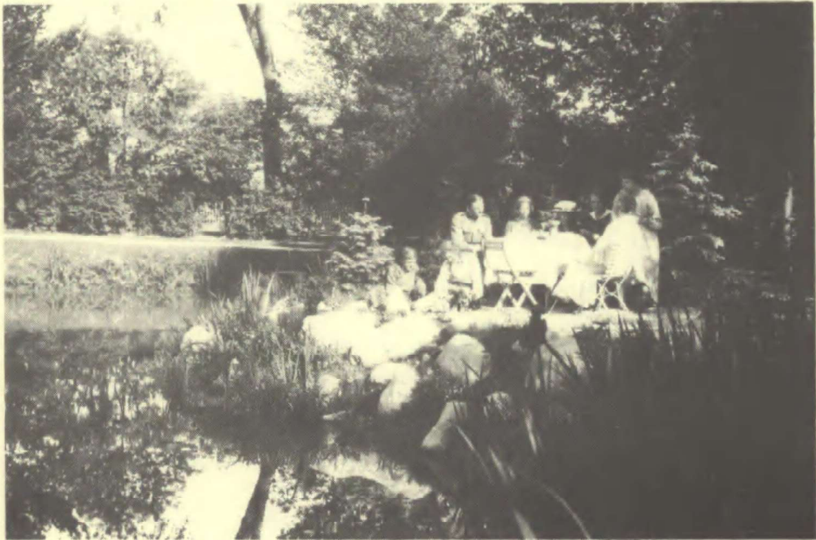
En udflugt til thebordet på den anden side af søen. Ca. 1918.