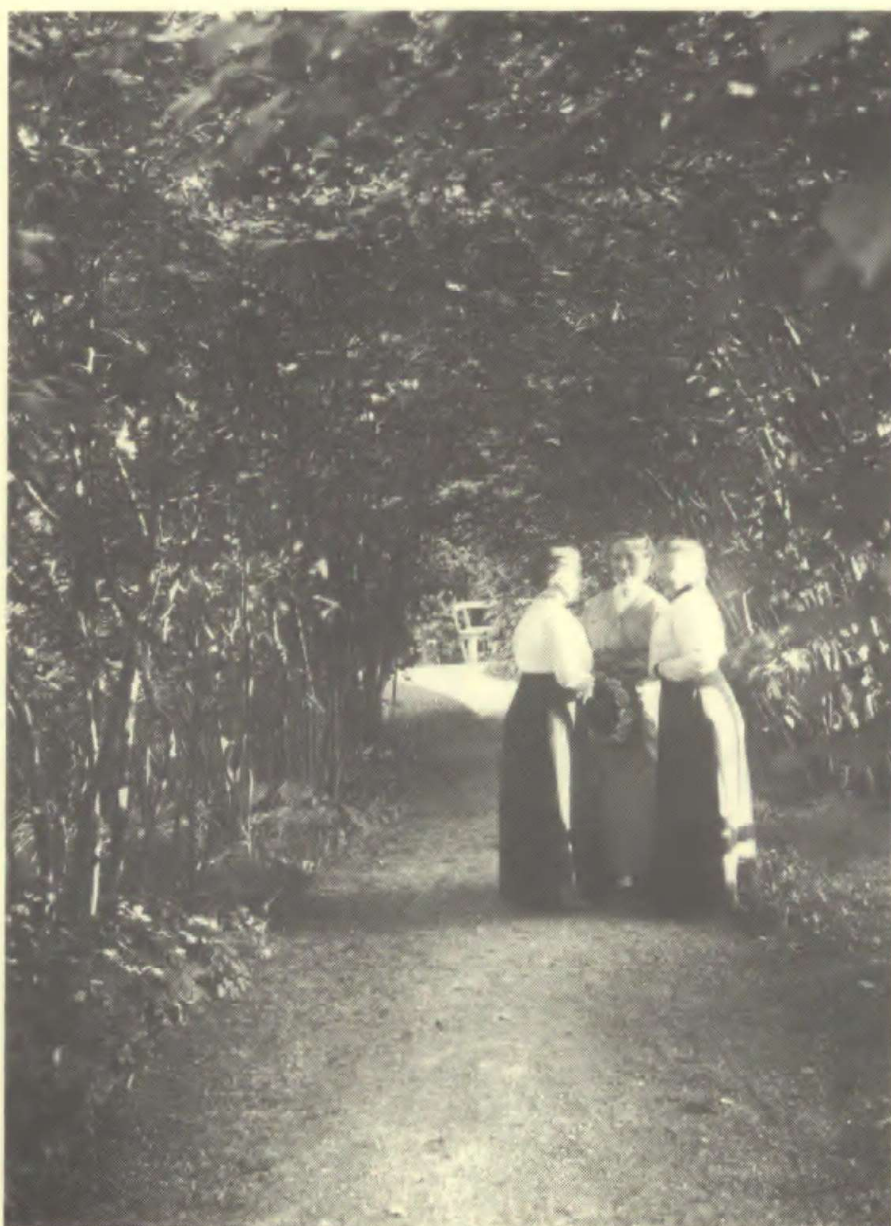
Sent om eftermiddagen falder lyset ind i nøddegangens grønne mørke. Ca. 1917.

Da min far i 1910 købte hus i Charlottenlund, var det sikkert lige så meget haven, han købte; for det helt betagende ved stedet var, at der lå en lille sø, så tilpas stor, at det ikke virkede urimeligt med robåd og bådebro.