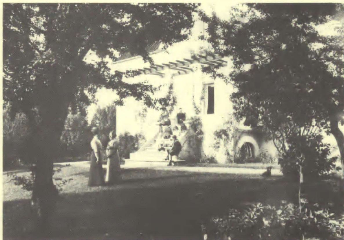
I sommertiden holder man til på verandatrappen og på plænen. Ca. 1915.

Inspirationskilden har måske været havekunst , det nye tidsskrift vi holdt alle årene, for det bragte på den tid mange artikler om alle de ukendte planter, der netop på denne tid kom i handelen herhjemme. Planternes