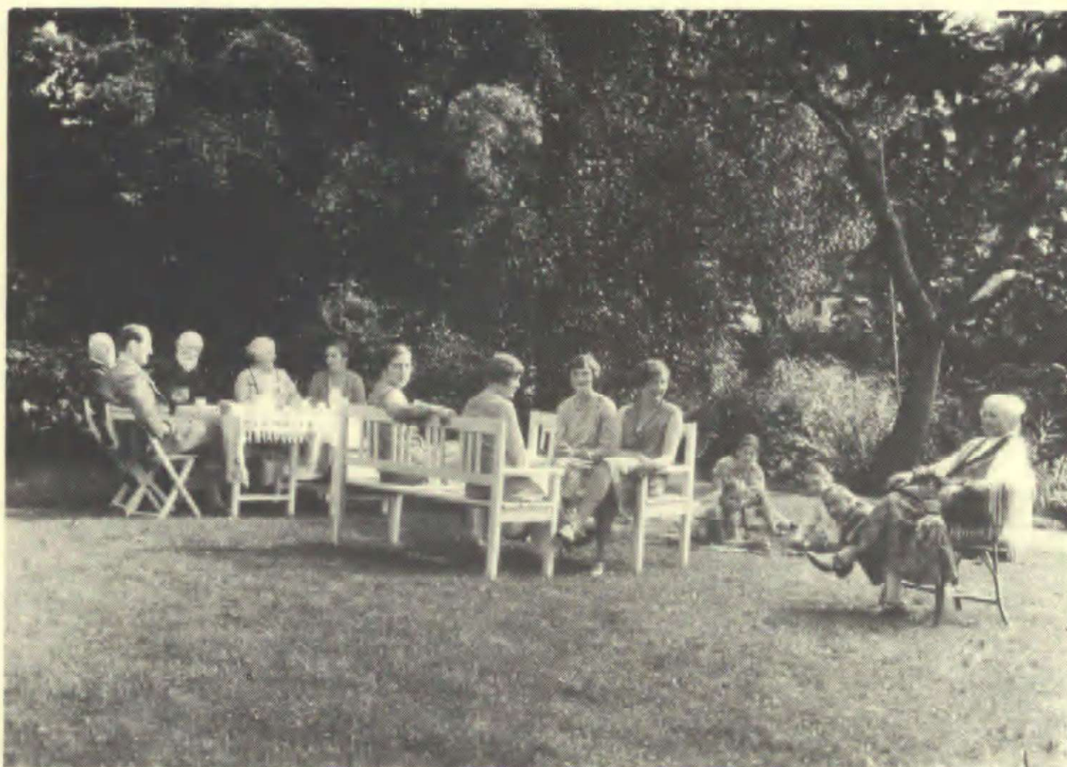
En søndagseftermiddag på plænen i 1929.

Foran huset breder den pompøse verandatrappe sig gæstfrit til begge sider, og sammen med den blåregnprydede loggia er den familiens foretrukne opholdssted. Herfra er der så dejlig en udsigt over plænen og søen, og herfra kan man se alle de prægtige træer, hvis ve og vel ligger alle på sinde. Her står »det røde træ«, en Prunus cerasifera 'Pissardii', der springer så tidligt ud, og hvis grene bliver taget ind i vaskekælderens til senere drivning i stuerne. Der er rødtjørnen og den fyldtblomstrede hvidtjørn.