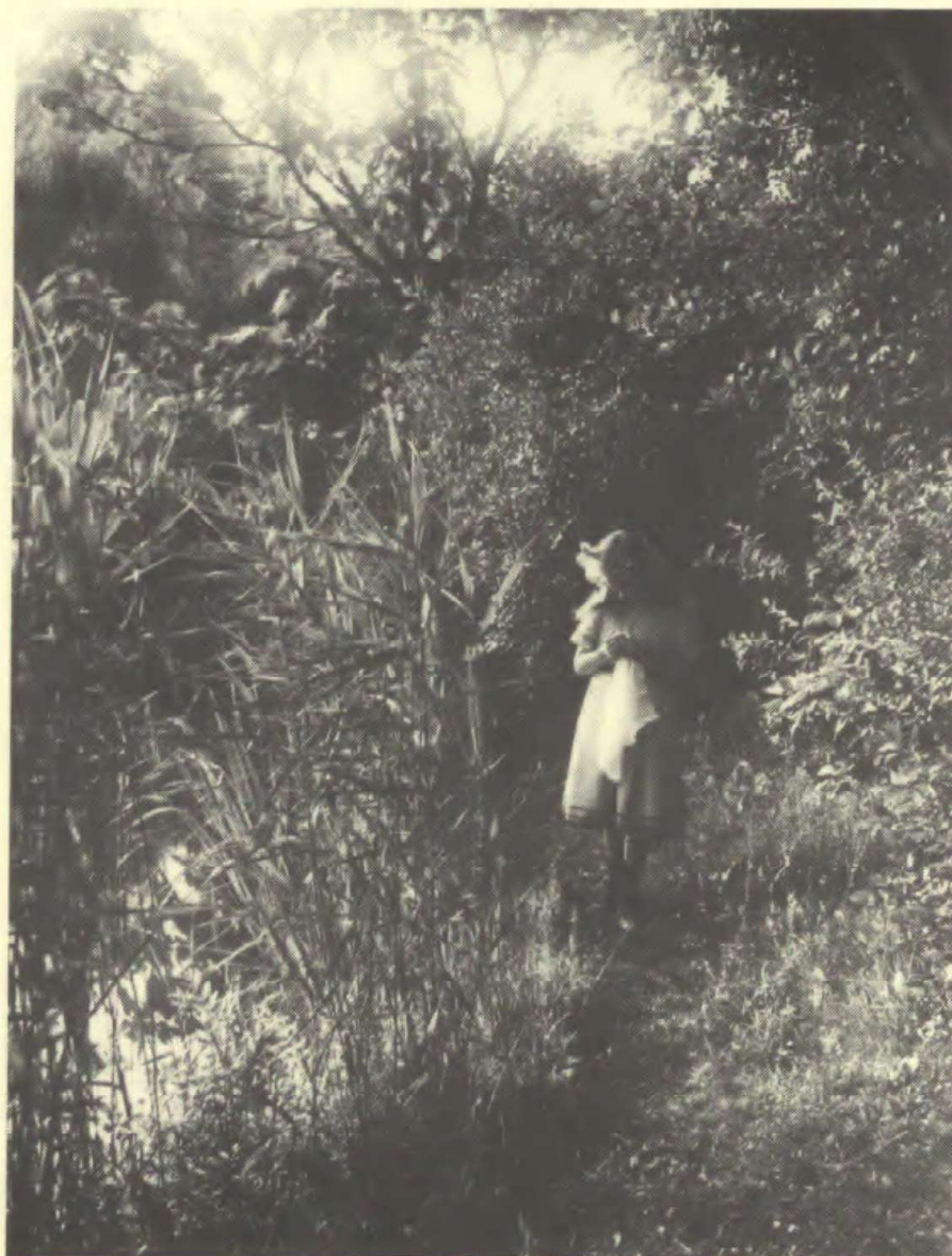
Den hemmelige sti, hvor man er næsten helt alene i naturen.