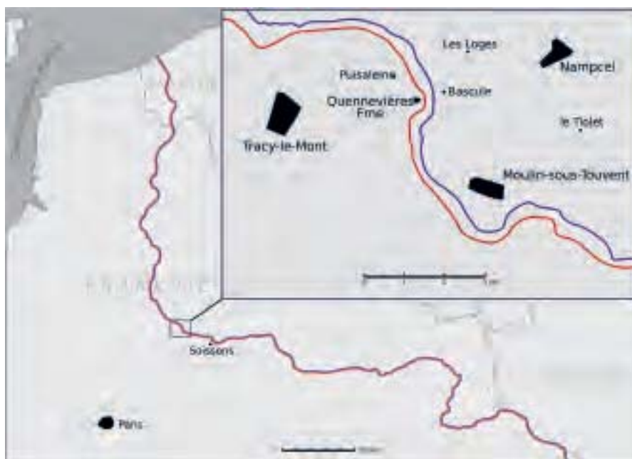
Kort over frontforløbet i Nordfrankrig juni 1915 med detailkort over frontlinjen ved Moulin-sous-Touvent.

For at aflede tyskernes opmærksomhed og binde flest muligt tyske tropper blev det besluttet at gennemføre en række mindre angreb. En række af de armeer, der ikke skulle deltage i offensiven, fik derfor den 17. maj 1915 ordre om at komme med forslag til afledningsangreb. To dage senere fremsendte VI. Armé en plan, udarbejdet af chefen for 61. infanteridivision, general Robert Nivelle, den senere øverstkommanderende for de franske styrker. Hans forslag gik ud på at gennemføre et angreb på et fremspring i den tyske skyttegravslinje lige nord for landsbyen Moulin-sous-Touvent over for gården Quennevières. 2