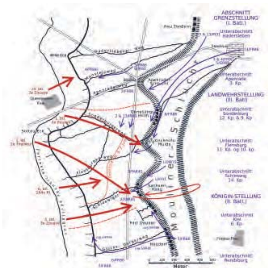
Kort over det franske angreb og de tyske modangreb ved Moulin-sous-Touvent 6. juni 1915.

hvordan de franske tropper bemandede stormparallellen, men først da det franske artilleri forlagde beskydningen åbnede batterierne ild. 33 Batterier fra Feldartillerie-Regiment Nr. 9 åbnede allerede ild, da det afsluttende franske bombardement satte ind. 1. batteri beskød fra sin stilling nordøst for Nampcel området ved Quennevières Ferme, mens 4. batteri fra Tiolet-Fe beskød den sydlige del af det franske angreb og i løbet af dagen affyrede henimod 3.000 granater. 34 Batterierne fra Feldartillerie-Regiment Nr. 45 havde også besvaret det franske bombardement fra begyndelsen, men regimentshistorien forklarer, at det ikke lykkedes at bremse