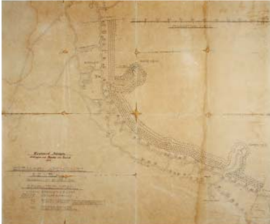
Kort af et skyttegravsafsnit for en deling fra 86'ernes 4. kompagni, april 1915. En typisk tidlig skyttegrav med små dækningsrum og kun et enkelt bælte af pigtråd.

tyske 18. Infanterie-Divisions område og var bemanded af Füsilier-Regiment Nr. 86, der havde ligget i stillingen siden januar 1915. Den tyske frontlinje mellem Soissons og Reims fulgte Aisne, der her har en generel vestlig retning, men lige øst for Moulin-sous-Touvent drejede fronten mod nordvest, og den skyttegravs-linje, 86'erne overtog i januar 1915, løb omtrent nord-syd, og bliver i regiments-historien betegnet "som den mest trøstesløse stilling regimentet kom i berøring med indtil vinteren 1916/1917" 7