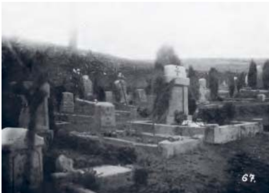
86'ernes kirkegård i Kirchofsmulde ved Moulin-sous-Touvent.