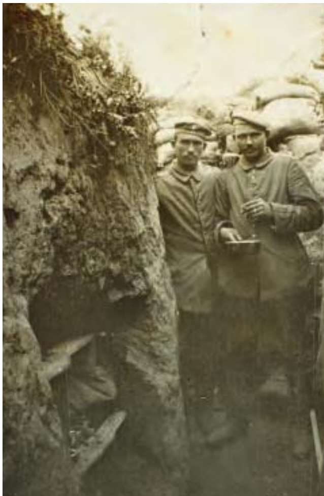
Indgang til sape nr. 24 i forreste linje ved Moulin, foråret 1915.

skyts, hvis batterierne var fuldtallige, og det tyder udkastet til den første angrebsplan fra april på, at de var. 14