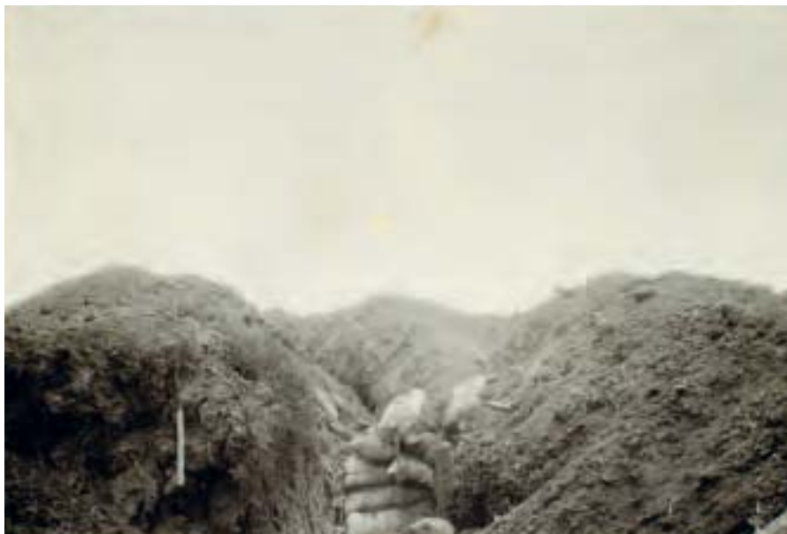
Indgangen til sape nr. 21 efter kampene ved Moulin i juni 1915.

ske soldater kravlede i begejstring op på skyttegravens kant og tilkende gav deres glæde over de franske kanoners virkning. 21