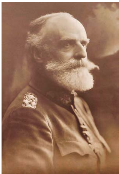
Den første øverstkommanderende for det tyske kystforsvar, den intellektuelle officer Ludwig von Falkenhausen, der i årene før krigen havde publiceret værker om hæruddannelse til krig. Falkenhausen var ansvarlig for etablering af kystkommandoen og for forberedelserne op til slutningen af august 1916.

kenhausen blev udpeget som chef. 69 Den pensionerede general var trådt tilbage i tjeneste ved krigens start og havde på trods af sin høje alder udmærket sig som operativ chef. Da han afgik fra sin kommando som kystforsvarschef i slutningen af august 1916, nærmede han sig sin 72-årsfødselsdag.