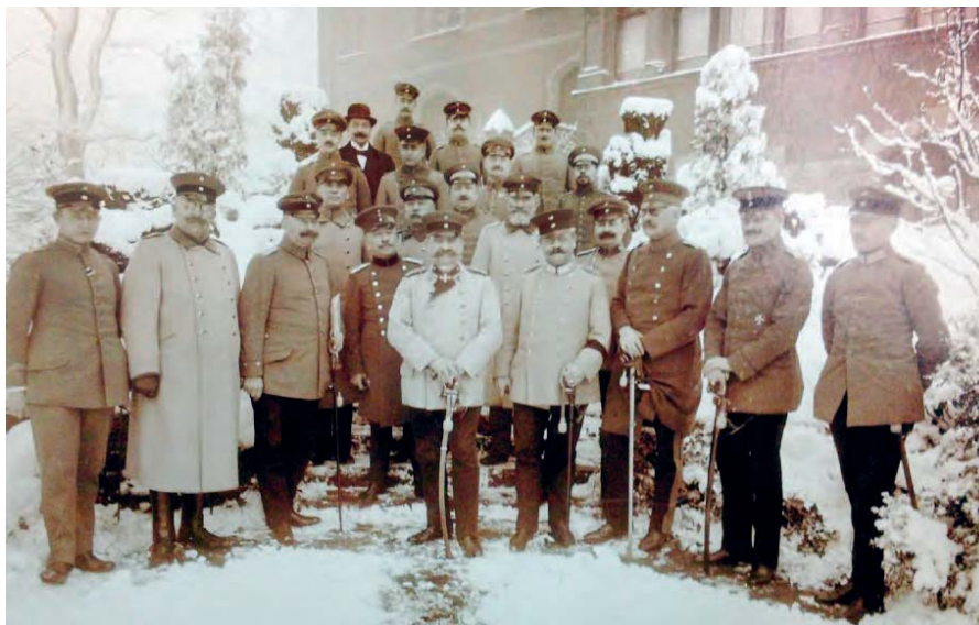
Von Roehl med landsdelskommandostaben i Altona. ( http://www.mopo.de/hamburg/ )

Landsdelskommandochefen i Slesvig-Holsten blev fra krigens start den da 61-årige Maximilian von Roehl, der i 1910 var blevet pensioneret med graden General der Artillerie, men som ved krigens start vendte tilbage til tjeneste i stillingen som landsdelskommandochef.