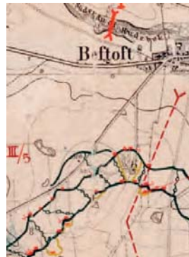
Luftfotografi fra Sikringsstilling Nord, der sandsynligvis er taget efteråret 1916. Det viser den næsten færdige forreste skyttegrav, et stykke af en fremskudt grav samt lidt af anden skyttegrav. Forbindelsesgravene kan kun anes. (Fotoet tilhører Johannes Bruchhof). Til højre kortudsnit visende samme stykke for forreste stillingslinje syd for Bevtoft. (Del af kort over skyttegravenes forløb mellem Gøttrup og Over Jerstal. Kortet tilhører Støtteforeningen for Sikringsstilling Nord)

øverste udøvende magt ( "vollziehenden Macht" ) i området. Dette sker ved erklæring af belejringstilstand, og myndigheden gik i første omgang til landsdelskommandoen. Det blev understreget, at fæstningskommandanter bevarede myndigheden inden for deres eget område. 86