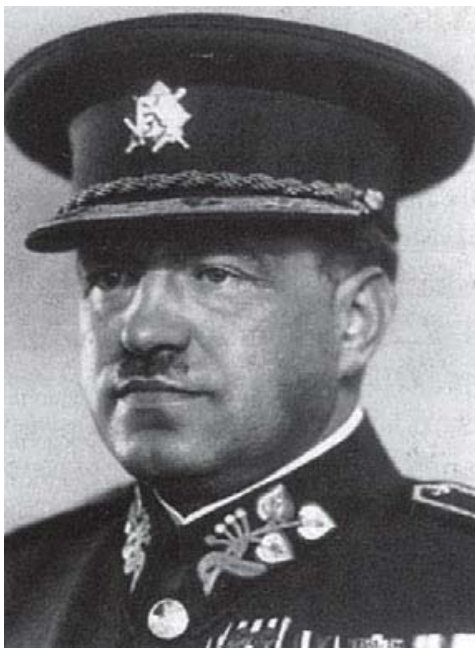
General Ludvík Krejčí, øverstbefalende for Hærens øverste operative hovedkvarter (HVOA). (Šrámek et al. (1998))

tre divisioner fra HVOA's reserve forflyttet til Böhmen, så de kunne forstærke 1. Armé. 134