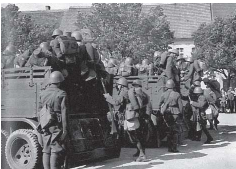
Tjekkoslavakiske soldater stiger om bord på ladet af Praga RV-lastvogne. Den tjekkoslavakiske hær havde en akut mangel på motorkøretøjer i både infanteriet og artilleriet. (Hamák & Vondrovský (2011))

Der var to årsager til den lave grad af motorisering. For det første havde de ansvarlige embedsfolk i Forsvarsministeriet et forældet og amatøragtigt syn på motorkøretøjer og de affødte behov. Det medførte til manglende standarder for vedligeholdelse af motorkøretøjerne. 101 En anden grund var Agrarpartiets (RSZML) økonomiske interesser. Et af partiets delorganisationer, Forbundet for Provinssielle Sammenslutninger af Hesteopdrættere ( Ústřední svaz zemských sdružení chovatelů koní ), solgte fuldblodsheste til hæren og var derfor imod en omfattende motorisering. 102