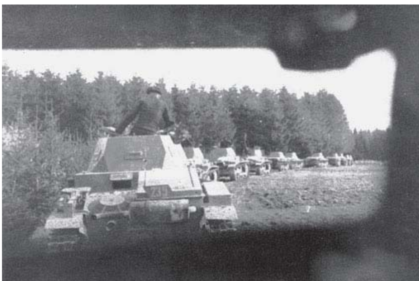
Tyske kampvogne tilhørende 2. Panzer-Division under manøvrer i det nordlige Østrig i september 1938.

på besøg i Paris i april 1938, fortalte han den franske forsvarschef general Gamelin, at Tjekkoslavakiet ville kunne holde stand i en måned uden assistance. 162 Den tjekkoslovakiske generalstabschef, general Krejčí, fortalte den 21. september præsident Beneš, at hæren kun kunne holde stand i omkring tre uger. 163