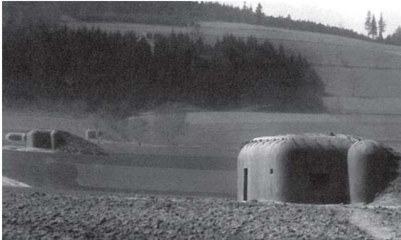
En forsvarslinje af lette befæstningsværker af typen LO vz. 37. (Procházka & Bílek (red.) (1987))