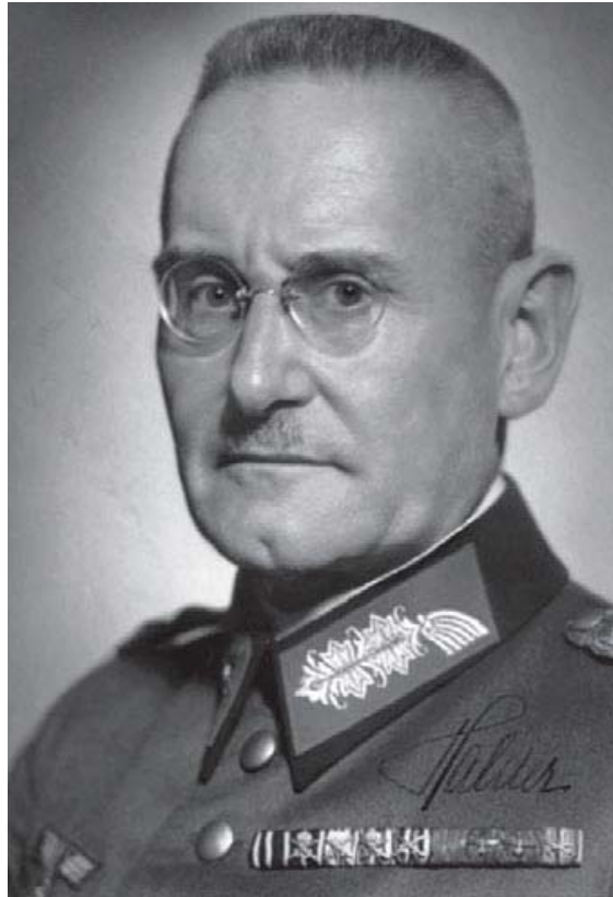
Oberst Alfred Jodl (venstre) og OKW's operative stab udformede planen, som blev præsenteret for Hitler den 20. maj 1938, mens OKH's generalstab under ledelse af general Franz Halder (højre) udarbejdede den endelige angrebsplan.

Den 7. december 1937 fik "Fall Grün" forrang over "Fall Rot" og blev i den nye version af 21. december gjort til den indledende primære hovedoperation fra tidligere kun at have været en sekundær, forebyggende indsats. 65 Den 21. april 1938 fik Keitel og OKW ordre om at lave en ny variant af "Fall Grün", hvori Hitler for sig så et " blitzartigen Überfall " uden advarsel og uden diplomatisk begrundelse. 66 OKW's operative stab, under oberst Alfred Jodl, udformede planen, som blev præsenteret for Hitler af Keitel den 20. maj. OKW's plan var blevet udarbejdet parallelt med OKH's planlægning og uden hærens generalstabs kendskab. 67 Den 28. maj – efter afslutningen på Majkrisen – var Hitler fast besluttet på at gå i krig mod Tjekkoslaviet. To dage senere underskrev Hitler det reviderede direktiv for "Fall Grün", og i et følgebrev fastsatte Keitel den 1. oktober som fristen for begyndelsen for angrebet. 68