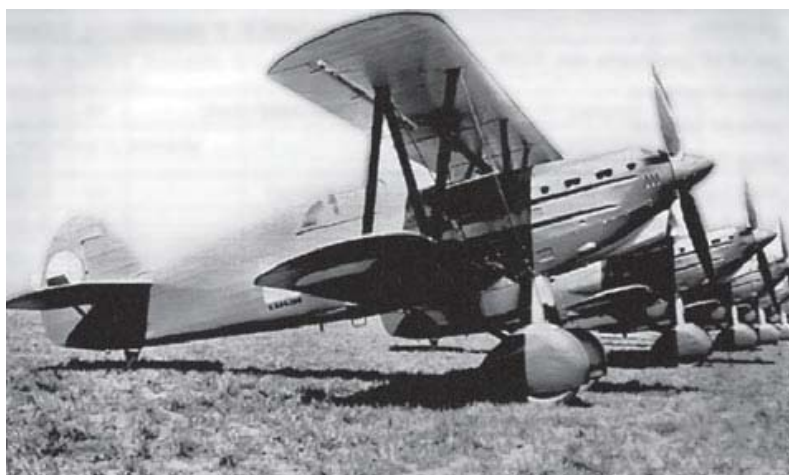
Avia B-534-jagerfly. (Hamák & Vondrovský (2011))

Det mest moderne bombefly i det tjekkoslovakiske luftvåben var Avia B-71. Det var reelt det sovjetiske Tupolev SB-2-bombefly og var blevet leveret i foråret 1938 (Hamák & Vondrovský (2011)).