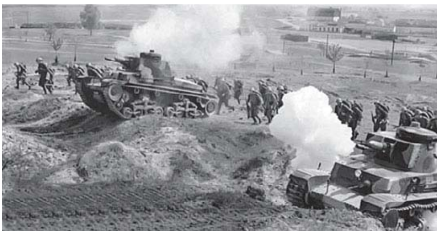
Tjekkoslavakisk infanteri rykker frem sammen med LT vz. 35-kampvogne under en øvelse i Milovice i 1938. (Šrámek et al. (1998))

LT vz. 35 var den tjekkoslavakiske hærs hovedkampvogn. Den var med sin pansring (8-25 mm) og bevæbning (en 37 mm kanon og to maskingeværer) klart bedre end både Pz.I og II og jævnbyrdig med Pz.III. Ud over de 298 vogne allerede leveret til hæren lavede hæren en hastebestilling på 105 vogne den 24. september 1938, da de frygtede, at de nye LT vz. 38-kampvogne ikke ville blive produceret i tide til et tysk angreb. 106