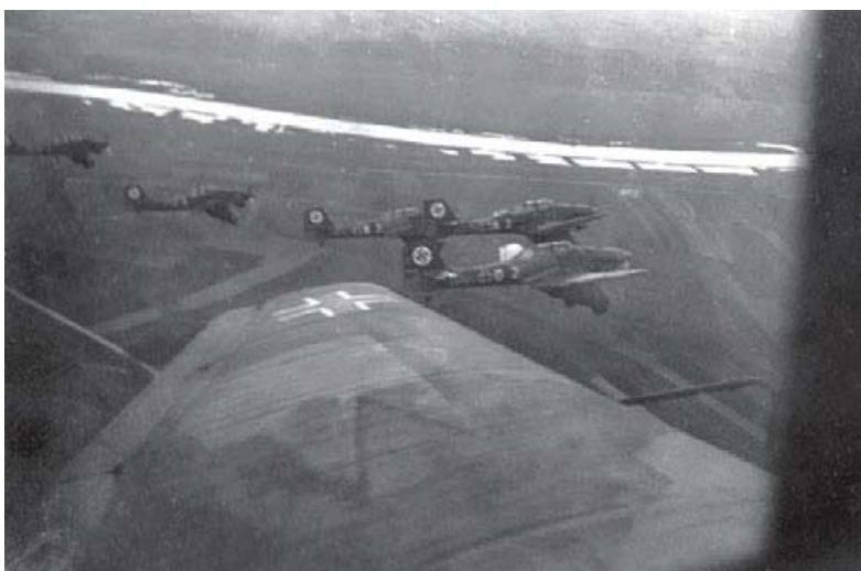
Junkers Ju 87-styrtbombefly over det sydlige Böhmen i oktober 1938. Dårligt vejr ville reducere flyaktiviteten fra både tysk og tjekkoslovakisk side i tilfælde af et krigsudbrud. ( http://technet.idnes.cz/utok-na-trebon-0pf-/vojenstvi.aspx?c=A140214_125319_vojenstvi_nyv . (25-10-2016))

toren i de sydlige Mähren kun havde en dybde på 100-150 m (til sammenligning havde Maginot-linjen en gennemsnitlig dybde på to-tre km og stedvist op mod 11 km). 142 Tyskerne havde desuden gode efterretninger om bunkernes placeringer, dels ved spionagevirksomhed af sudetertyskere og dels på grund af, at mange af bunkerne kunne ses fra grænsen. 143 En rapport fra 10. infanteridivision, som rykkede ind i det vestlige Böhmen med 10. Armé, konkluderede, at de tjekkoslovakiske befæstningslinjer kunne gennemtrænges på forholdsvis kort tid ved at udnytte bunkernes blinde vinkler, anvendelse af røgslør eller natangreb. 144 Tyskerne var bekymrede for deres artilleris effektivitet mod de sådanne befæstninger, og de gennemførte derfor skydning mod bunkerne efter indlemmelsen af Sudeterlandet i oktober 1938. Disse forsøg viste, at bunkerne på trods af kvaliteten af beton og konstruktion var sårbare ved granattræffere fra 155 mm felthaubits og 88 mm Flak 36-luftværnskanon (som senere i krigen med stor succes også blev anvendt som panserværnskanon). Effekten af træffere af 105 mm-granater fra lette haubitser varierede fra begrænset til forholdsvis god, mens skud fra 37 mm panserværnskanoner skulle rettes mod bunkernes skydeskår for dermed at gøre bunkerne ubrugelige. 145