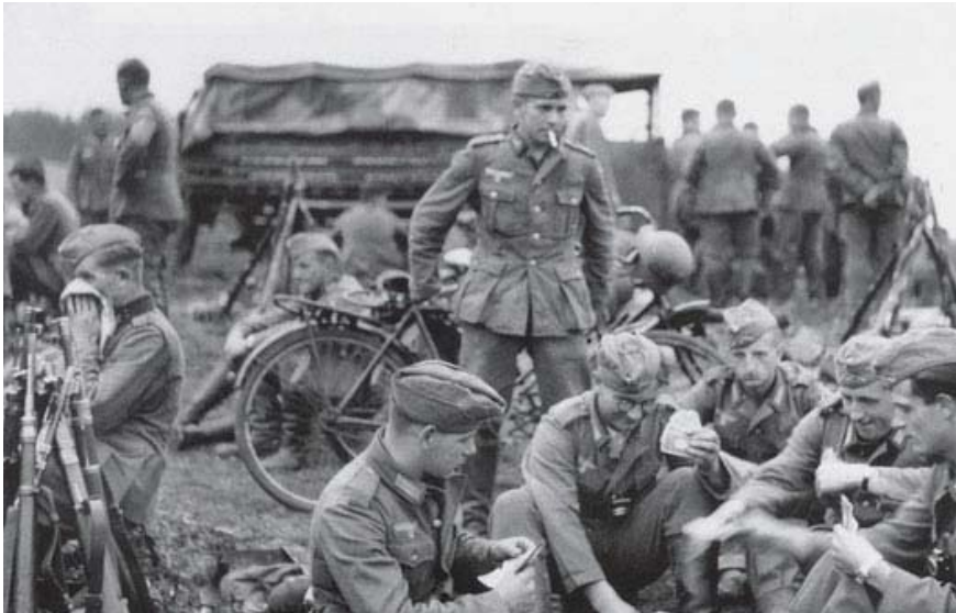
Soldater fra Infanterie-Regiment 61 (tilhørende 7. Infanterie-Division) fordriver tiden med kortspil, mens de afventer angrebsordrene, september 1938. (Lakosil (2014))

Herudover havde hæren otte reservedivisioner, 21 Landwehrdivisioner og yderligere 20 reservedivisioner, der var en del af Ersatzhæren. Dette betød, at felthæren i tilfælde af mobilisering blev udvidet fra 75 divisioner og to brigader til 95 divisioner og to brigader. Herudover fandtes 17 grænsevagts- og fæstningskommandoer med en samlet styrke på omkring 50 infanteriregimenter. 42