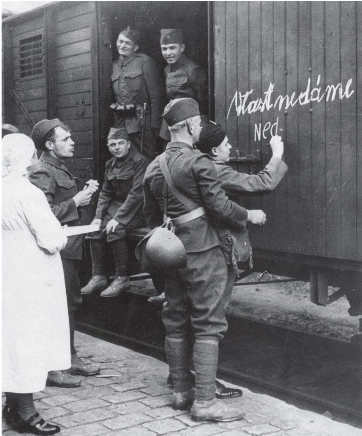
Tjekkoslavakiske soldater under generalmobiliseringen i slutningen af september 1938. (Kvaček & Heyduk (2011))

Den eskalerende krise begyndte nu at tage en militær drejning. Nyheden om de tjekkoslavakiske og tyske militære forberedelser samt Godesberg-memorandummet fik den franske regering med den franske generalstabschef general Maurice Gamelin til at iværksætte en delmobilisering af landets hær den 24. og 26. september. Sovjetunionen havde allerede gennemført en delvis mobilisering mellem den 21. og 24. september. 36