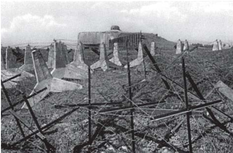
Det tunge befæstningsværk MO-S 16 ved Ostrava. (Šrámek (1996))

var kun seks tunge befæstninger blevet bygget. Yderligere otte tunge befæstninger var bygget ved Bratislava og tre ved Komárno. 119