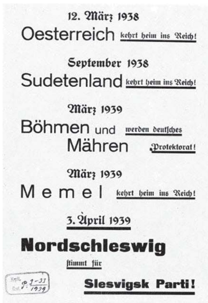
Løbeseddel fra Slesvigsk Parti under valgkampen i 1939 med krav om grænserevision.

NSDAP-Nordschleswig blev oprettet under pres fra politikere i Slesvig-Holsten. 29 Føreren af NSDAP-N, Jens Møller, blev valgt ved folketingsvalget 3. april 1939 og kom ind i Folketinget med 15.016 stemmer svarende til 15,9 % af de afgivne stemmer i Nordslesvig. 30 Sudeterlandet var i september 1938 blevet indlemmet i Tyskland, og i marts 1939 blev Bøhmen og Mähren gjort til et tysk protektorat. Samtidig vendte også Memel, det litauiske kystområde, "hjem til riget". At grænserevisionen var et centralt emne for mindretallet, understreges af, at Jens Møller før Folketingsvalget anvendte slogans som "Wir wollen heim ins Reich" og "Führer mach uns frei". Mindretallets ledelse blev dog gentagne gange af Berlin forpligtet til at være tilbageholdende i spørgsmålet om grænserevision. 31