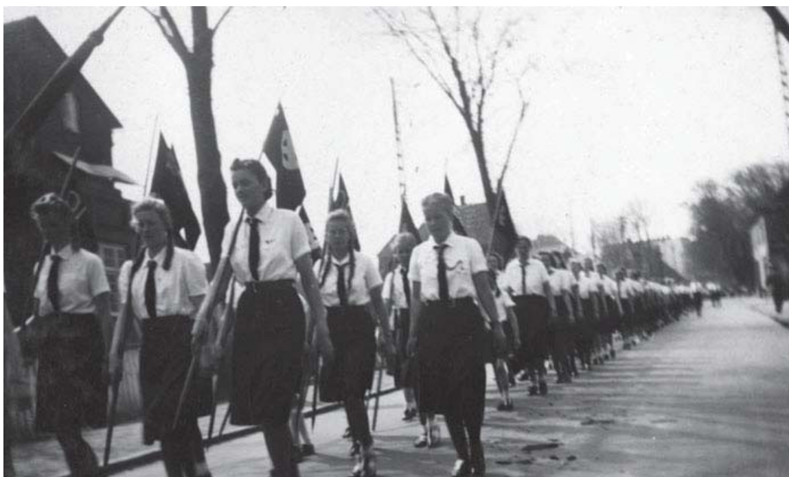
Deutsche Mädchenschaft Nordschleswig marcherer på Ribevej, ca. 1942.