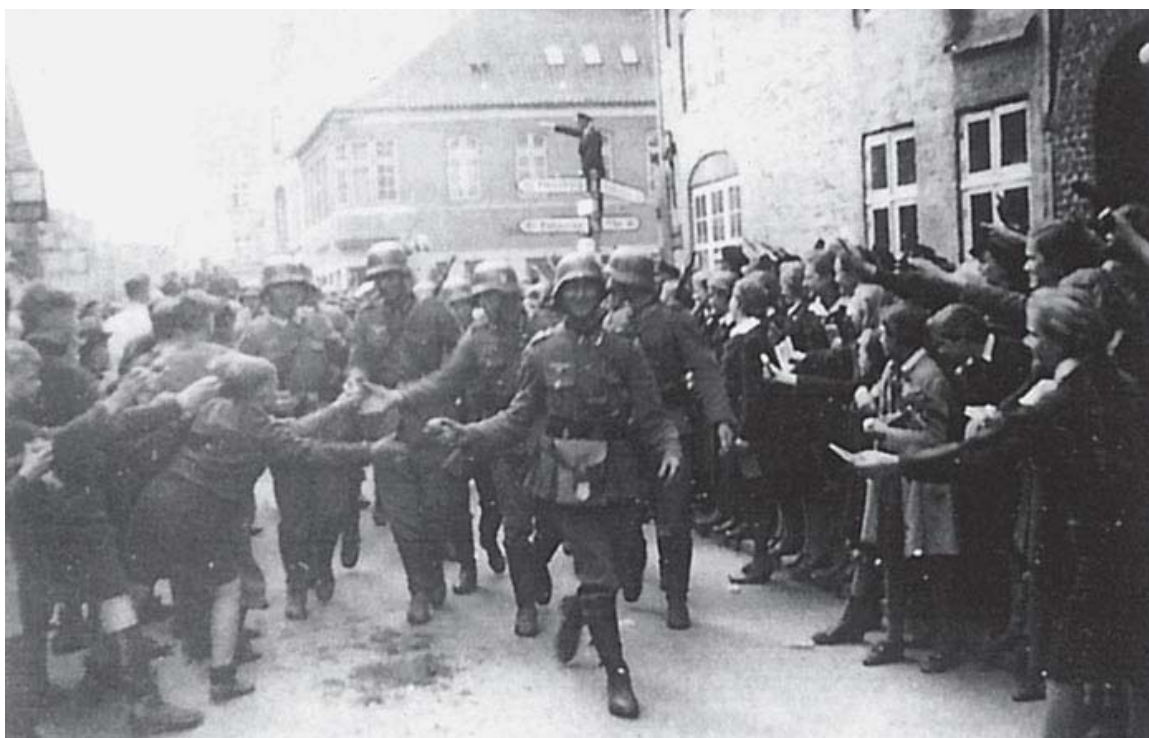
Tyske tropper modtages som befriere i Tønder 9. april 1940.