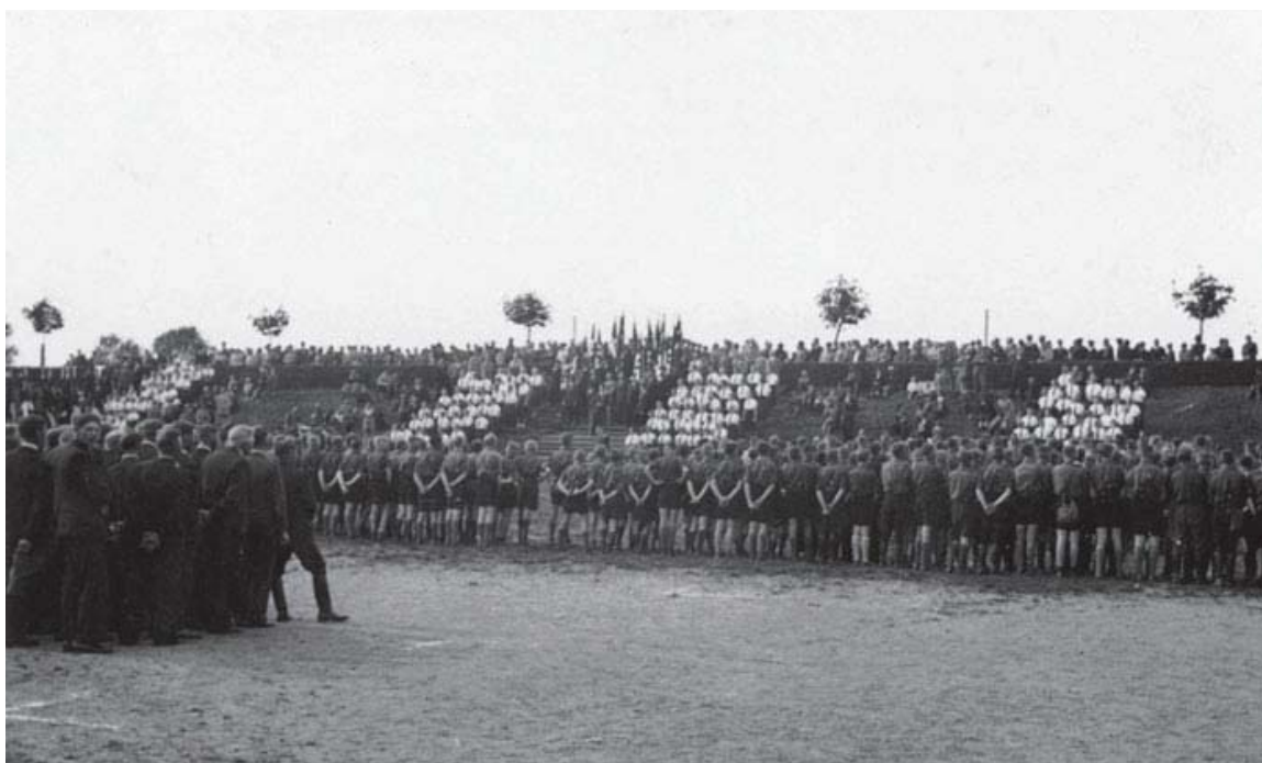
NSAP-N-partidag i Haderslev, 21. maj 1939.

Der blev fra mindretallets side givet tilsagn om, at det ønskede at medvirke, men at man samtidig havde nogle betænkeligheder. 84