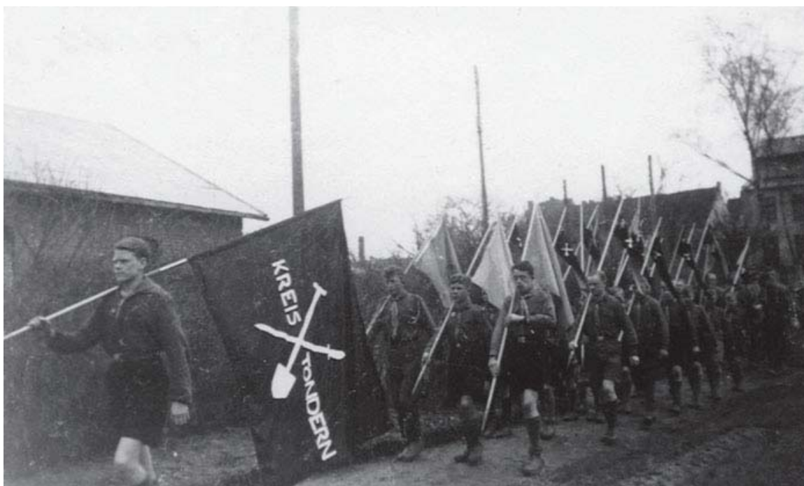
Deutsche Jungenschaft, Kreis Tondern, ca. 1942.

dringsværk 77 sine egne oplevelser under nazificeringen af mindretallet og Verdenskrigen. Han skriver bl.a., at “Skolens gruppenormer krævede, at man blev medlem af Deutschen Jungenschaft Nordschleswig (DJN), og det lød da også forlokkende. Drengen der drømmer om lejrliv, fællesskab og aftenlig sang foran telte ved bålet. Skolekammeraterne var allerede med og prikkede med misundelsen.” 78