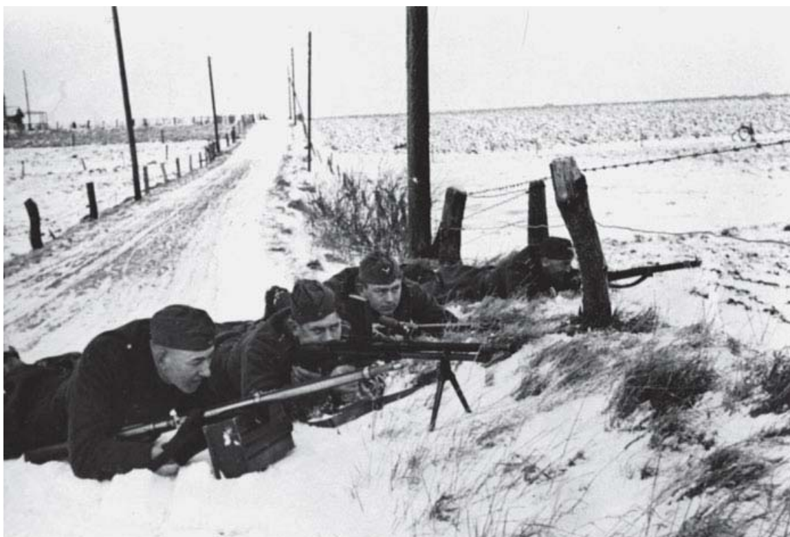
Zeitfreiwillige (tidsfrivillige) under feltøvelse ved Tinglev i vinteren 1944-45. Den hjemmetyske fotograf Rudolf Gimm har givet sit foto denne tekst: "Maskingeværet er bragt i stilling". Våbnene er i øvrigt erobrede, ikke-tyske.

af den opfattelse, at en fornyet offentlig hvervekampagne ikke ville bringe meget succes. Jens Møllers direkte bidrag til hvervningen blev derfor også begrænset til et brev til de unge årgange samt en opfordring på et møde i Tinglev om at melde sig som frivillig. 210