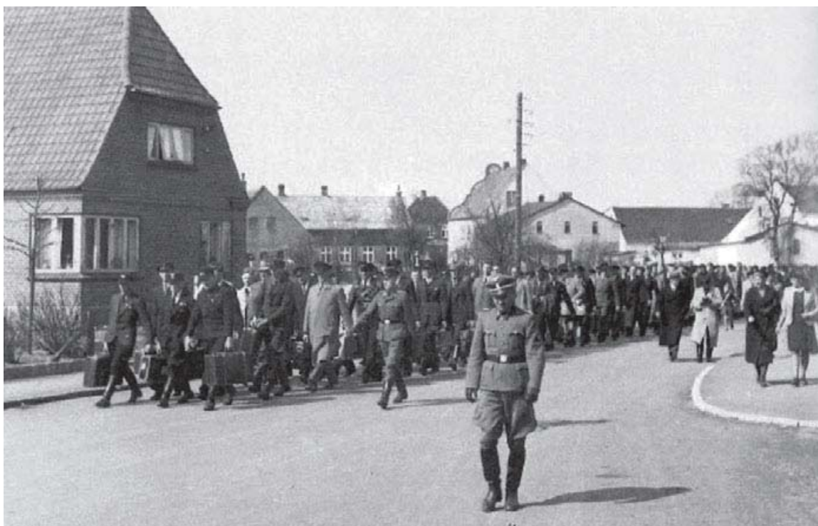
200 hjemmetyske krigsfrivillige på vej til Tinglev banegård 22. april 1942.