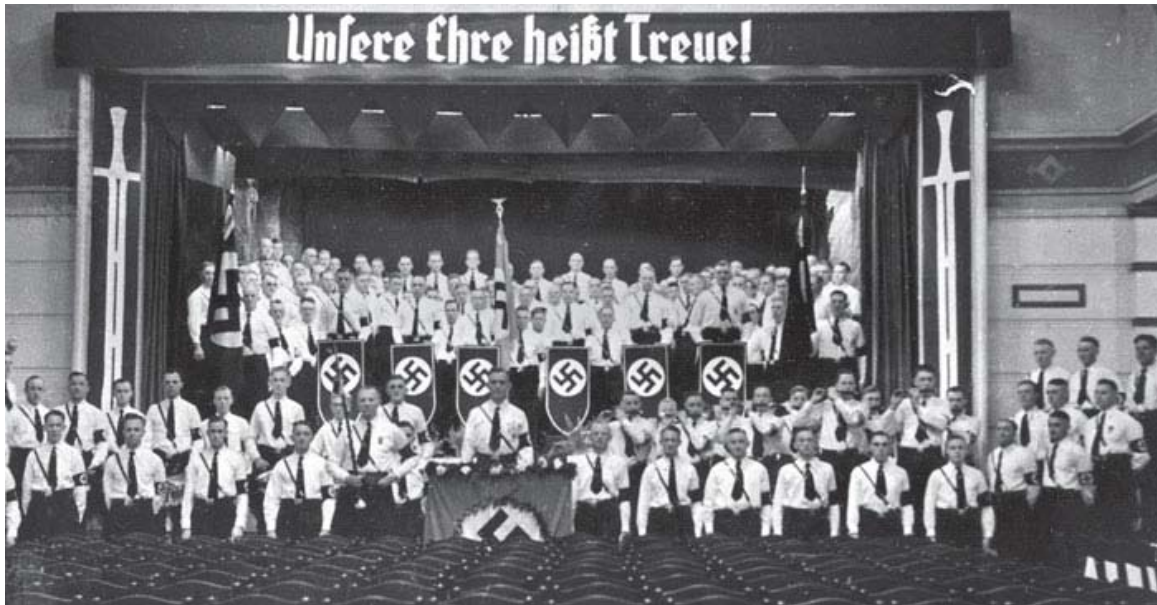
Det paramilitære korps SK i Sønderborg på Haus Adalbert i Sønderborg i 1941.