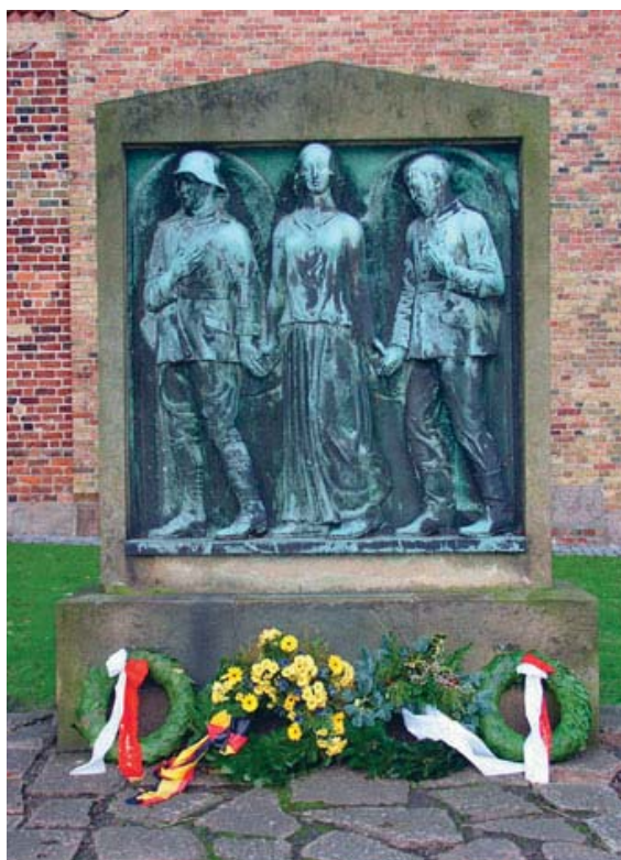
Eksempler på de nationalt neutrale monumenter, der blev opstillet efter 1. Verdenskrig i Sønderjylland. Til venstre fra Sønderborg (kun med navne på byens 192 faldne), til højre fra Aabenraa (en engel der holder hånd med en tysksindet og en dansksindet sønderjyde, henholdsvis med og uden stålhelmet).

samt en erindringsmedalje. 62 Mens veteranerne fra Første Verdenskrig i sagens natur i høj grad var et regionalt fænomen med en betydelig mindekultur syd for Kongeåen, fik denne gruppe veteraner dog også national anerkendelse i form at det store monument over faldne i verdenskrigen i Mindeparken ved Marselisborg ved Århus, hvor 4.000 dansksindede nordslesvigeres navne står side om side med 140 danskere som faldt på allieret side. Dertil kom den indirekte statslige anerkendelse, som lå i, at den danske stat ved genforeningen påtog sig ansvaret for et tilkønde og udbetale krigsskade pensioner. 63