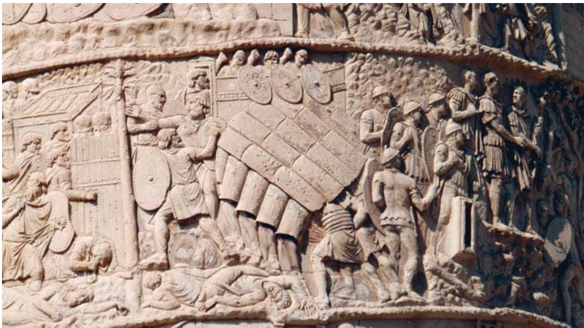
Fra Trajansøjlen: Romerske veteranlegionærer i kamp ( http://jjwargames.blogspot.dk/2014_04_01_archive.html )

Denne artikel vil med udgangspunkt i Danmarks krigsveteraner fra 1848 og til i dag forholde sig til disse spørgsmål; ikke for at give et endegyldigt facit, men for at stimulere til øget forskning og refleksion over de danske krigsveteraners historie og interaktion med det danske samfund i perioden.