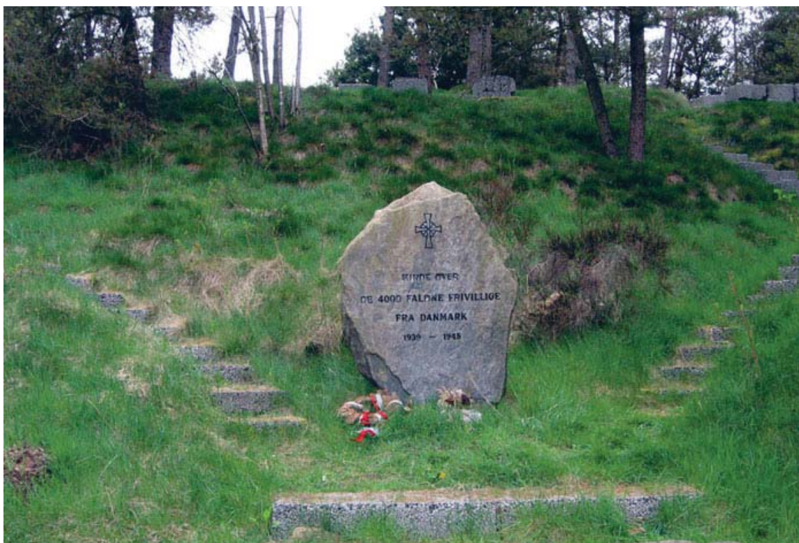
Fra mindelunden ved Gudenåen for danske frivillige i tysk tjeneste. ( https://commons.wikimedia.org/wiki/Category:F%C3%A6llesskabets_Mindelund_af_1969#/media/File:F%C3%A6llesskabets-Mindelund-2.jpg )

svar – at det ikke ville komme til en omstødelse af dommene over de tidligere SS-mænd eller nogen anden forsonende offentlig gestus. 73