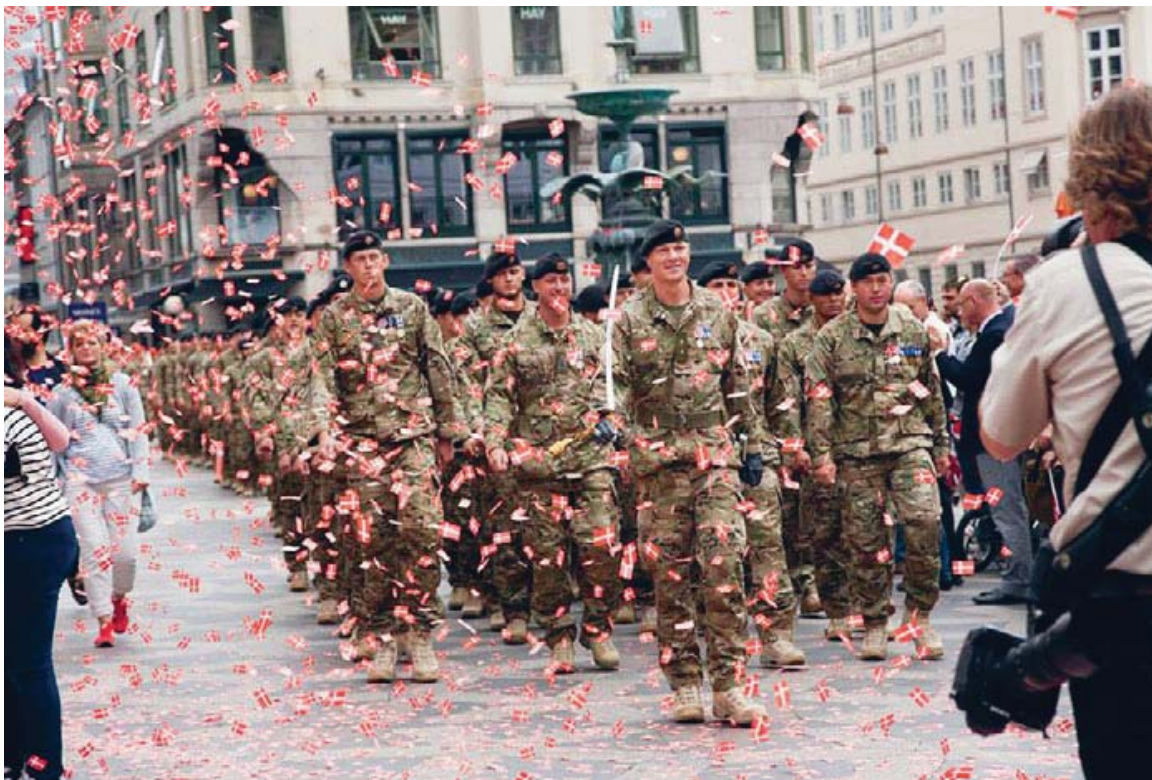
Fra Flagdagsparaden 5. september 2015 på Strøget i København.

des er et privat initiativ, der gennem fundraising giver økonomiske bidrag til sårede britiske soldater. Også en række andre foreninger er opstået, som arbejder med understøttelse af veteraner og deres pårørende, såsom Foreningen Familienetværket. Foreningen finansieres blandt andet gennem salg af den kendte gule sløjfe "Støt vores soldater", og dens overskud går til veteranrelaterede aktiviteter.