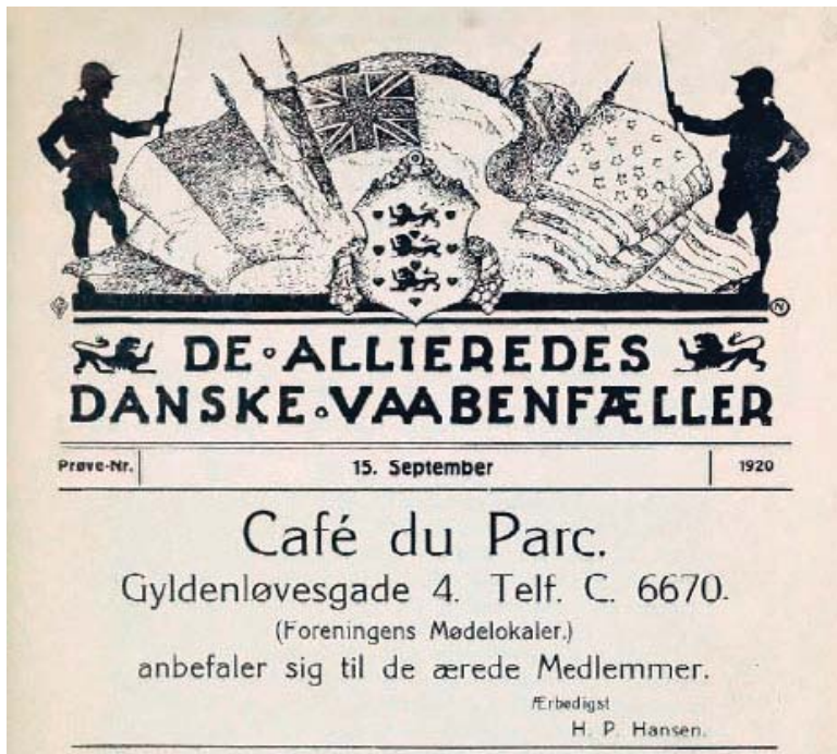
Invitation til arrangement i "De Allieredes Danske Vaabenfæller".

De i Danmark værende veteraner fra den tyske kejserlige hær under Første Verdenskrig synes konsekvent at have brugt betegnelsen krigsdeltagere om sig selv – et udtryk som også de offentlige myndigheder og fonde, som kom i kontakt med veteranerne i forbindelse med pensions- og velfærdsspørgsmål, også synes at have benyttet. 94 Udtrykket veteran optræder stort set ikke i DSK's årsskrift – DSK årbog – og de sjældne gange det benyttes, kobler det sig næsten altid til udenlandske grupper. 95 Heller ikke en anden gruppe af veteraner fra Første Verdenskrig tog begrebet til sig: Da en mindre gruppe tidligere frivillige fra de allierede hære i sommeren 1920 stiftede en veteranforening, fik den navnet De Allieredes Danske Vaabenfæller. 96