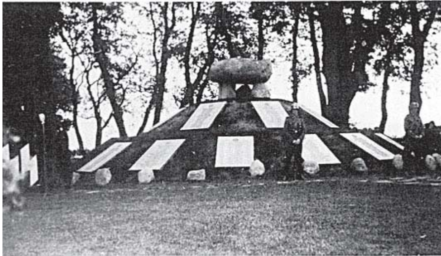
Det oprindelige monument fra 1944 for de dræbte danske østfrontsfrivillige ved Høveltegård. ( https://tidsskrift.dk/index.php/fundogforskning/article/view/1295/2070 )