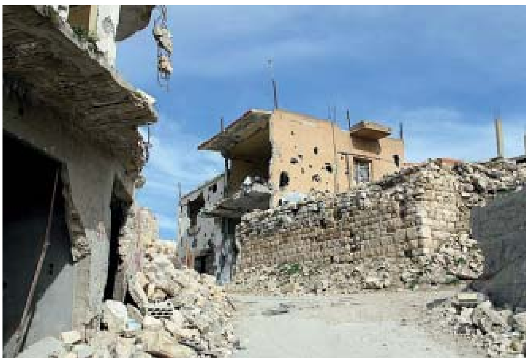
Från ödeläggelsen av den sydlibanesiska byn Bint J'Bayel.

tilläggas att Hizbollah också använde klusterammunition i sin beskjutning av Israel).