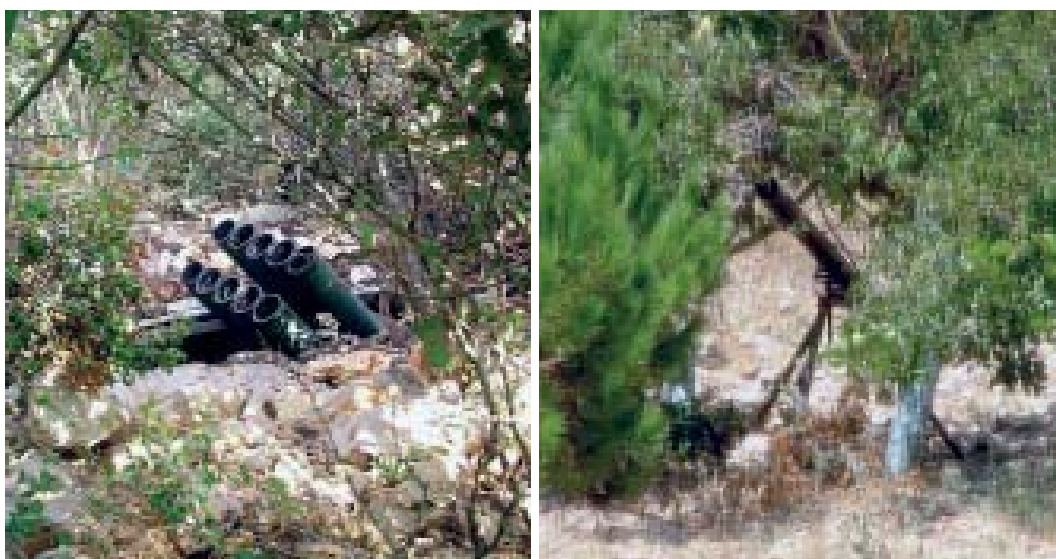
Hizbollahs korträckviddiga robotar invid gränsen var inte lätta för flygstridskrafterna att i tid lokalisera och bekämpa.

till 100 km. Senare fick Hizbollah via Syrien även iransktillverkade Fadjr - and Zelzal -raketer – kopior av sovjetiska medel- och långdistansraketer med kalibrar på mellan 240 och 600 mm och räckvidder på upp till 250 km. Därigenom kunde Hizbollah utsätta alla större städer i Israel för beskjutning. Den tyngsta raketerna, Zelzal-2 , hade en sprängladdning på 500 kg (medan fadjr är ordet för gryning, betyder zelzal "jordbävning" på farsi). I tillägg förfogade Hizbollah över kinesiska, i Iran producerade C 802-sjömålsrobotar, samt UAV:er av typ Ababil . 16