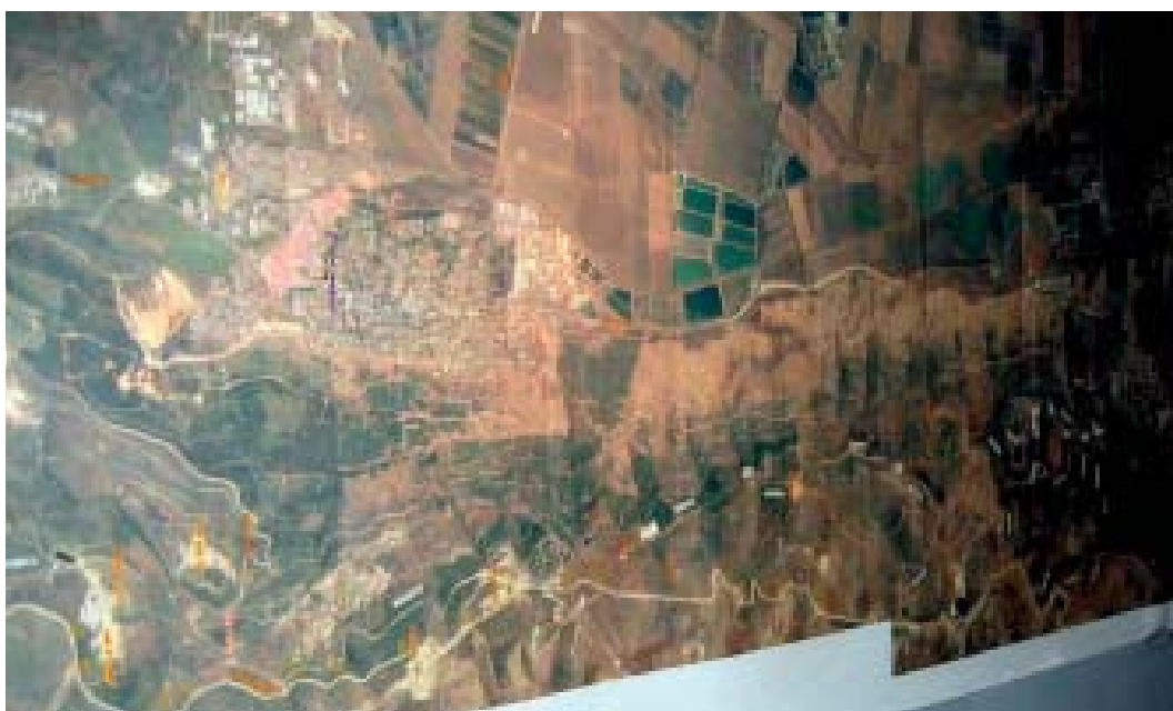
Hizbollah var väl förberedda. Här är en av israelerna erövrade karta sammansatt af flygfotografier, där identifierade israeliska ställningar finns utsatta.