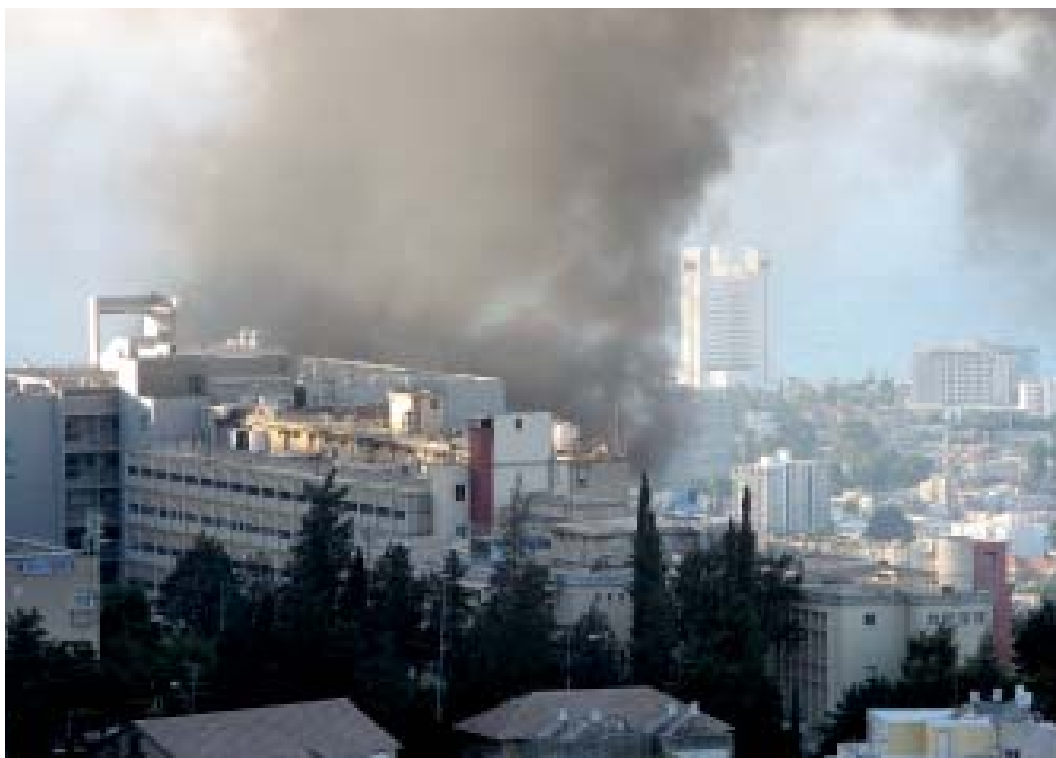
Haifa träffas av Hizbollah-raketer på krigets sista dag.

liksom landets största oljeraffinaderi i staden. Slutligen orsakade raketbeskjutningen hundratals skogs- och gräsbränder.