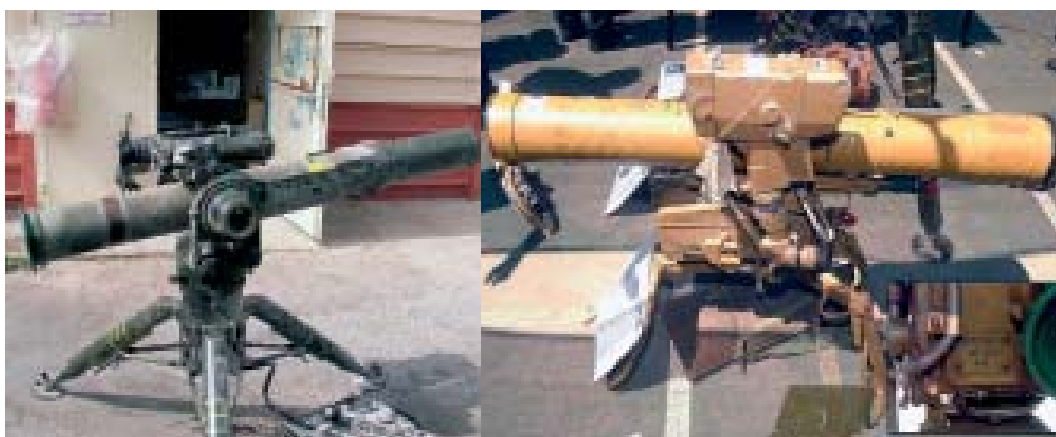
Hizbollah-panservärnssystem erövrade av den israeliska armén 2006, till vänster TOW och till höger Kornet.