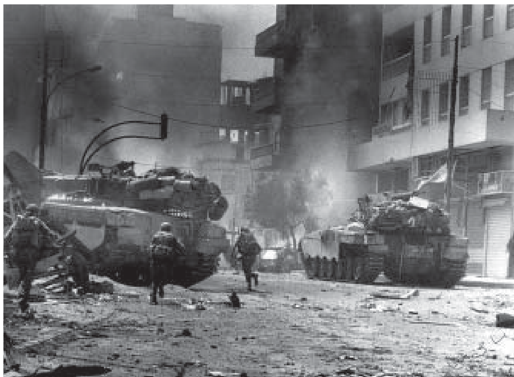
Från den israeliska arméns strider i Beirut 1982 under Operation Fred åt Galliléen , som var Israels senaste större operation vid tidpunkten för Libanonkriget 24 år senare.