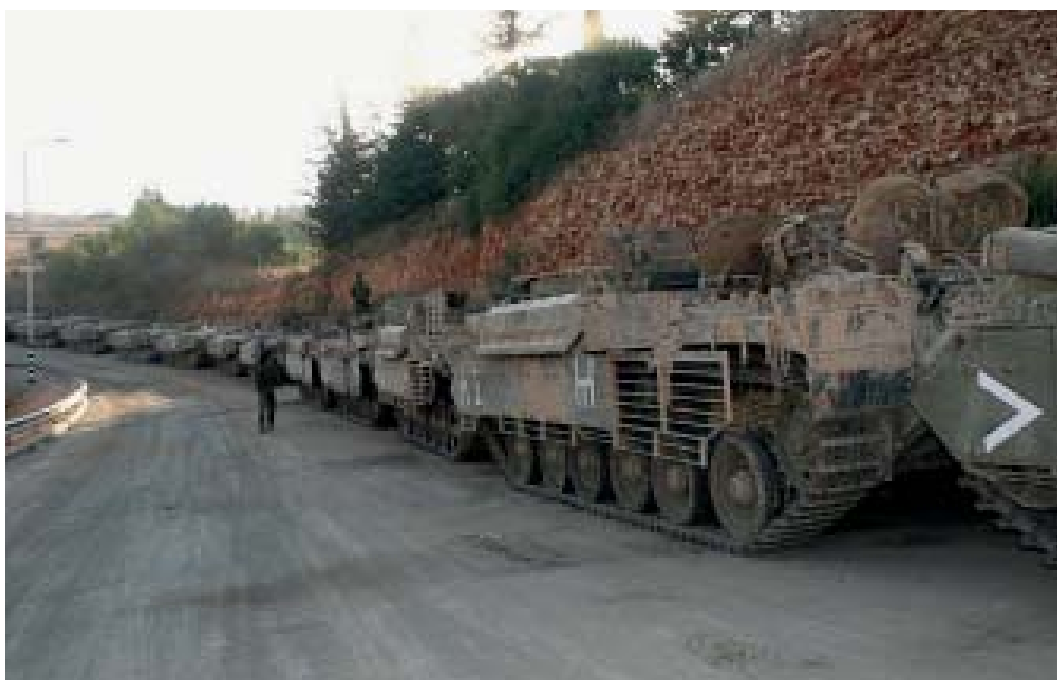
En kolonn tunga pansarskyttefordon, baserade på Centurionstridsvagnar, redo för offensiv in i Libanon.

utsträckning man inte var van vid från tidigare krig. Israels omställning till den nya tidens konflikter hade fått konsekvenser på många områden. 36