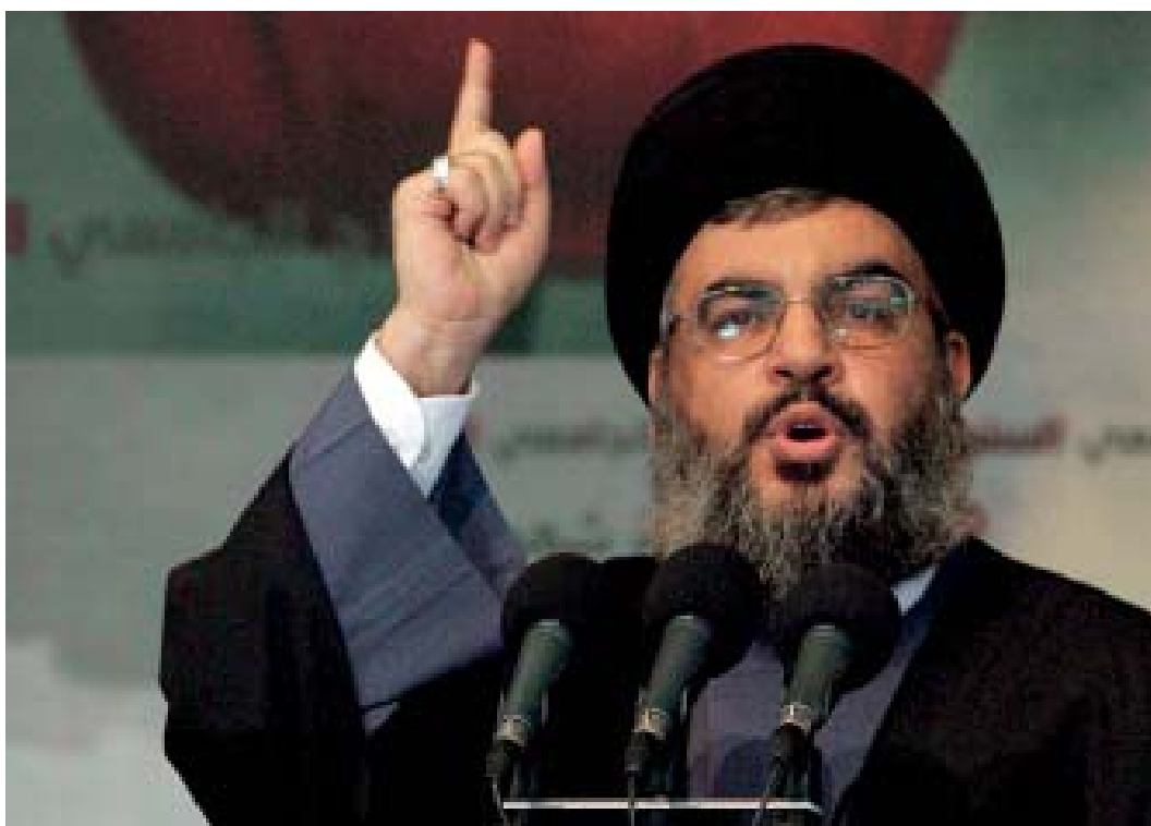
Israels politiska huvudmotståndare 2006, Hizbollahs dynamiska generalsekreterare Sayyed Hassan Nasrallah.

soldater – för att de vägrat inställa sig vid mobilisering. Sedan Israels libanesiska bundsförvanter i den kristna falangistmilisen massakrerat 700–800 palestinska civila i flyktinglägren Sabra och Shatila, uppstod dessutom en svårartad inrikespolitisk kris. En statlig undersökningskommission konstaterade att den israeliska regeringen bar en del av ansvaret för massakrerna och försvarsminister Ariel Sharon tvingades lämna sin post. 6 Händelserna 1982 förebådade därigenom i viss mening det som skulle äga rum 2006.