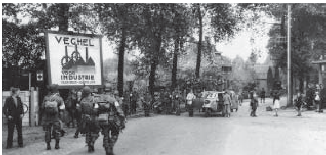
Soldater fra 501 PIR i Veghel efter landsætningen.