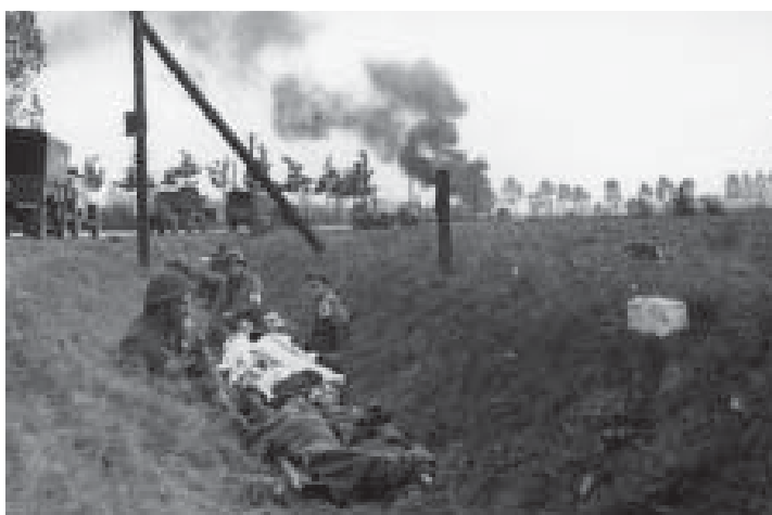
Fra hovedvejen ved Sint Oedenrode under kampene.