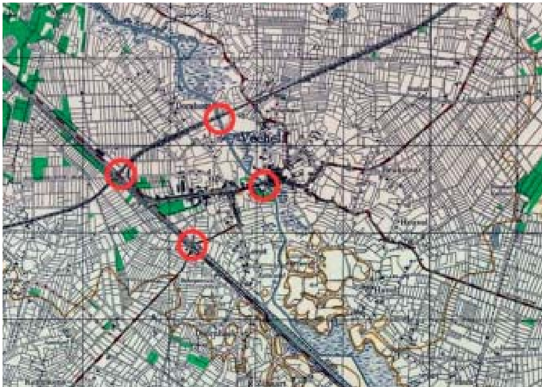
Samtidigt amerikansk 1:25.000 kort, hvor de fire broer er markeret. Bemærk forløbet af Aa-vandløbet syd- og sydøst for vejbroerne, der komplicerede den tyske udfoldelse af kampkraft 22.-23. september-

Løsningen af 501 PIR's opgaver indledtes med luftlandsætningen fra kl. 1300. 51 Nedkastningsområdet var placeret i nærhed af de indledende mål: to jernbanebroer og to vejbroer om Aa floden og Willemsvaart kanalen i Veghel. 52 Manøveren var planlagt som et dobbeltomfattende 53 angreb med I Bataljon (I/501) kommende fra nord og II/501 angribende fra syd. Det faktum, at I/501 PIR fejlagtigt landsattes godt 5 km vest for broerne synes ikke at have hæmmet den hastige erobring af målet væsentligt, da I og II Bataljon reelt mødtes i Veghel omkring 1700. 54 Målene var tydelige terrængenstande, og samtidig var hensigten ligeledes klar og entydig: Målet skulle tages så hurtigt som muligt og herefter holdes. 55 Den videre hensigt med kontrollen med målet var, at enheder fra XXX Korps derfra kunne angribe over Nijmegen og videre til Arnhem, der lå knap 50 km imod nord. Enheder fra 501 PIR skulle holde alle fire broer, indtil de blev afløst.