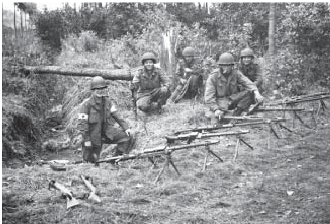
Krigsbytte, tyske MG34-maskingeværer, fra kampene ved Eerde den 24. september 1944. (liberationroute.com/pays-bas/lieu-historique/the-observation-posts-over-the-battlefield-at-eerde (23-1-2017))

På det lave taktiske niveau demonstrerede A-kompagniets modangreb ved Eerde igen offensivviljen og evnen til at tage initiativet. Godt nok i en lille målestok, en større styrke kunne åbenbart ikke udspares. 159 Kompagniangrebet viste, at 501 PIR ikke søgte at opnå målet om at holde vejen åben ved blot at reagere, men ved at agere aktivt. Enhederne valgte igen at optræde offensivt og trænge ind på tyske enheder i et uoverskueligt terræn fra en flankerende retning, og på den