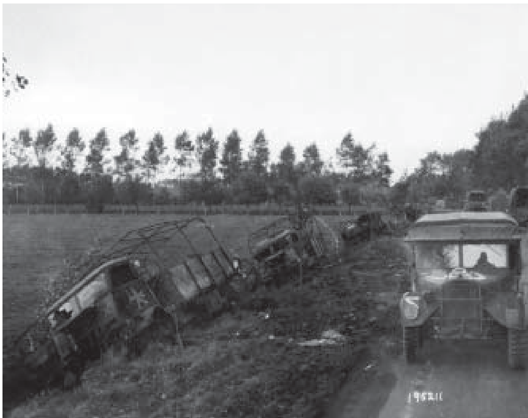
Den åbne hovedvej den 25. september 1944.

måde søgte de overraskelse gennem bevægelse. Taktisk set var kompagniangrebet en succes, da det bidrog til at standse for yderligere tyske forsøg på at trænge frem i mod jernbroerne fra vest. Regimentet kunne ikke forhindre angrebet syd for sit rum, ved Koeivering, og blev heller ikke involveret i kampene der.