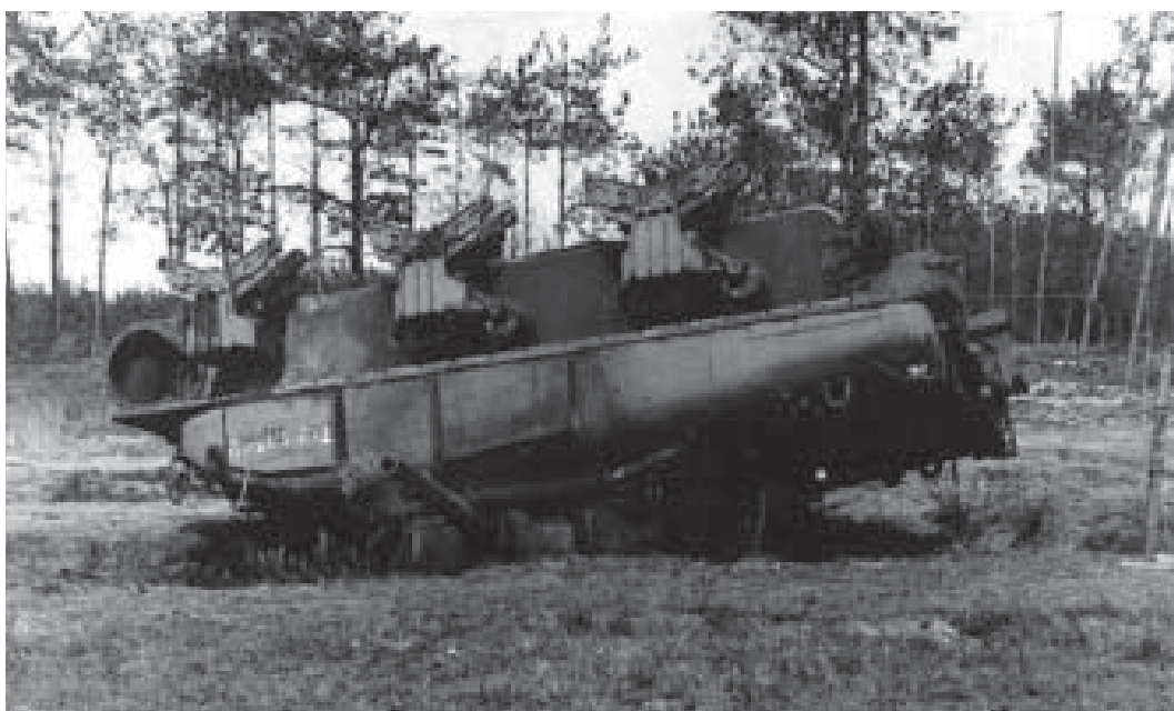
Tyskerne forblev en effektiv modstander. Her en britisk Sherman-kampvogn fra angrebet i Koeveringskoven mod Schijndel fra den 25. september. ( www.oudzijaart.nl/Kroniek/K1946.htm (23-1-2017))

blokere bevægelsen. Det måtte forventes over for en modstander, der normalt selv satsede på at dominere med aggressiv, bevægelig kamp.