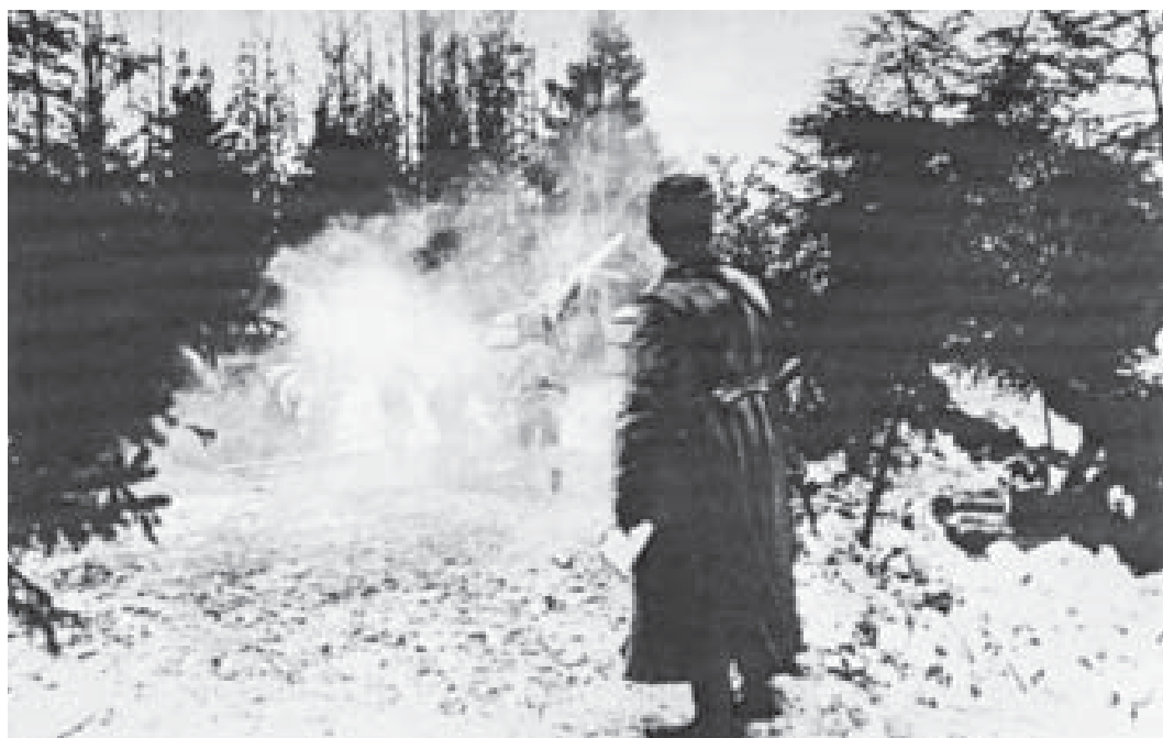
Tungt russisk artilleri under den mislykkede offensiv i marts 1916 ved Narotjsøen. (tumblr_ inline)

Eventuel frygt for, om det var klogt således at udtynke østfronten, blev umiddelbart gjort til skamme, da to russiske angreb med henholdsvis Sydvestfrontens 7. Arme i december 1915 og den russiske Vestfronts 2. Arme i marts 1916 begge fejlede. (En front var den russiske betegnelse for en armégruppe). Trods betydeligt koncentration af styrker og en – efter østfrontens målestok – massiv artilleriindsats, afvist angriberne af forsvarerne, uden at disse for alvor blev trængt. Således var det den tyske opfattelse, at den russiske 2. Arme i slaget ved Narotjsøen den 18.-24. marts mistede 110.000 mand mod tyskernes tab på 20.000.