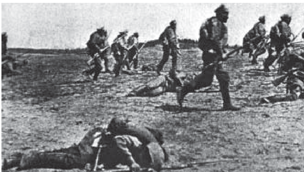
Russisk infanteri under offensiven.

ten før angrebet havde chefen for 4. Arme personligt aflagt flere af de enheder, der kort efter blev angrebet, et inspektionsbesøg. Han var tilfreds med stillingen og mandskabet, som han mente ville afvise ethvert angreb. 49 Henimod aften vurderede 4. Arme da også, at man fortsat var situationen voksen, og at forsvaret i det store og hele var gået ubeskadiget ud af den første dags kampe. 50