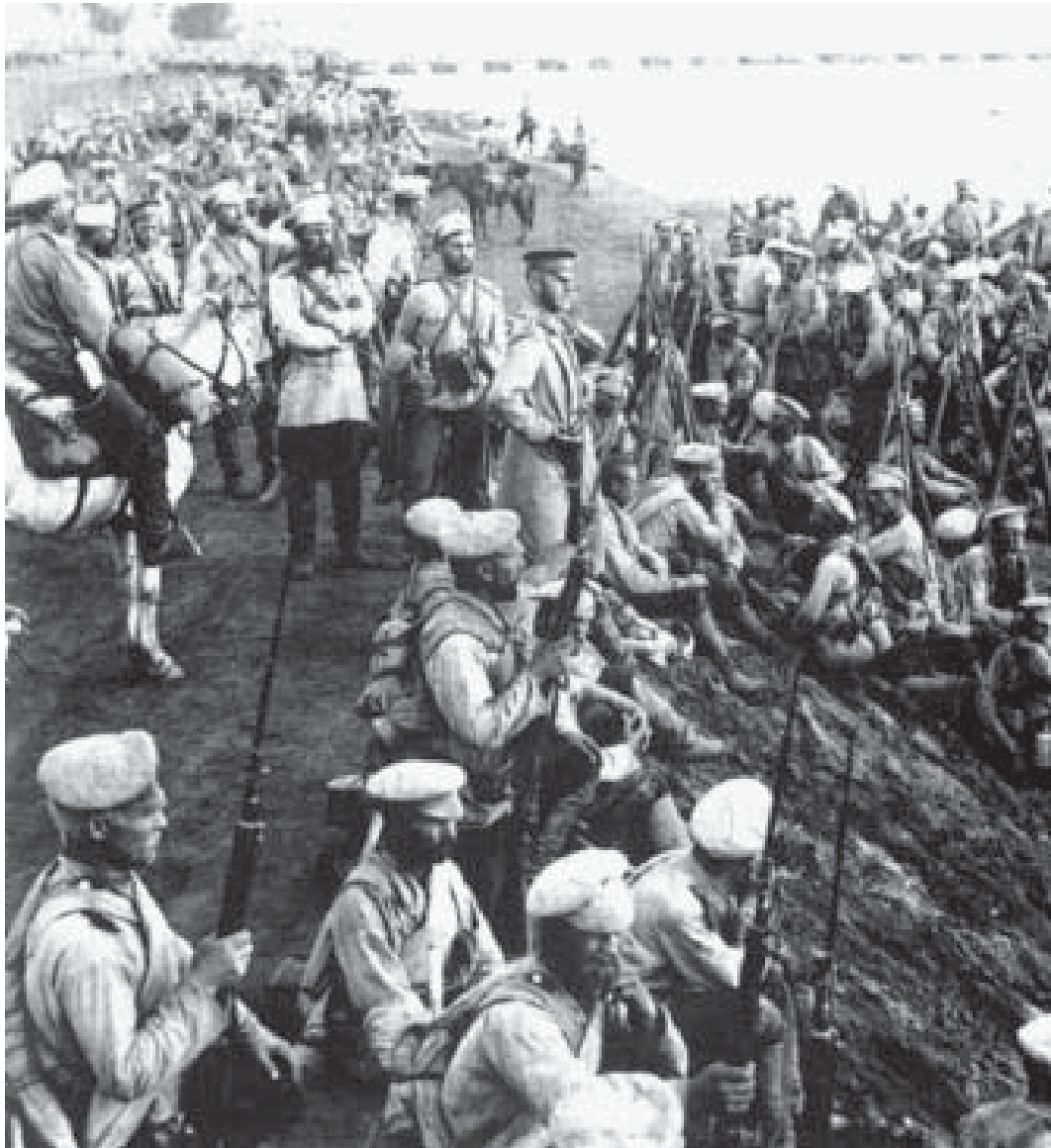
Russiske tropper ved start af offensiven.

Der var imidlertid fortsat betydelige strukturelle vanskeligheder i hæren. Den nye generalstabschef Alekseev var trods gode militære evner en forholdsvis svag chef og ikke i stand til for alvor at påtvinge hæren ny taktik eller afskedige eller forflytte adelige officerer med forbindelser til hoffet, hvis de viste sig udygtige i felten. Det lavere officerskorps var dog ved at undergå en betydelig transformation grundet de store tab. De medførte på den ene side en vis afprofessionalisering, idet mange medlemmer af det faste officerskorps faldt, men betød også, at mænd med en anden social baggrund og med større vilje til at udfordre hidtidige dogmer blev officerer. 26