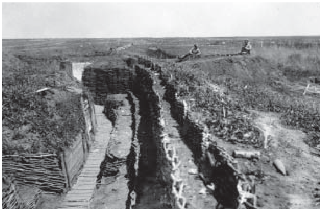
Russisk infanteri hviler i erobret østrig-ungarsk stilling i sommeren 1916.