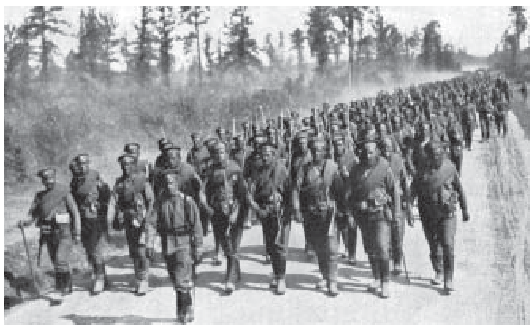
Russisk infanteri på march i sommeren 1916.

Den russiske hær var i 1916 på flere måder i en langt bedre form end i 1914-1915. Det var som nævnt lykkedes at tilvejebringe nyt mandskab i en grad, som kompenserede for tabene, og et stort antal nye officerer var blevet uddannet. Omkring to millioner mænd blev således mobiliseret i perioden fra juli 1915 til marts 1916, og de blev samtidig uddannet mere professionelt end tidligere, bl.a. i form af mere vægt på kamptræning, samt ved at indføre en indkøringsperiode ved rolige frontafsnit, før de blev sendt i kamp. 23 På materielsiden skete der en øget tildeling af tungere artilleri. Mens man i krigens første 1½ år havde lidt under stor mangel på granater, var der også her sket store forbedringer. 24 Produktionen af granater var 13.000 om dagen før krigsudbruddet, men nåede i løbet af 1915 op på 50.000, hvortil kom store leverancer fra Ruslands forbundsfæller. 25 Mange officerer blev udskiftet, herunder generalstabschefen, og det øgede generelt kvaliteten af krigsførelsen.