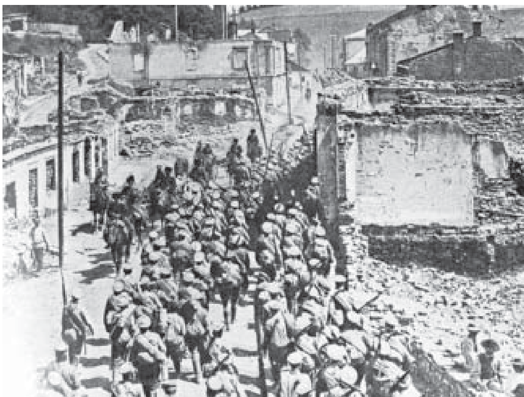
Russiske styrker rykker igennem ødelagt by.

Centralmagternes side var særdeles opmærksomme på, hvordan både Kovel og Lviv kunne blive truet af nye russiske angreb. Slutteligt havde også russerne lidt store tab, og de forstærkninger, som kom til fronten, var i almindelighed dårligere uddannet og ledet end de styrker, som Brusilov havde åbnet kampene med. 76