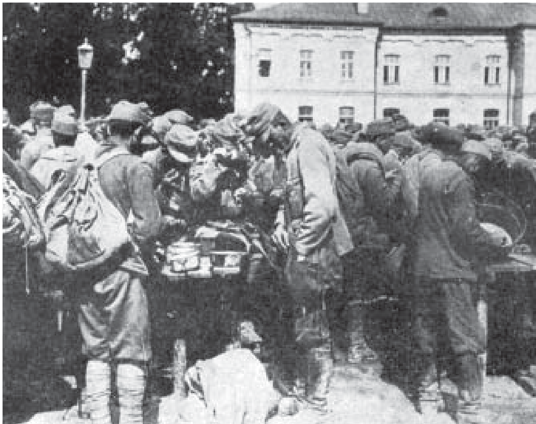
En gruppe af de hundredtusinder af østrig-ungarske krigsfanger.

tab hævder, at de beløb sig til over en million dræbte og sårede og mere end 400.000 fanger, mens et mere realistisk skøn er, at k.u.k. mistede mindst 700.000 mand under Brusilov-offensiven. 79 Dertil kom tabet af næsten 600 artilleripjecer, næsten 1.800 maskingeværer og 450 morterer. På tysk side opgjorde man sine tab til 85.000 faldne. 80 Russernes egne tab beløb sig til mellem 500.000 og 1 million dræbte, og de samlede tab henover sommeren nåede måske op på 2 millioner. 81