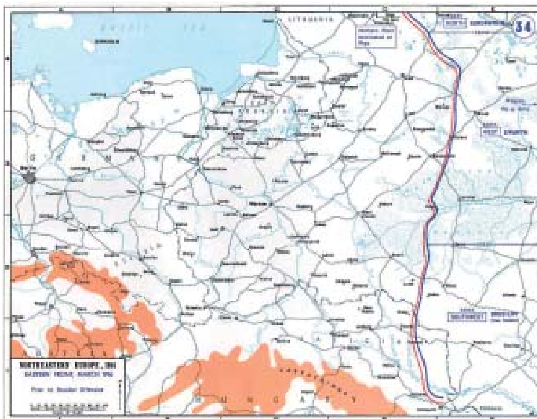
Østfronten i marts 1916. (West Point)