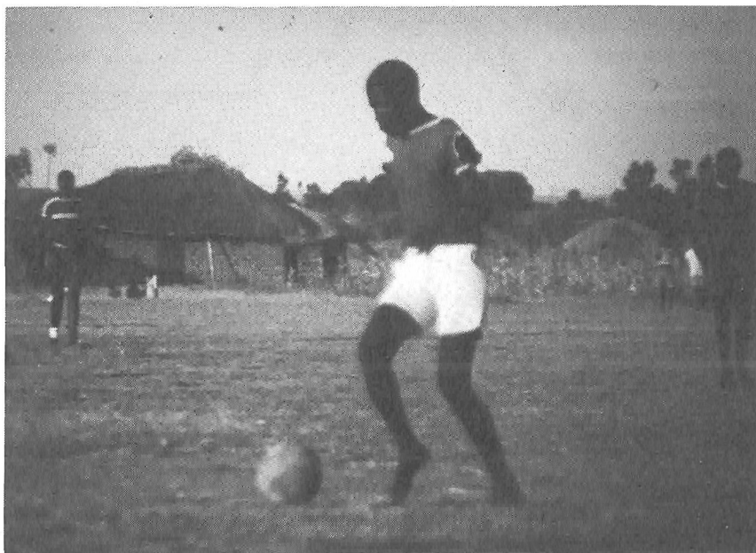
Fra kampen i Nyanguge

Tilbage i tiden var alle menneskene delt op i forskellige aldersgrupper, som hver havde deres specielle dans til at identificere dem, hver havde deres opgave og funktion. I tidens løb udviklede dette system sig til, at unge mænd og kvinder organiserede sig i forskellige arbejdsfællesskaber – for at få arbejdet gjort hurtigere og nyde det sociale samvær. Disse fællesskaber blev kaldt dansegrupper, fordi hver gruppe havde en dans, der identificerede den. Grupper med samme arbejdsform og med samme oprindelse i deres dans, havde organiseret sig i 'selskaber', dvs. store foreninger, som dækkede hele landet. Der var to af disse store, landsdækkende selskaber: BAGIKA og BAGALU. Overalt hvor de mødtes til festivaler og lignende konkurrerede grupper fra disse to store selskaber om, hvem der var den mest populære. De udfordrede hinanden til dansekonkurrence. Den vindende her var den, der trak de fleste tilskuere. Situationen med at dansegrupper fra forskellige landsbyer konkurrerede indbyrdes svarer til situationen hvor fodboldhold fra hver sin landsby spiller kamp mod hinanden. I hver dansegrube var der et bestemt bevægelsesmønster for hver dans og en danseleder, der bestemte. Dette skabte en stor grad af samhørighed og fællesskab inden for gruppen. Det samme kan opleves på et fodboldhold, hvor hele holdet – i gudbenådede