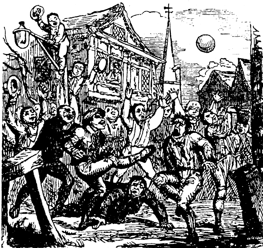
Folkefodbold i byernes gader var et voldsomt spil, der gav anledning til uorden og mange tumulter. Billedet her er fra begyndelsen af 1800-tallet.

håndskydevåbenet at blive dominerende og trænge langbuen ud. Hermed forsvandt det ene af fodboldforbudenes begrundelser. Dette mindskede dog ikke forbudene og fordømmelserne mod fodboldspilleriet. Herefter blev det henvisningerne til tumulter og uorden, der blev dominerende i fordømmelserne.