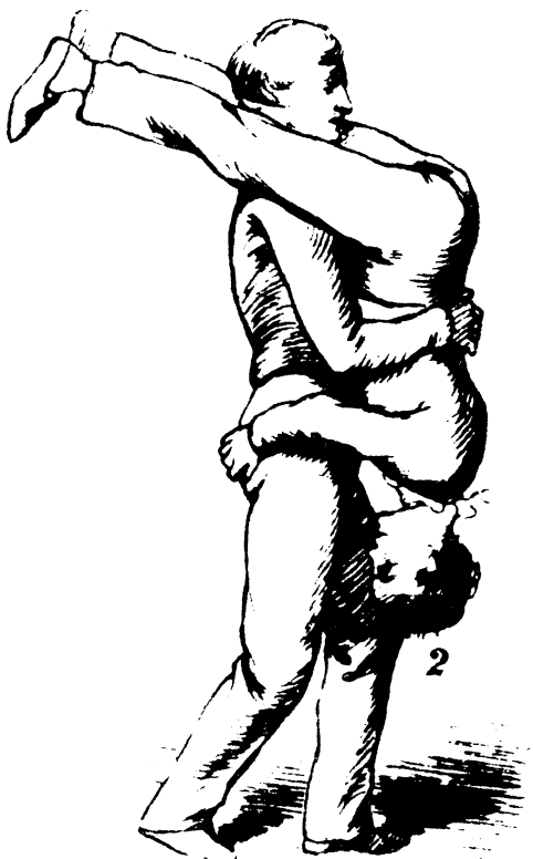
»Vende steg« Illustration fra J. Lauritsens »Underholdende og dannende Legemsøvelser for unge Mennesker«. (1865).

Det hedder i indledningen til 1. del: »Det er først naar Folk af egen Drift udfylde en Deel af deres Fritid, især den, som unge Mennesker tilbringe i hinandens Selskab med dannende og underholdende Legemsøvelser, at man kan sige at Friheden og Oplysningen have beaandet Folket i den Retning (kraft, hårdførhed, mod). For endmere at udvikle denne Sands hos den opvoxende Slægt, vort fremtidige eneste Dannevirke, og for at forøge det Stof, som paa en hensigtsmæssig Maade saavel kan tilfredsstille Trangen hos den Unge til at røre sig som Samfundets Krav paa at faa kraftige til Livets