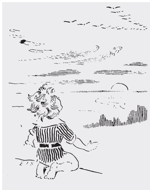
Fra E. Thompson Setons bog om Woodcraft-bevægelsen (20. udgave, 1925), en forløber for spejderbevægelsen.

Selv om sport og friluftsliv i mange henseender er lette at adskille fra hinanden, findes der også former for sport, der kan ses at have antaget friluftslivets former. I dette sportificerede friluftsliv møder vi en del af de træk, der kendetegner sport, så som konkurrence, elitisme og overvindelsestrang (hurtigere, højere, stærkere). Dette kendes indenfor fjeldklatring, overlevelsesture i vildmarken, kanindræberkurser. I forbindelse med elitismen kan tendensen til at ville ekskludere andre også opstå. Det er ikke mindst i konflikterne med ægte »naturfolk«, at nogle af sportens ældste, ekskluderende træk bliver genkendelige – dvs. eksklusionen af folk, der bruger naturen til at overleve, til fordel for dem, der bruger den til nydelse.