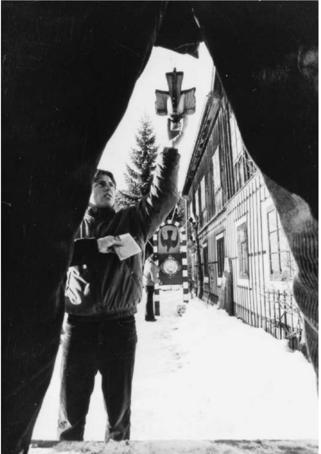
Taubenschiessen angiveligt fra Østrig. 16