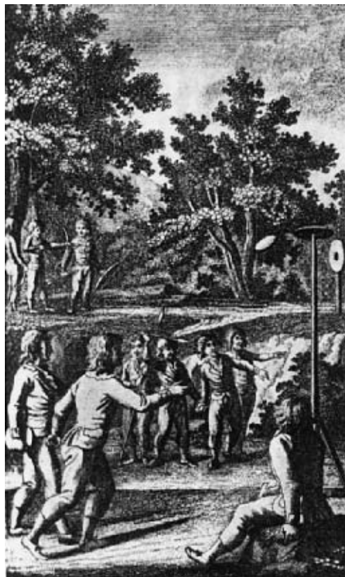
Kobberstik fra GutsMuths: »Gymnastik für die Jugend«, 1793. Øverste gruppe: Bueskydning mod skive. Midterste gruppe: Spydkast og stenkast. Nederste gruppe: Diskoskast efter horisontal skive.

Udvælgelsen skyldes formentlig, at kancelliet i 1811, inden den kgl. resolution blev udstedt, havde haft gymnastikplanerne til høring i de 10 amtsskoleledelser (alle placeret øst for Lillebælt) som var blevet oprettet. Bortset fra Præstø amt, der afviser gymnastikken, er de øvrige amter positive. Synspunkterne deler sig i et filantropisk og et militært synspunkt, og resolutionen synes at være et kompromis, uden at der dog heri ligger en egentlig forklaring på, hvorfor det netop er de nævnte øvelser,