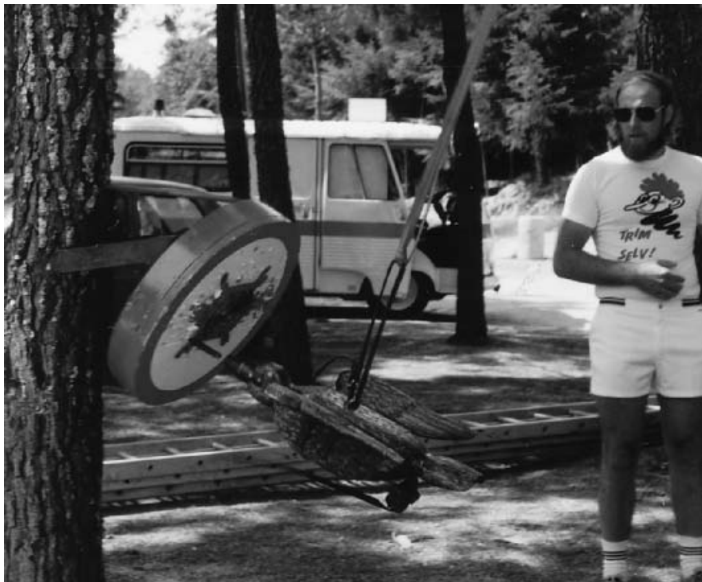
Trækfuglen har netop ramt skiven, hvor næbbet er blevet siddende.

ken, og således er det netop i Østrig, hvor »Taubenschiessen« også dyrkes i nutiden, dog uden at østrigske legeforskere har været opmærksomme på det. 15