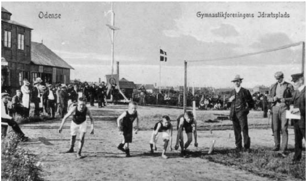
Drengeløb på Odense Gymnastikforenings anlæg bag Odense Kaserne omkring 1900. Senere måtte gymnastikforening rydde pladsen, som skulle bruges til kolonihaver. Atletikfolket flyttede derfor til Kochsgade, hvor kommunen anlagde et nyt idrætsanlæg (Stadsarkivet).

Efter århundredskiftet lød kravet om bedre idrætsfaciliteter stadig højere. Det var et krav, som tog til i takt med, at idrætsforeningerne oplevede en mærkbar medlems-