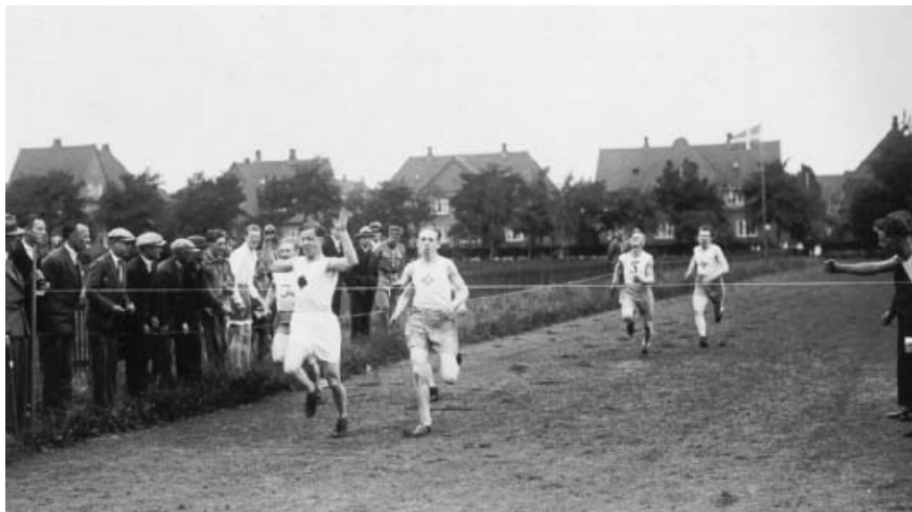
Slutspurten sættes ind på atletikanlægget i Kochsgade omkring 1930. Banen var som regel afskærmet med sækkelærred, for at ikke-betalende tilskuere ikke skulle kunne kigge ind. I baggrunden ses ejendomme i Heltzensgade.

fremgang. Da kommunen omkring 1915-16 gik i gang med at udlægge en stor del af Kræmmermarken, umiddelbart nord for jernbanelinien og øst for Skibhusvej, til bebyggelse, blev der også projekteret en sportsplads.