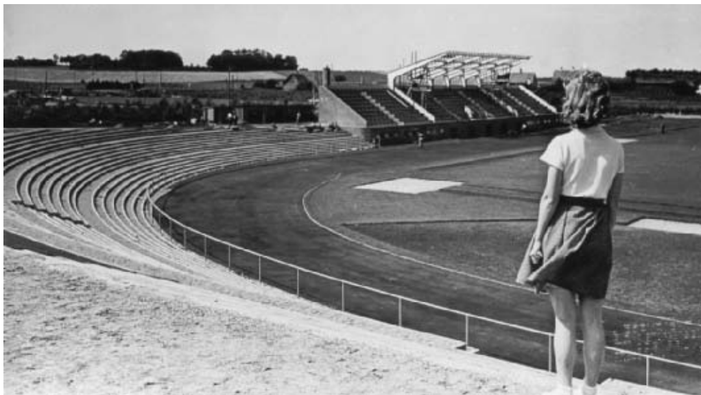
Atletikstadion med tribune og ståpladser kort før indvielsen i 1941. Atletikstadion fik sin egen indgang fra Snapindvej (den nuværende Stadionvej). Under tribunen var der bl.a. omklædningsrum, hvoraf to var særligt store, beregnet til masseopvisninger i gymnastik og lignende. I midten af tribunen var der – ligesom ved fodboldtribunen – en »borgmesterloge« og en presseloge.

Prisen for stadionbyggeriet lød på i alt 1.314.266 kr. og 17 øre – hvilket svarer til hvad ca. 350 ufaglærte arbejdere tjente om året. Stadion bestod af i alt fem baner: En opvisningsbane til fodbold, et atletikstadion, en cricketbane, en hockeybane og en katebane. Fodboldbanen havde plads til ca. 12.000 tilskuere, hvoraf 1.000 kunne sidde ned. På atletikstadion var der plads til 1.000 siddende på tribunen, der til dels var overdækket, mens der var ca. 9.000 ståpladser.