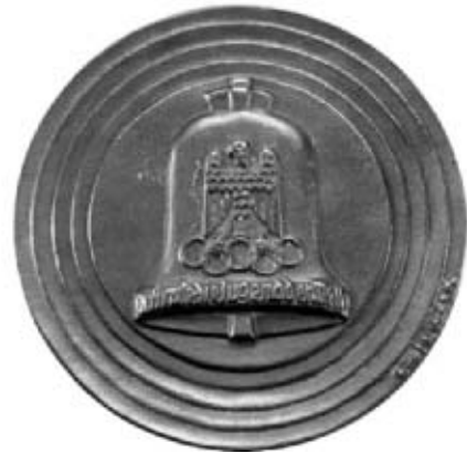
Erindringsmedalje og ikke en OL-medalje fra OL i Berlin i 1936.