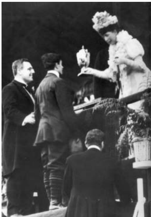
Den danskfødte dronning Alexandra overrækker sin trøstpræmie, en guldpokal, til den diskvalificerede Dorando Pietri.

i 1908. Dels eksisterer White City Stadium ikke mere, og dels blev London som bekendt bombet under krigen, og ved genopførelsen er gadeforløb blevet ændret.