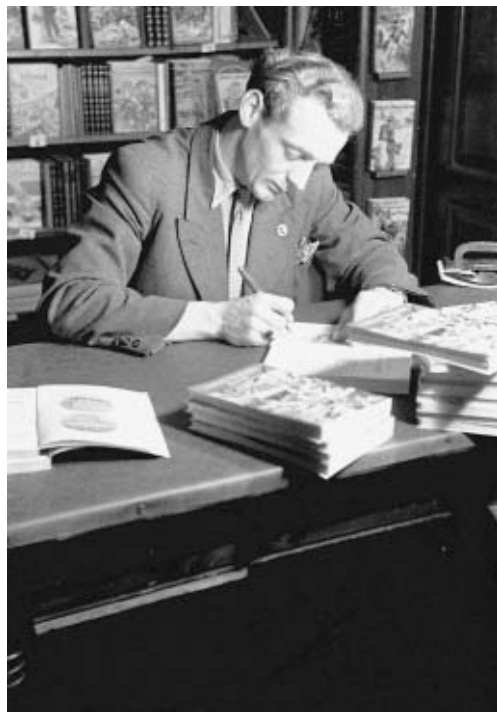
Jørgen Leschly skriver autografer i 1948