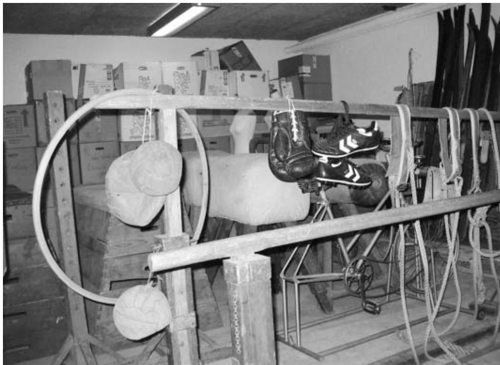
Gymnastik- og Idrætshistorisk Samling (GIS) har som et af de få steder i landet idrætshistoriske genstande (Vartov-Arkivet).

tigt at løfte dette arkiv ud af gråzonen og frem i lyset.