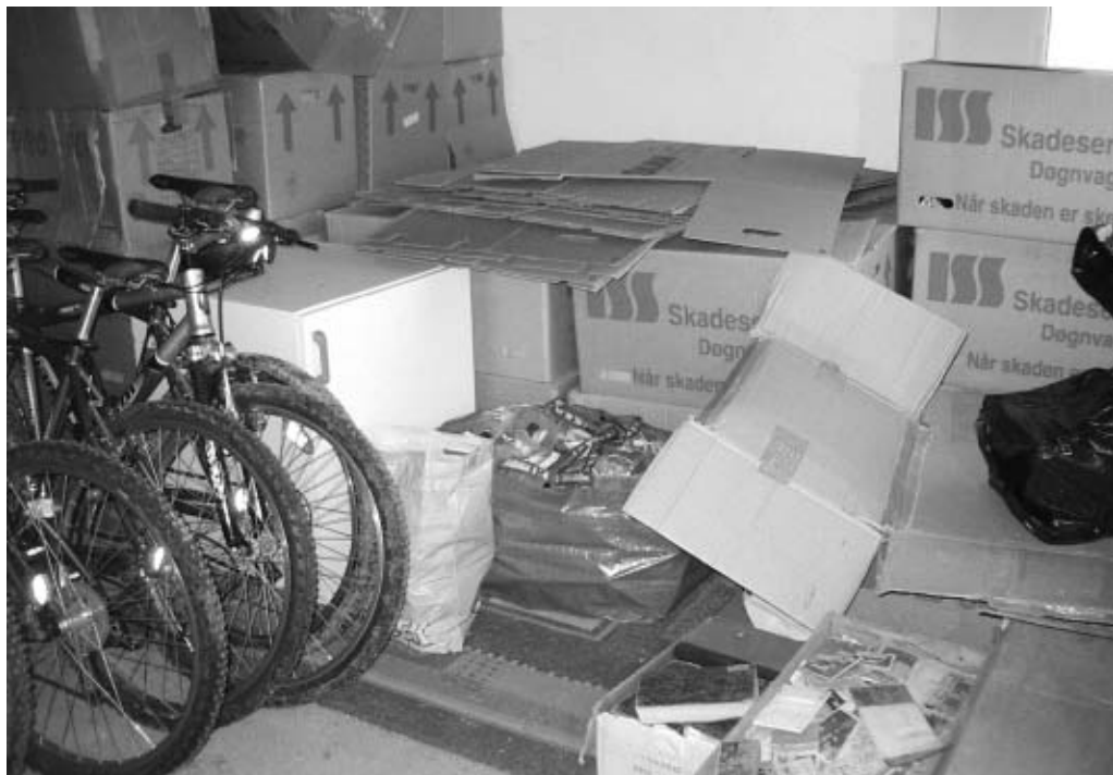
Arkivalier fra Gerlev Idrætshøjskole placeret i skolens cykel- og redskabsrum. Stadig pakket i kasser efter branden i 2000 (Vartov-Arkivet).

folkelige gymnastiks pionerer foruden en mængde fotografier? Eller hvem ved, at der på Ryslinge Højskole er arkivalier, som belyser den tidlige delingsføreruddannelse (uddannelse som gymnastikinstruktør) på de danske højskoler? Eller hvem ved, at der rundt om i landet – på amtsforeningernes kontorer – ligger arkivalier, som kan belyse samspillet mellem den folkelige idræt og lokalsamfundets politiske og kulturelle historie?