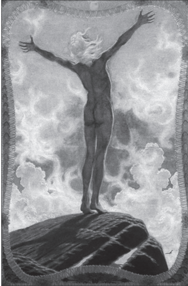
Fidus (Hugo Höppener): Lichtgebet - lysbøn. 1894